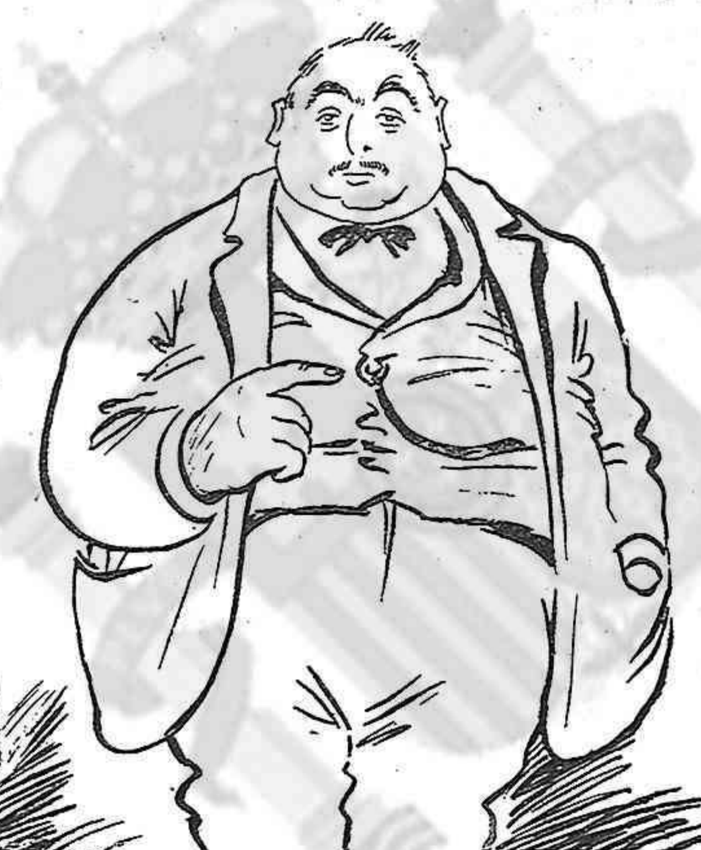
EL PROPIETARI AGRÍCOL

—¡Ah salau!... Ab las enrabiasdas que de segur ha d' ocasionar, ¡qué n' hi haurá ara al poble de malalties!