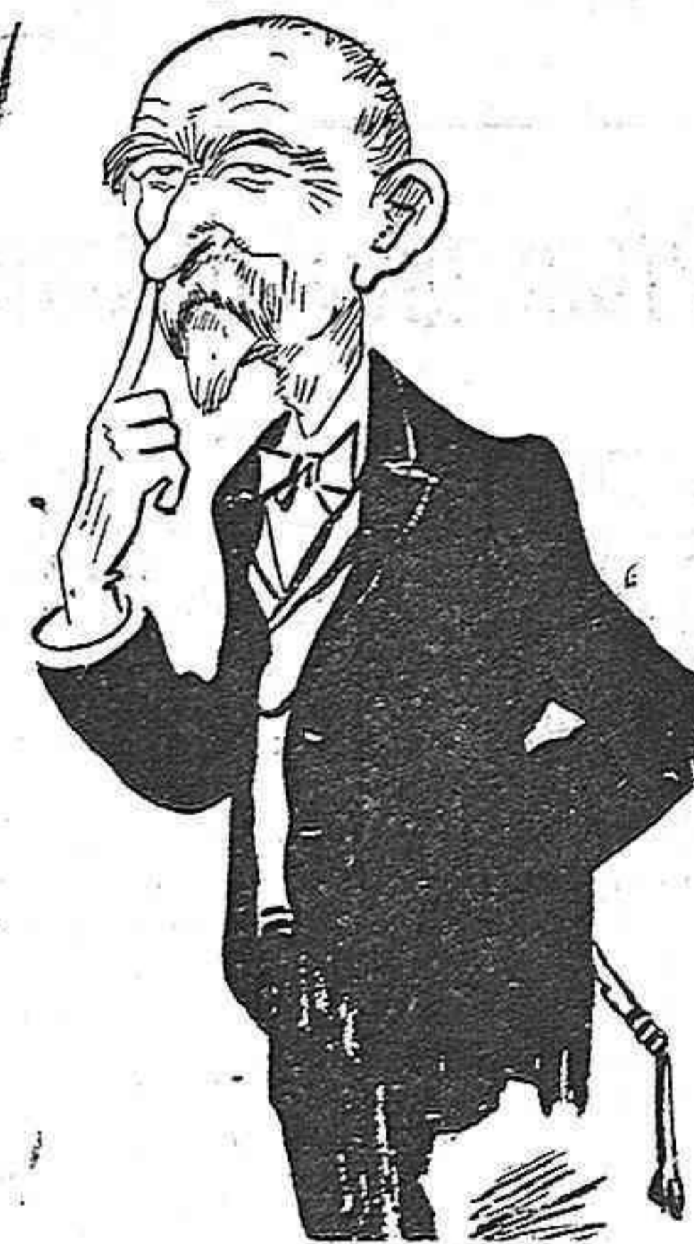
EL MESTRE D' ESCOLA

—Si ara, ab la nova lley, no m' abaixan el sucre, demano el sufragi universal altra vegada.