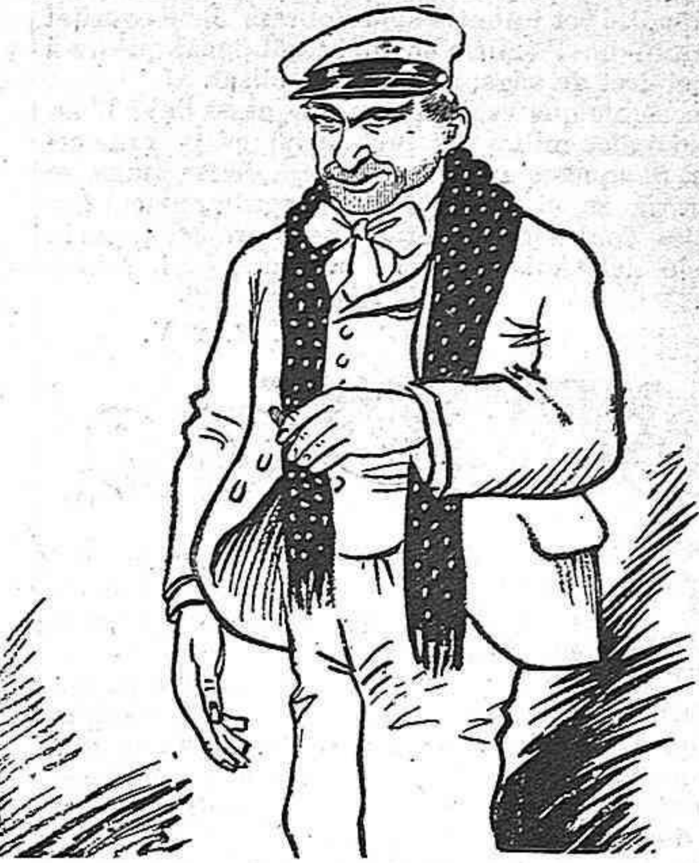
EL JUTJE DE PAU

—Mentres no 'm toquin la vara, de la lley si que me 'n rich.