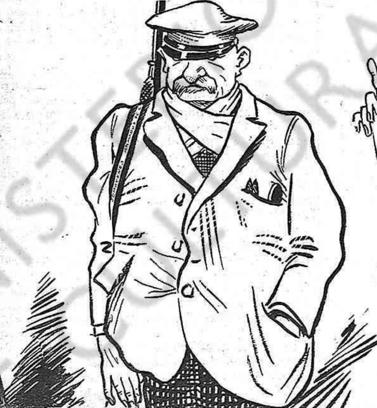
EL CABO DEL SOMATENT

—¡Ay!... Ab aixó de las mancomunitats ¡qué se me 'n gira de feyna!