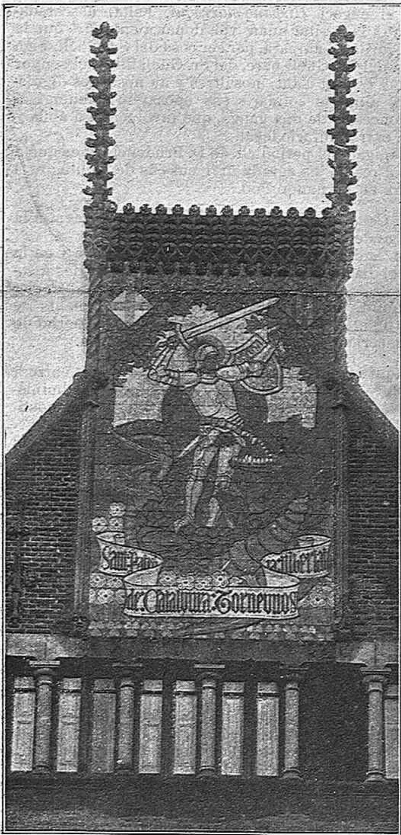
El Sant Jordi, cuerpo del delito, que forma part de la ornamentació de la casa.

PREUS DE SUSCRIPCIÓ: Fora de Barcelona cada trimestre ESPANYA, pessetas 1'50.—EXTRANGER, 2'50.