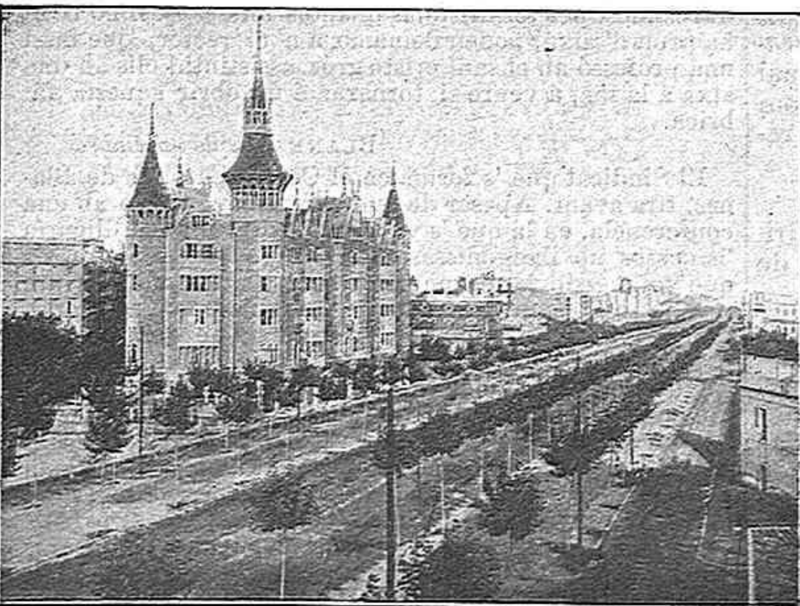
Casa de la familia Terradas, situada á la Gran Via Diagonal, calificada per don Prudencio de Casa del crimen y en torn de la qual s' ha creat la novela que tant ha fet riure durant vintiquatre horas als barcelonins.