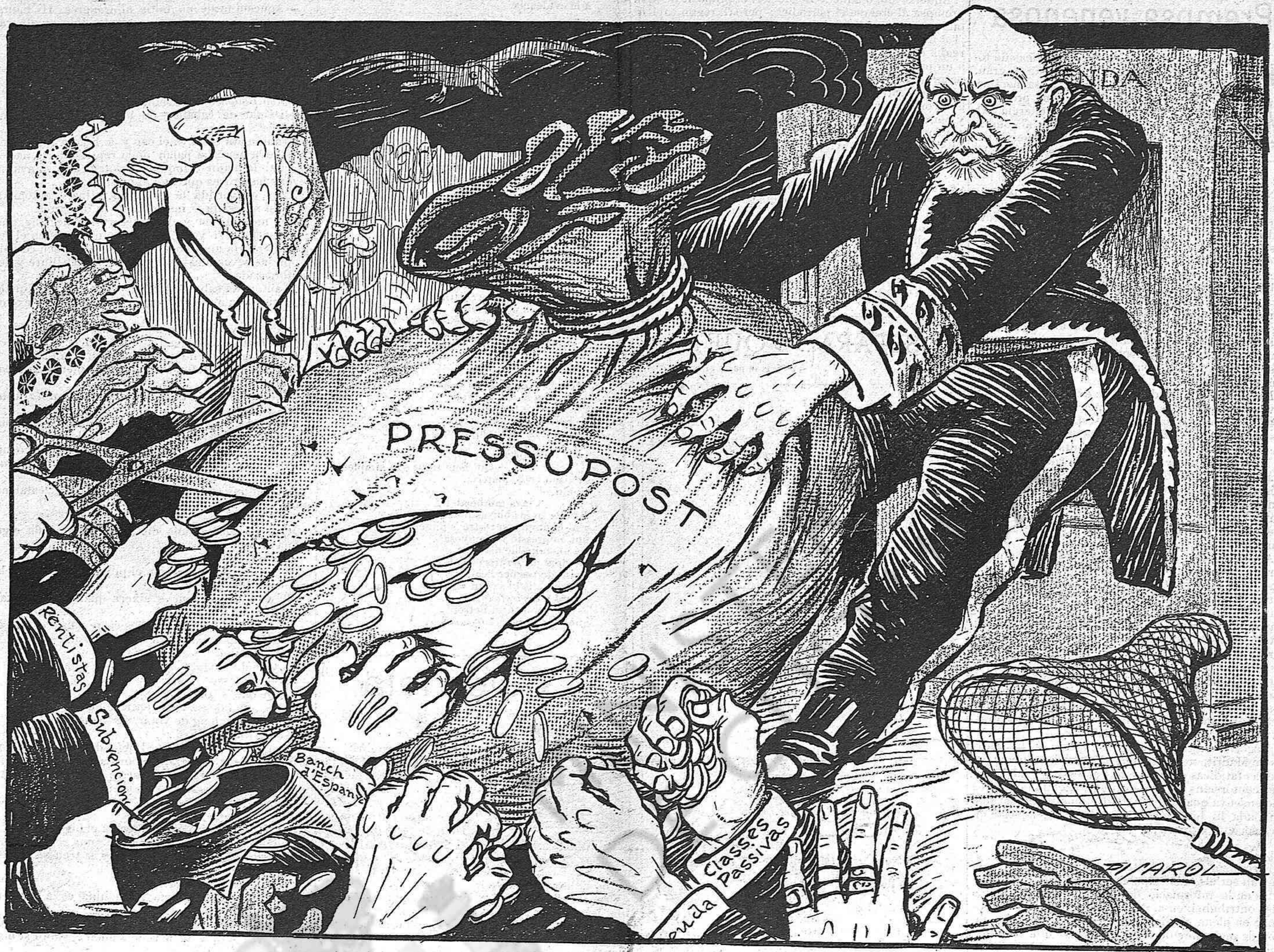
¡El sach de las esgarrapadas!