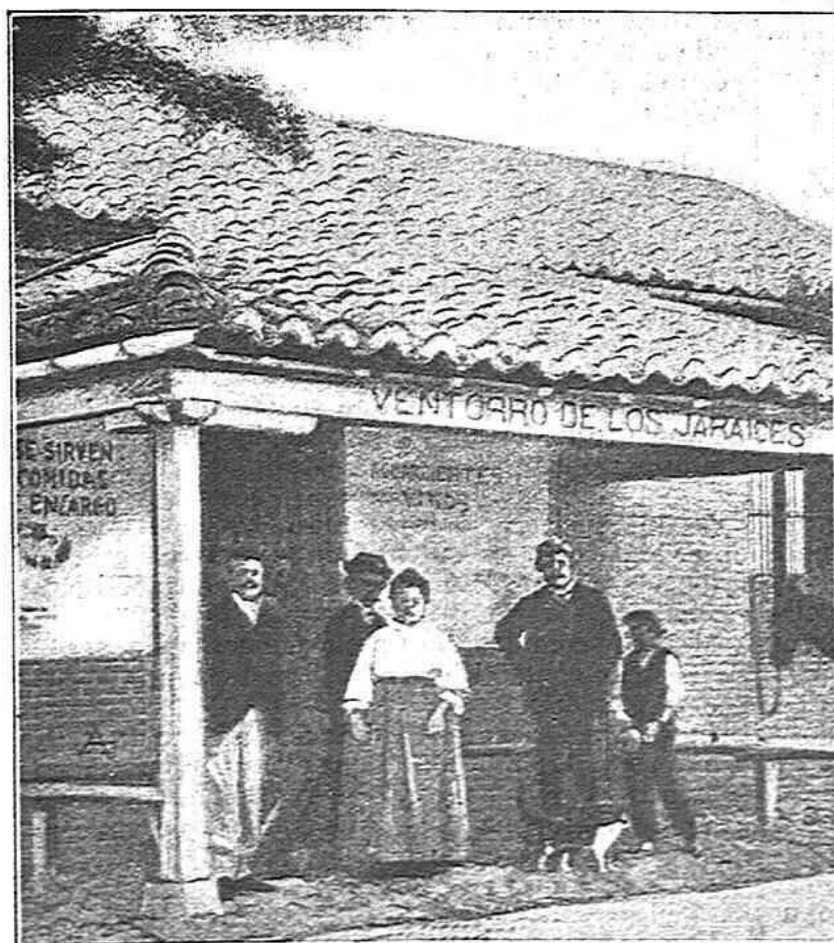
Ventorro de los Jaraices

Las ambulancias de la Creu Roja, conduhint els ferits.