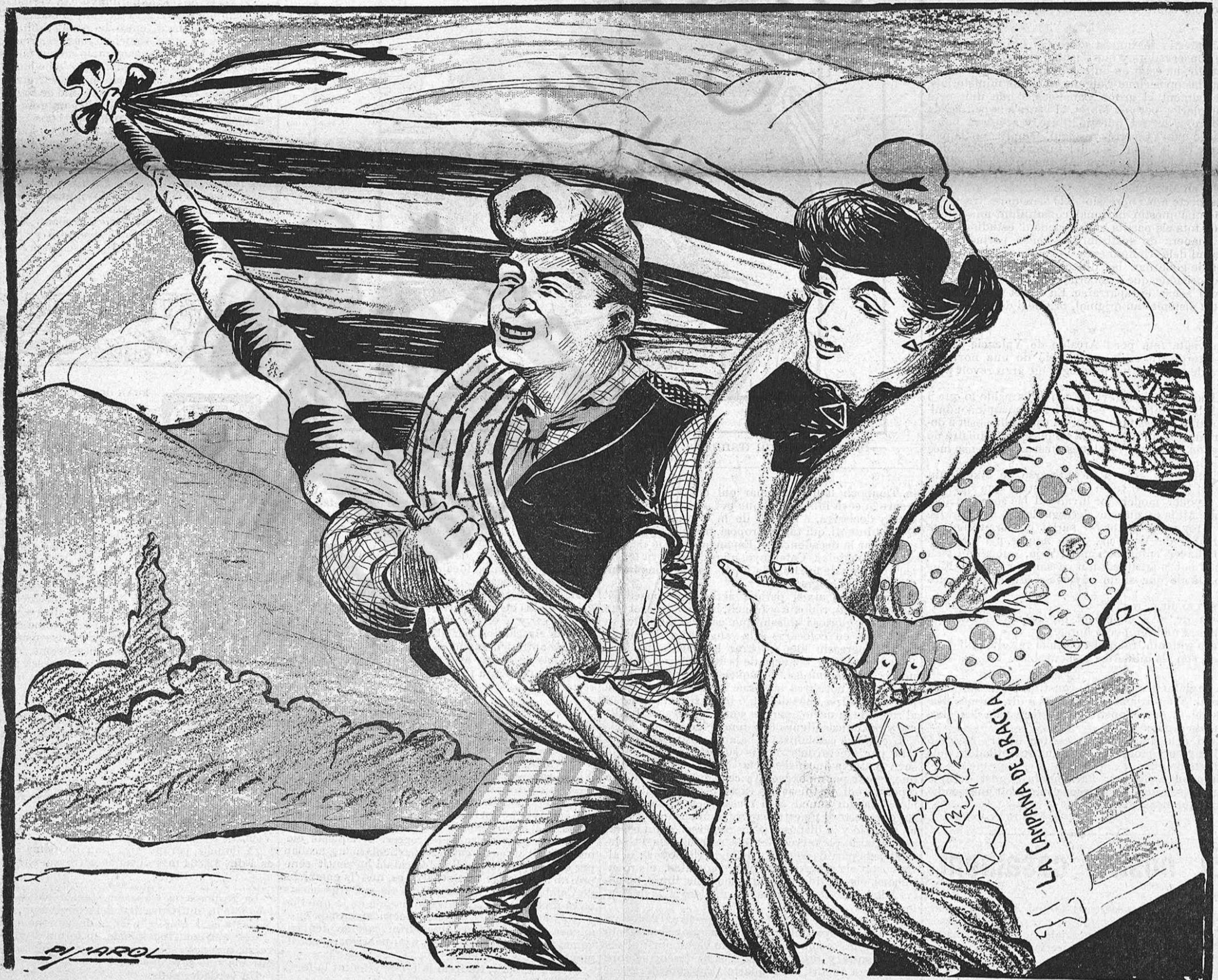
—Aquí 'l tenen el meu Marit: es l' Esperit catalá , y estém casats pel civil, perque tots dos som republicans.