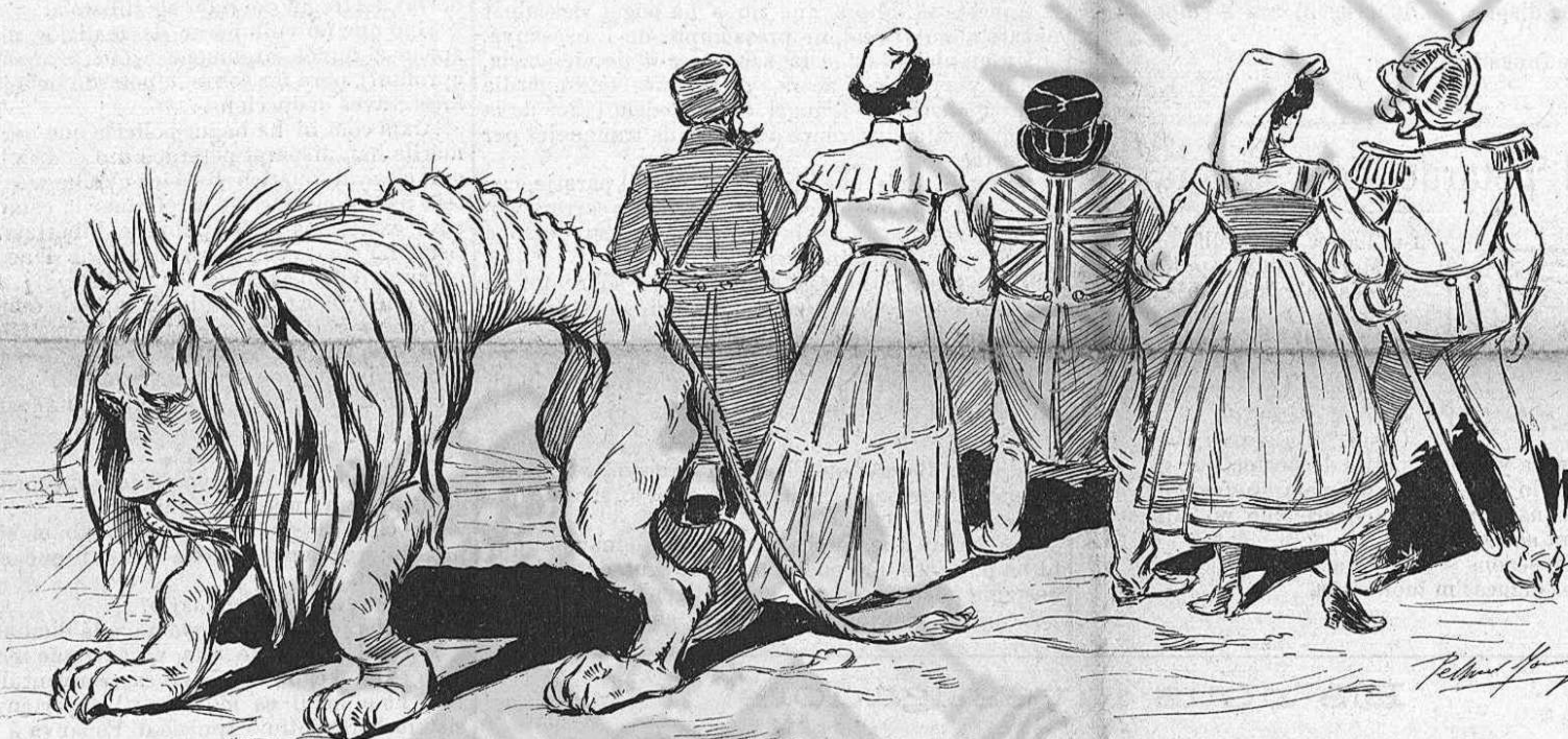
EL LLEÓ:—¡Qué solos, Dios mío, se quedan los muertos!...

convicció moral. Pero 'ls que resultaren designats refugiren el compromís.