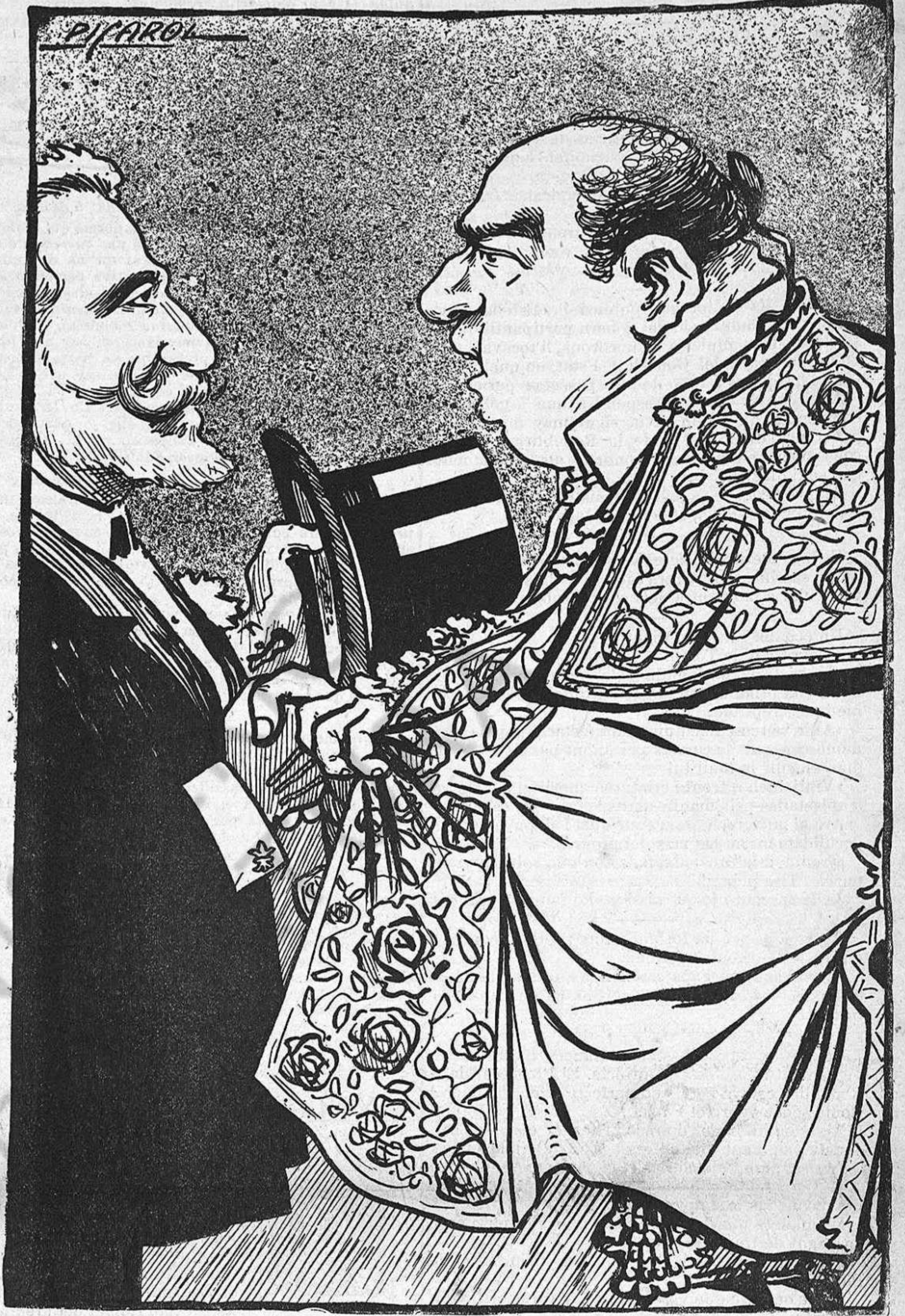
—Vaji matant, senyor Maura, y no s' amohini per res, que quan vosté 's cansi, agafo 'ls trastos y entro jo.