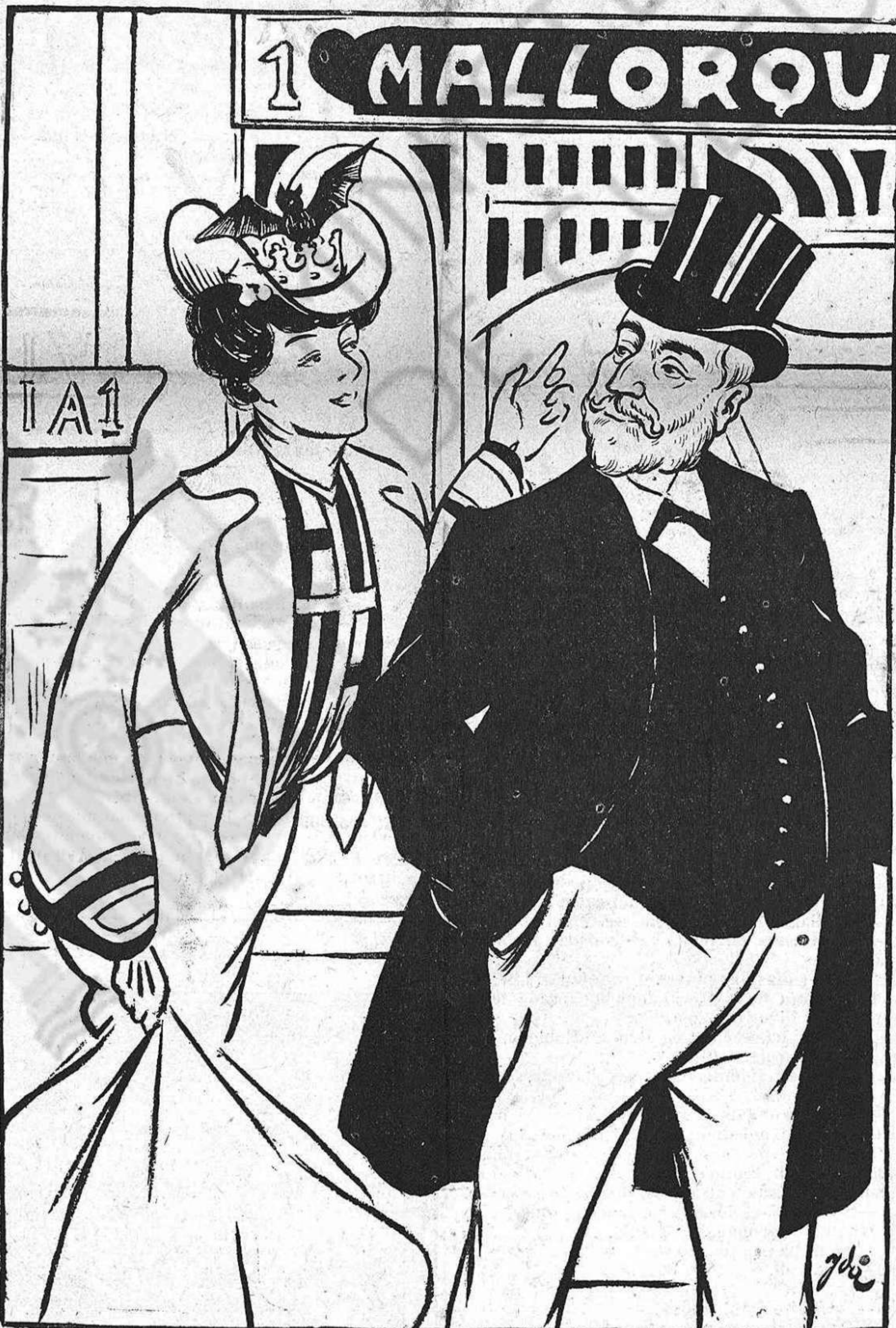
—Vaja, don Manuel, ¿qué li sembla tot aixó que diu la gent?