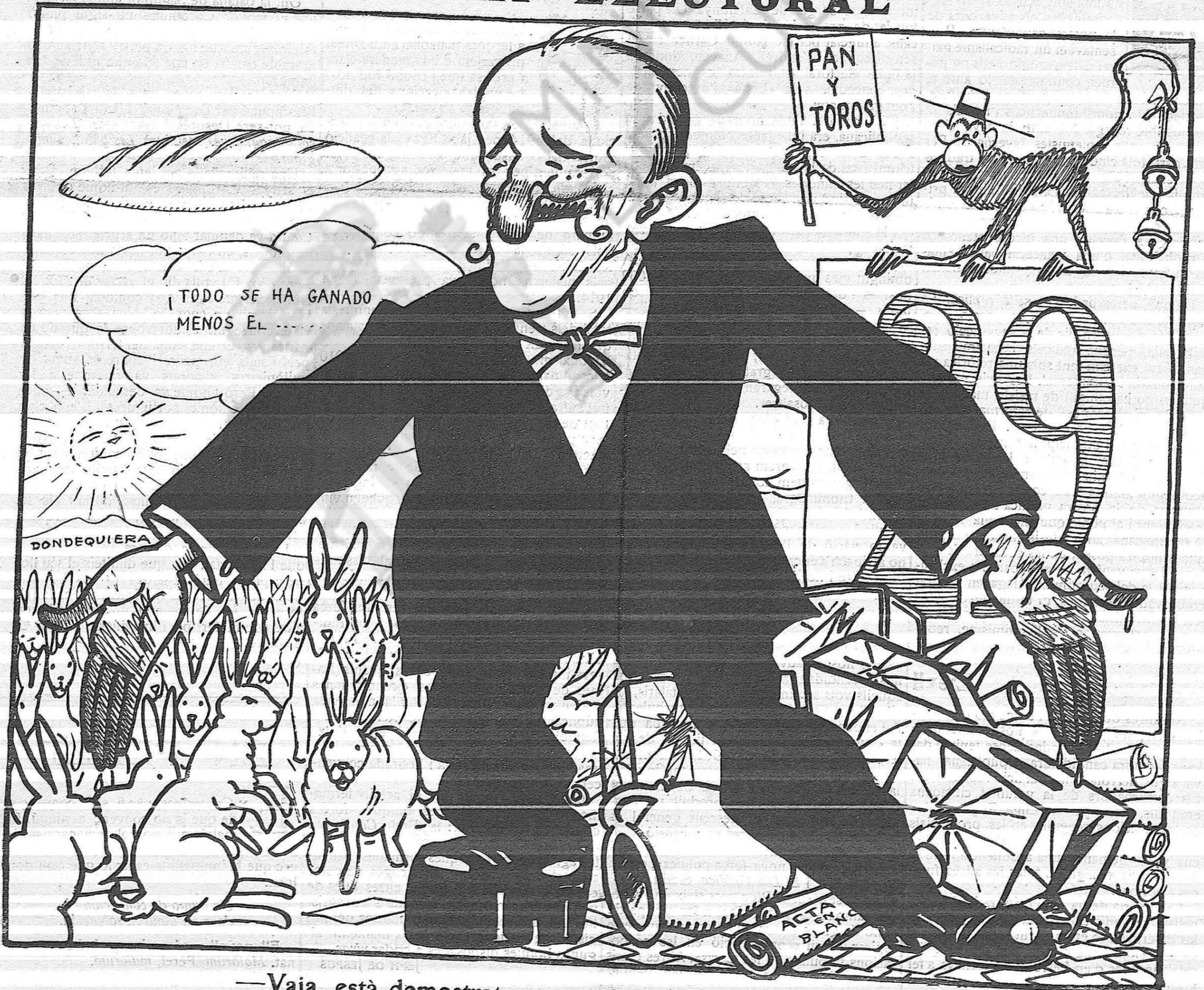
—Vaja, està demostrat que aquí no hi ha més amo que jo.