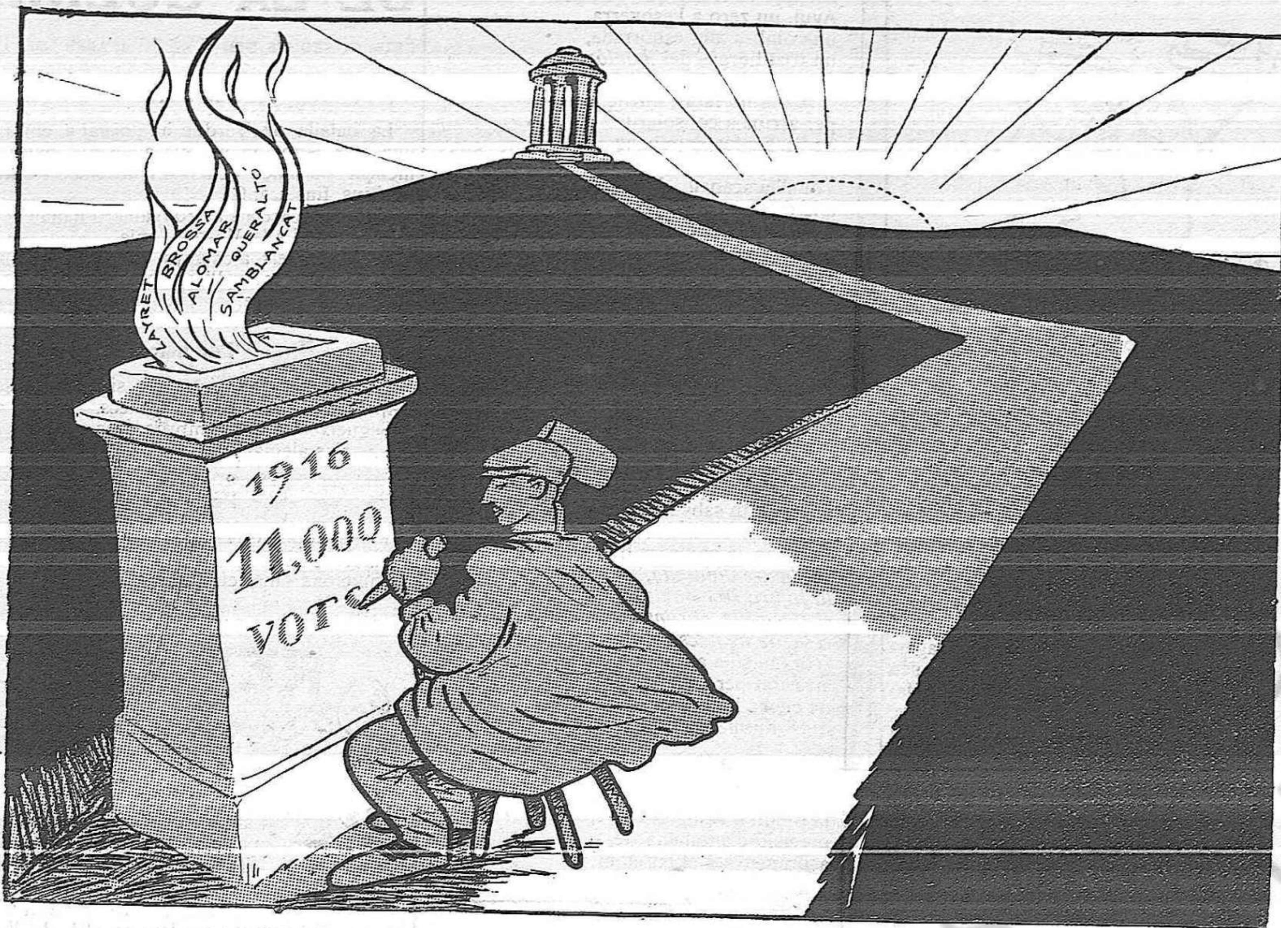
Per a que consti; per a que'l vianant sàpiga que aquí comença el gloriós camí de Reivindicació Republicana.