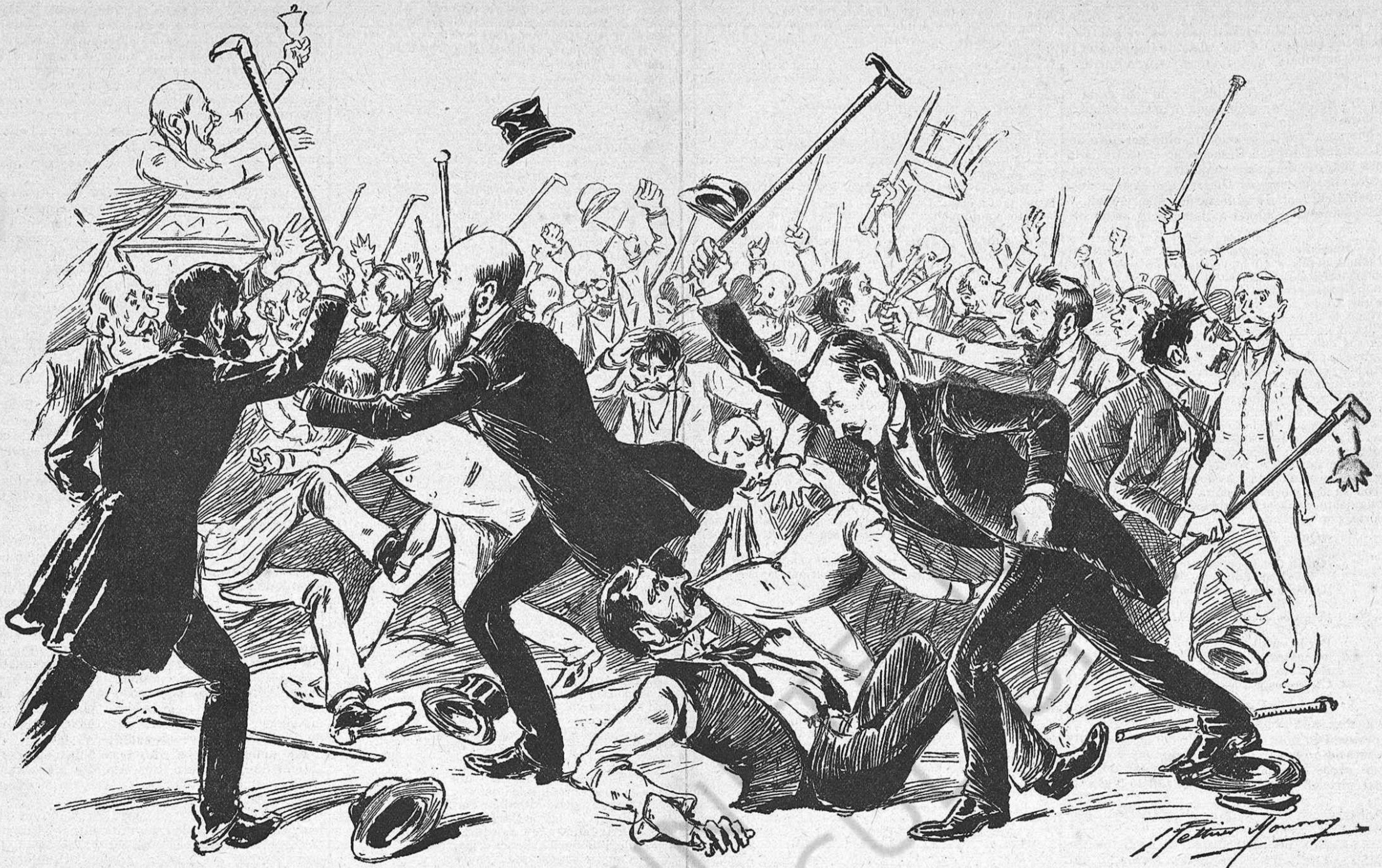
Els conspícuos del partit fusionista, elegint pacíficament el seu jefe.

el saló del Senat en una pista de fox-terrier, crech que debèm saludar el resultat de l'assemblea en la forma clàssica.