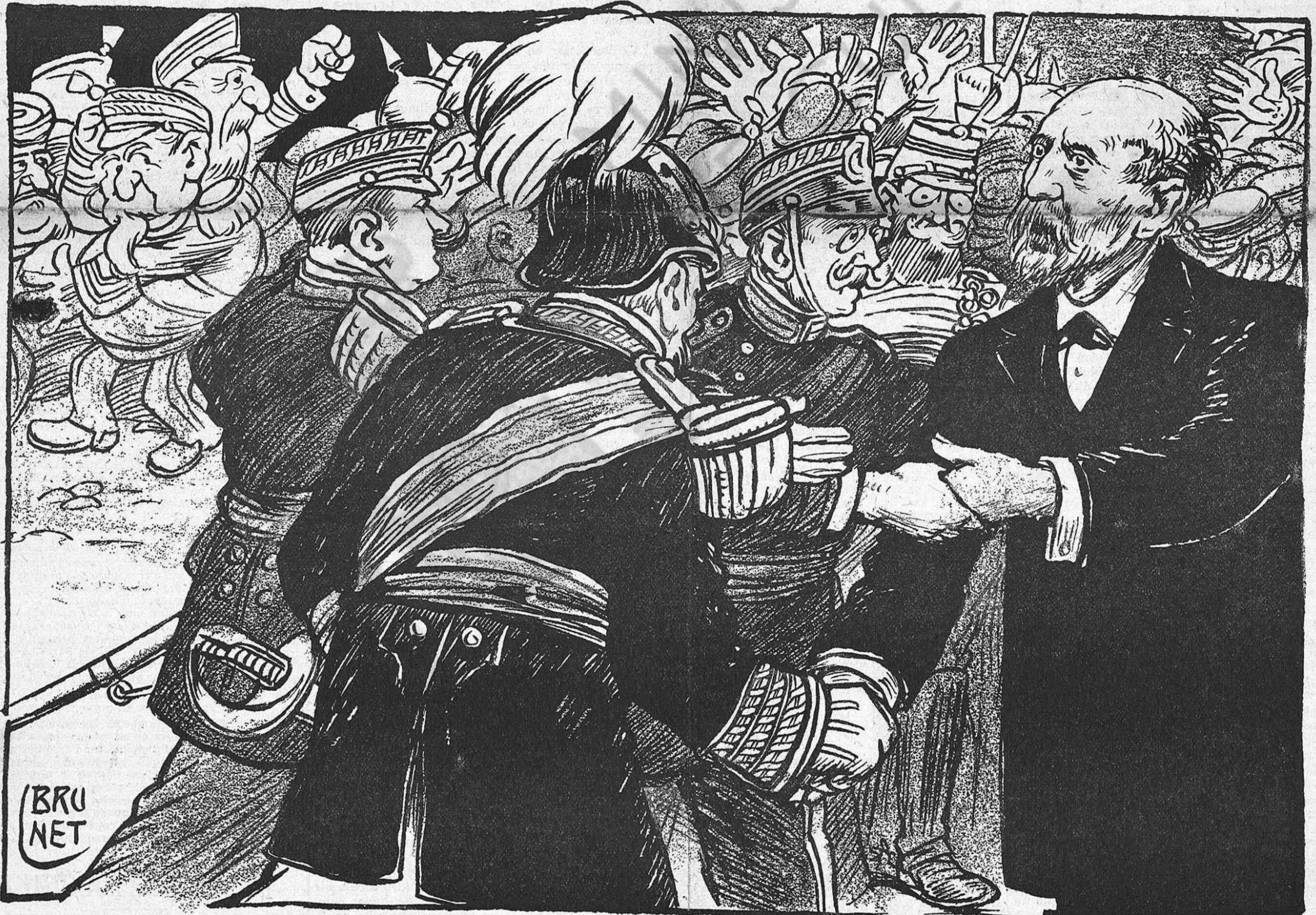
Dihent las veritats... se guanyan las amistats.