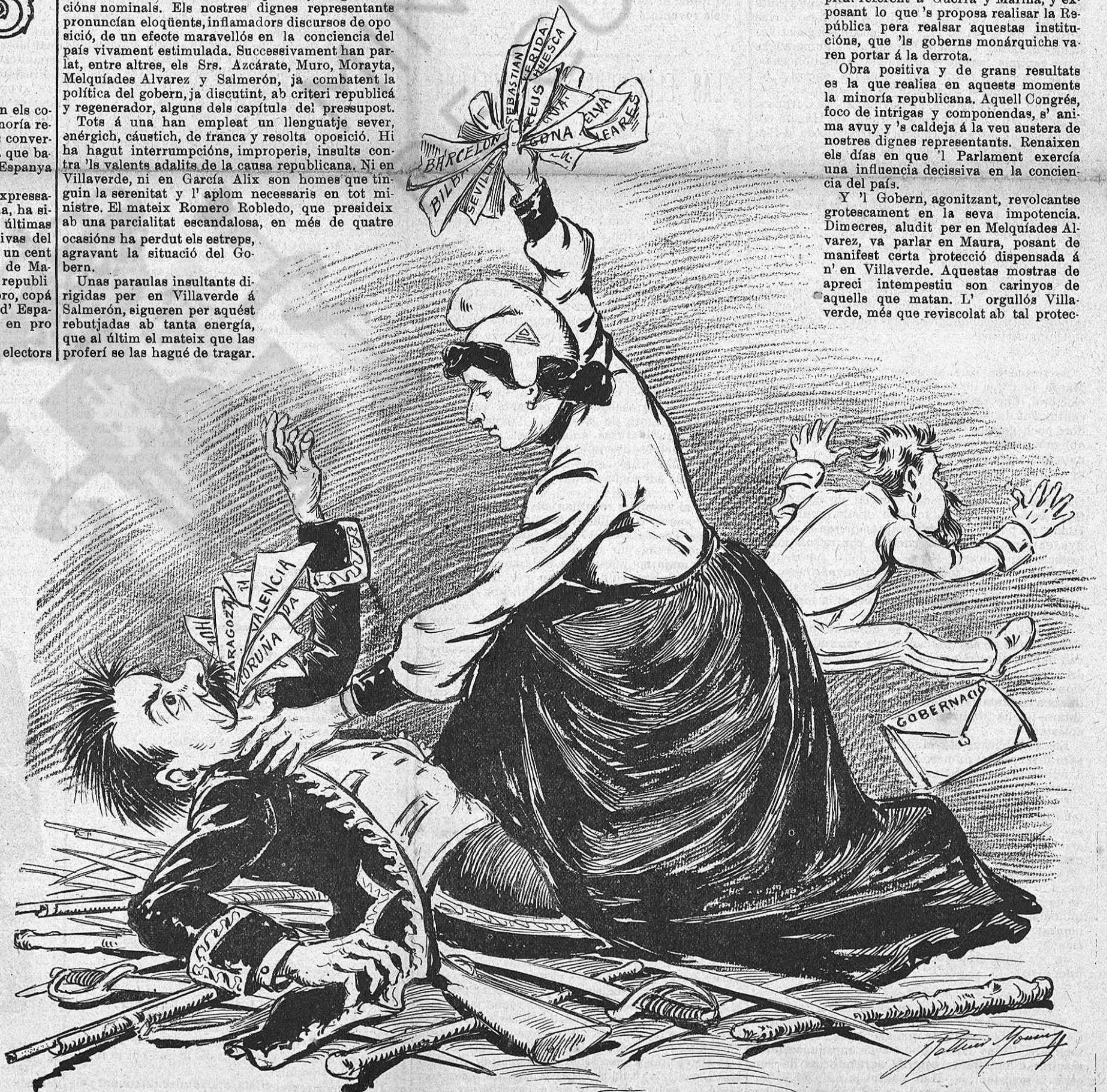
—Un' altra victoria com aquesta, y ja podeu plegar.

Estich altament satisfet del resultat de las eleccions. García Alix