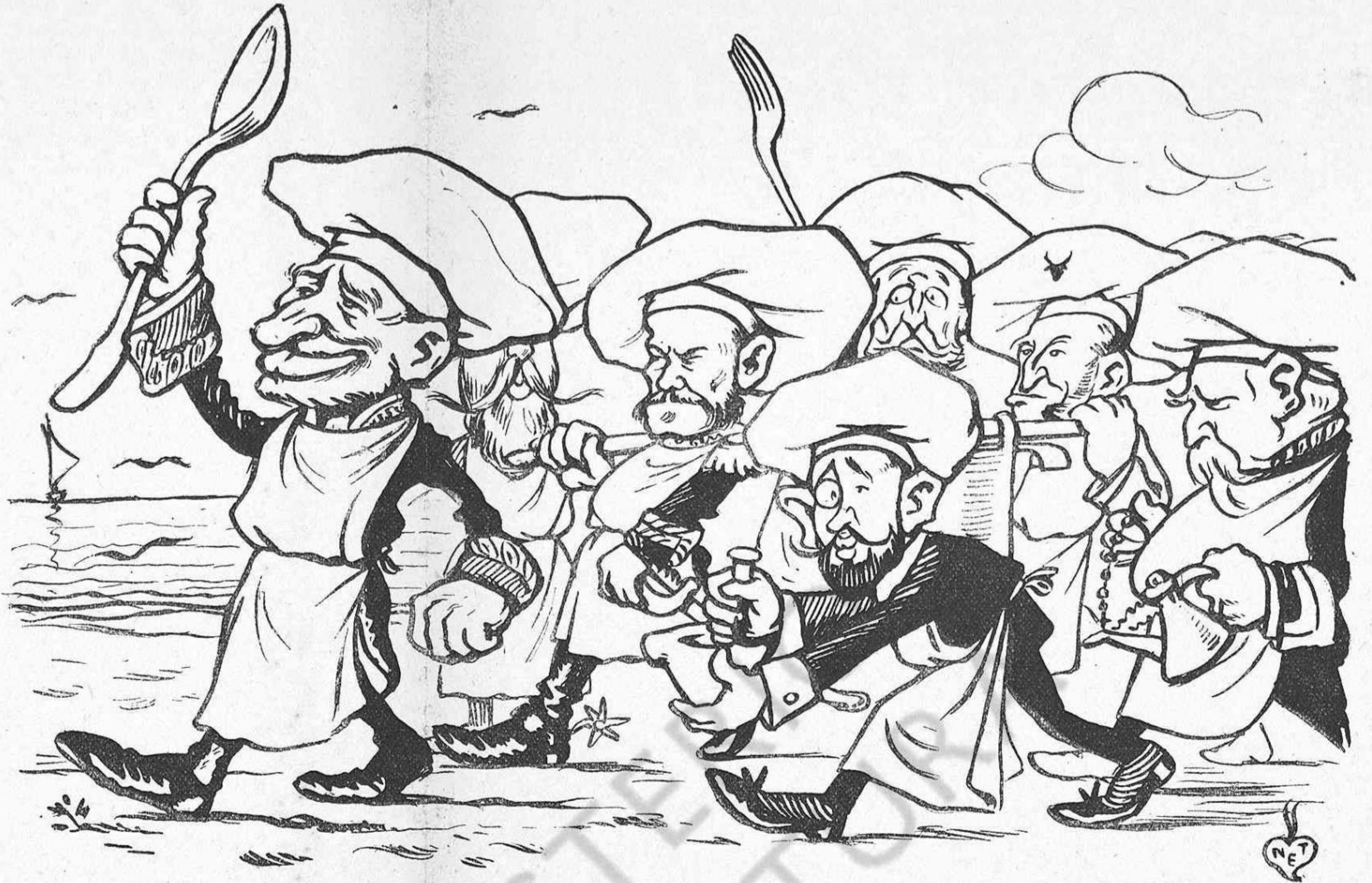
«Hoy se han declarado en huelga el jefe de las cocinas de Palacio y cinco cocineros más.» (Telégrama del Brusel del dilluns al mati.)