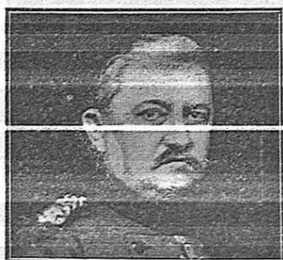
General von Bülow (alemany)