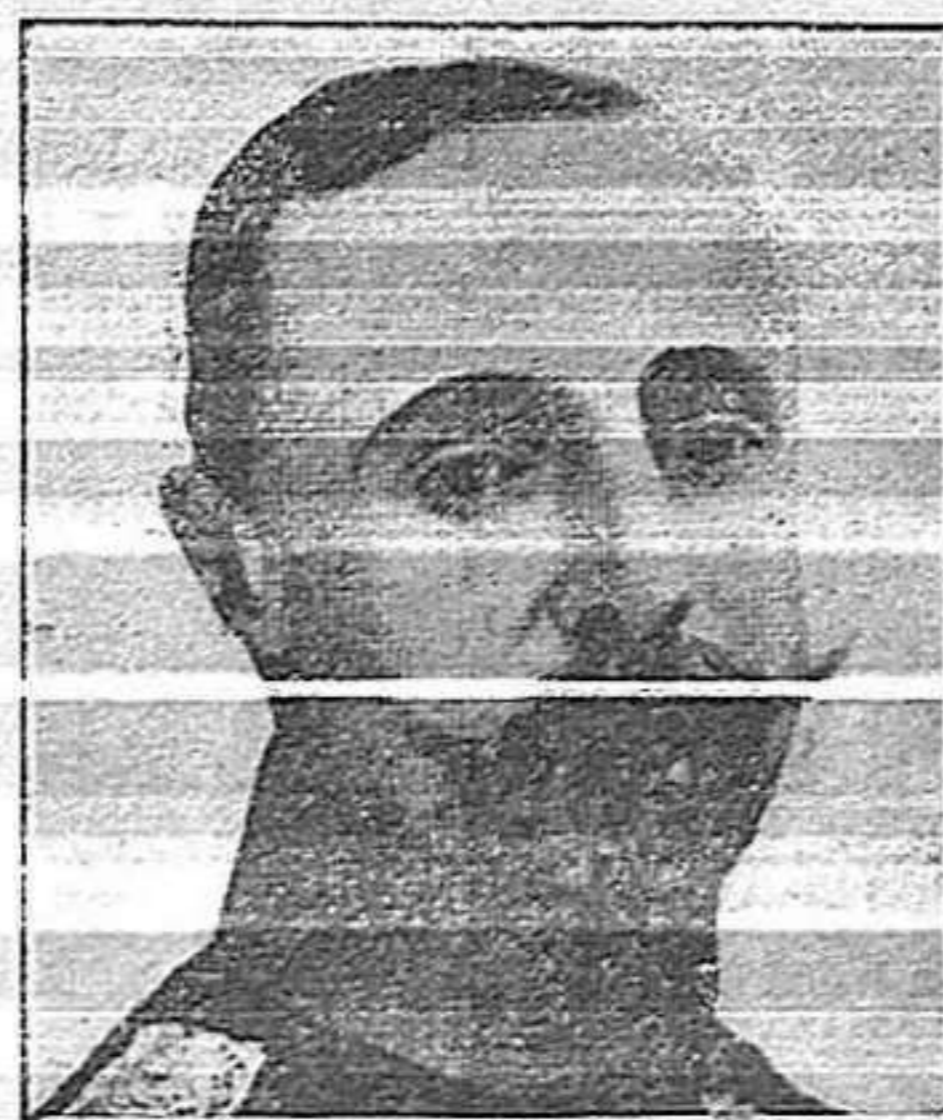
Príncep F. Guillem de Lippe (del exèrcit prussià)