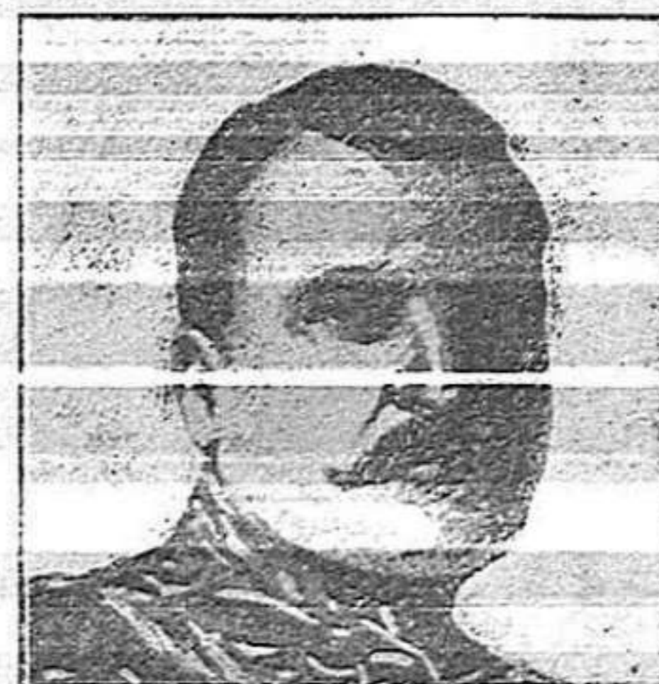
General Dimitrieff (rus)