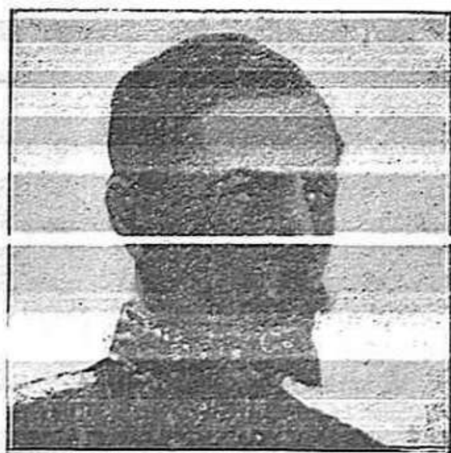
General Roques (francès)