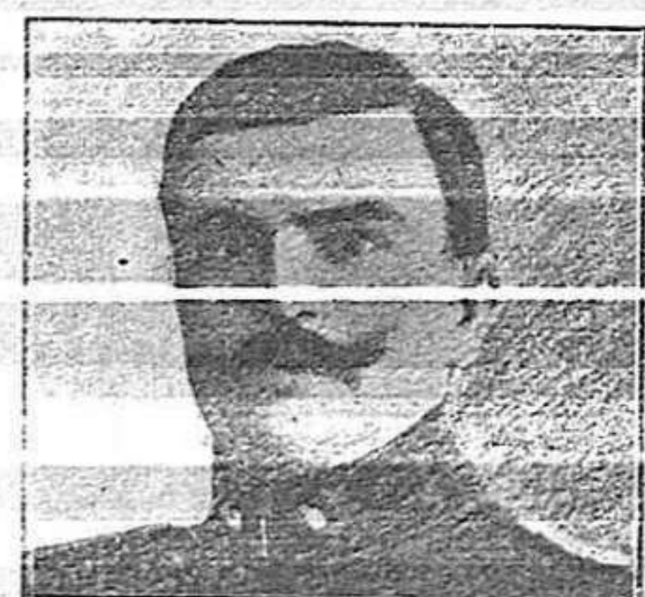
Príncep de Lascorz (del exèrcit austriac)