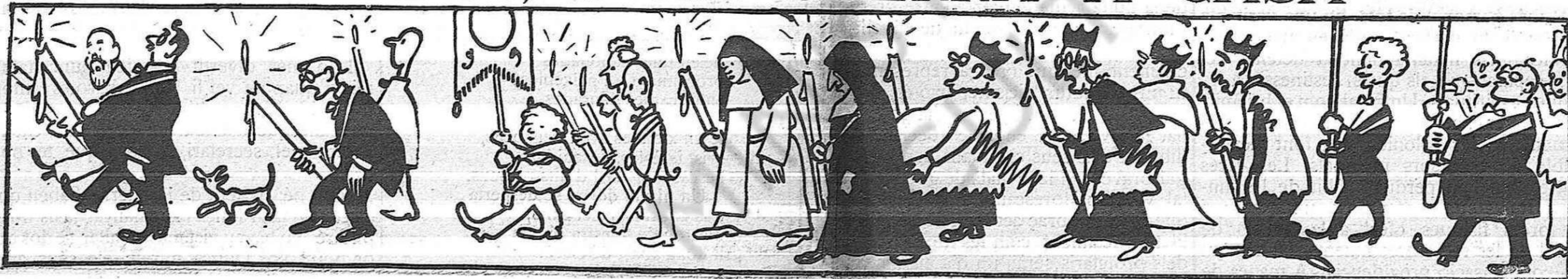
Els uns creuen que la millor manera de sanejar Barcelona és fer rogatives i altres manifestacions clericals