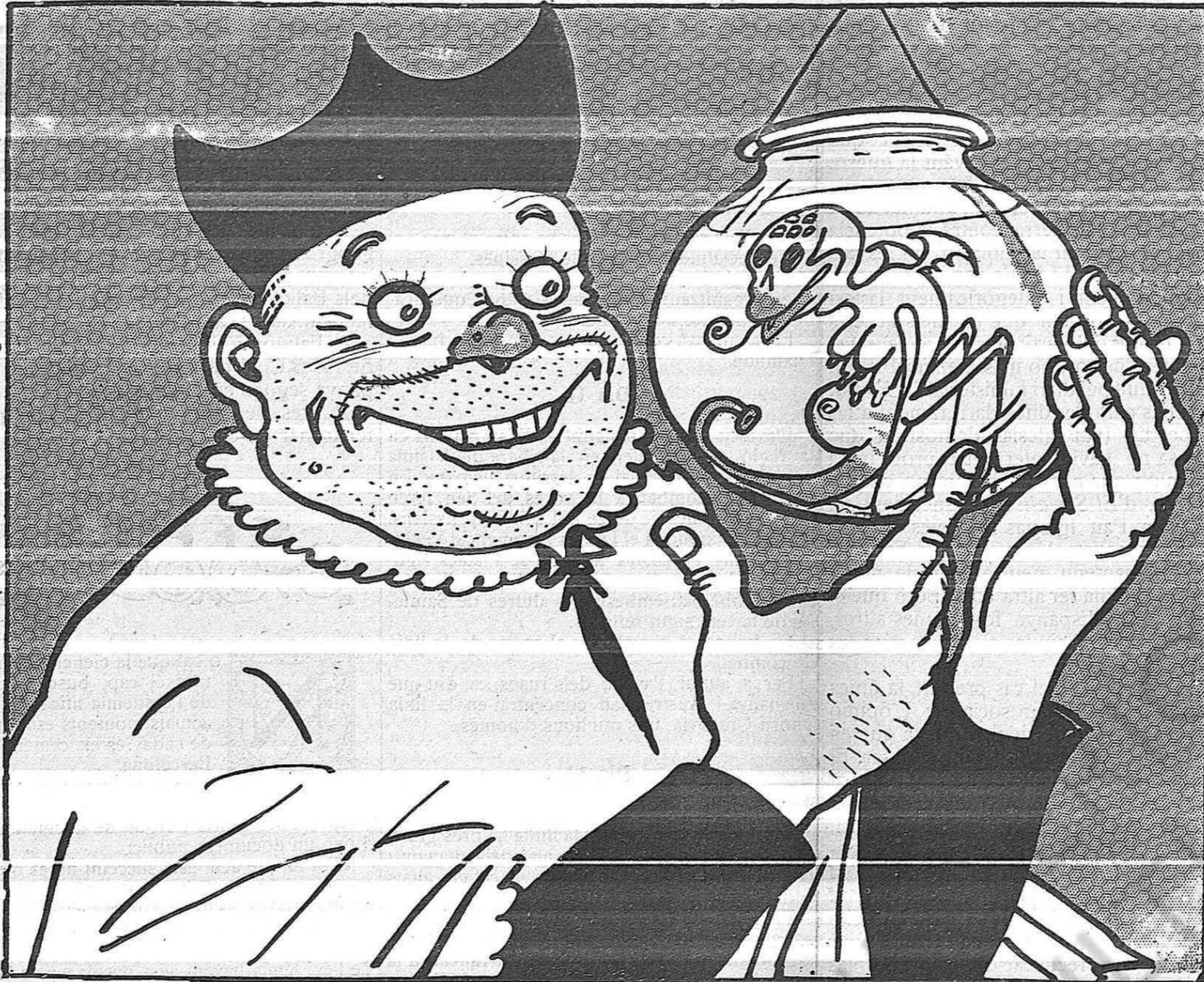
MOSSEN LLUCH I EL MICROBI D'EBERTH