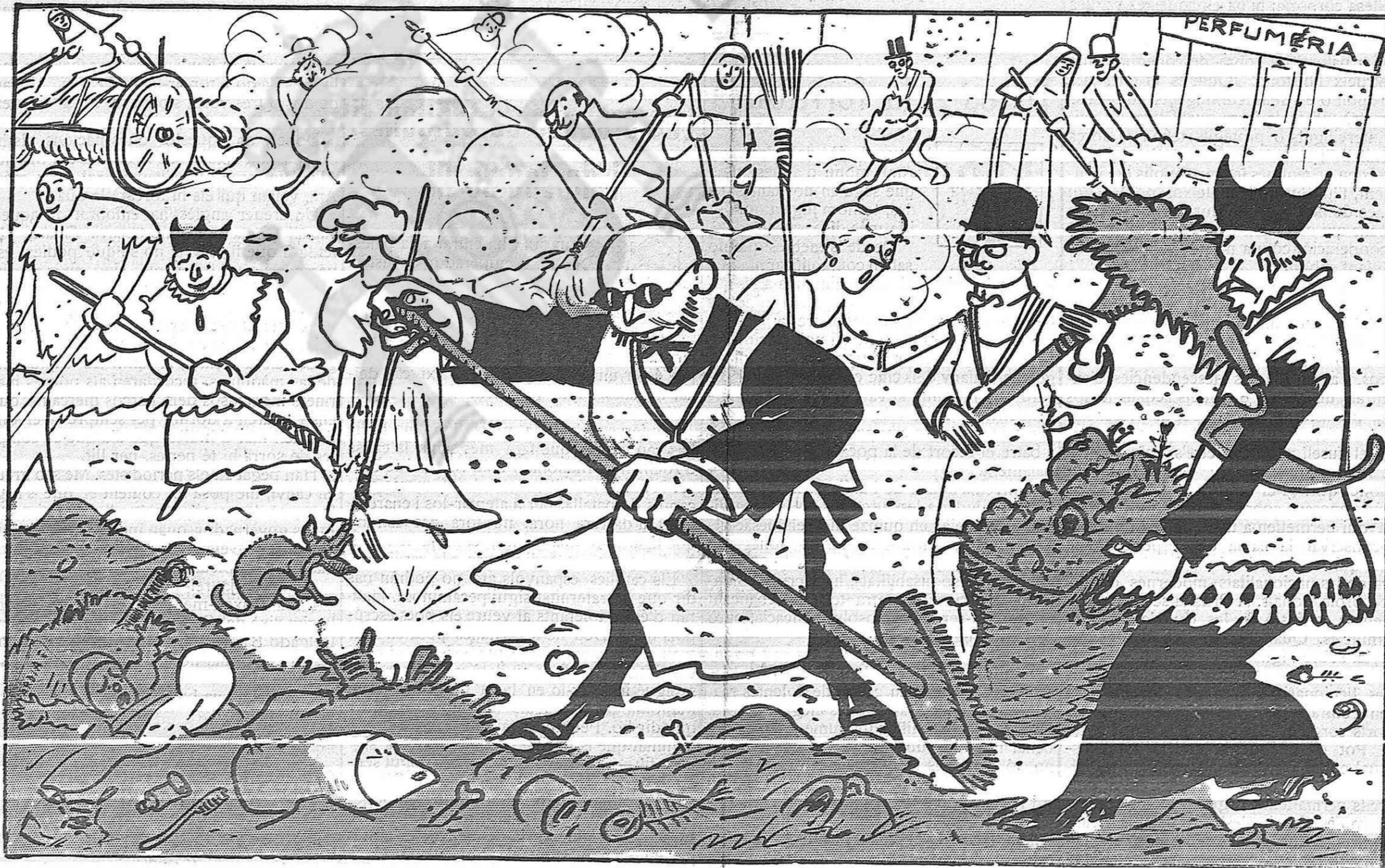
Els altres, en canvi, opinen que'l temps perdut en moixigangues podia gastar-se profitosament