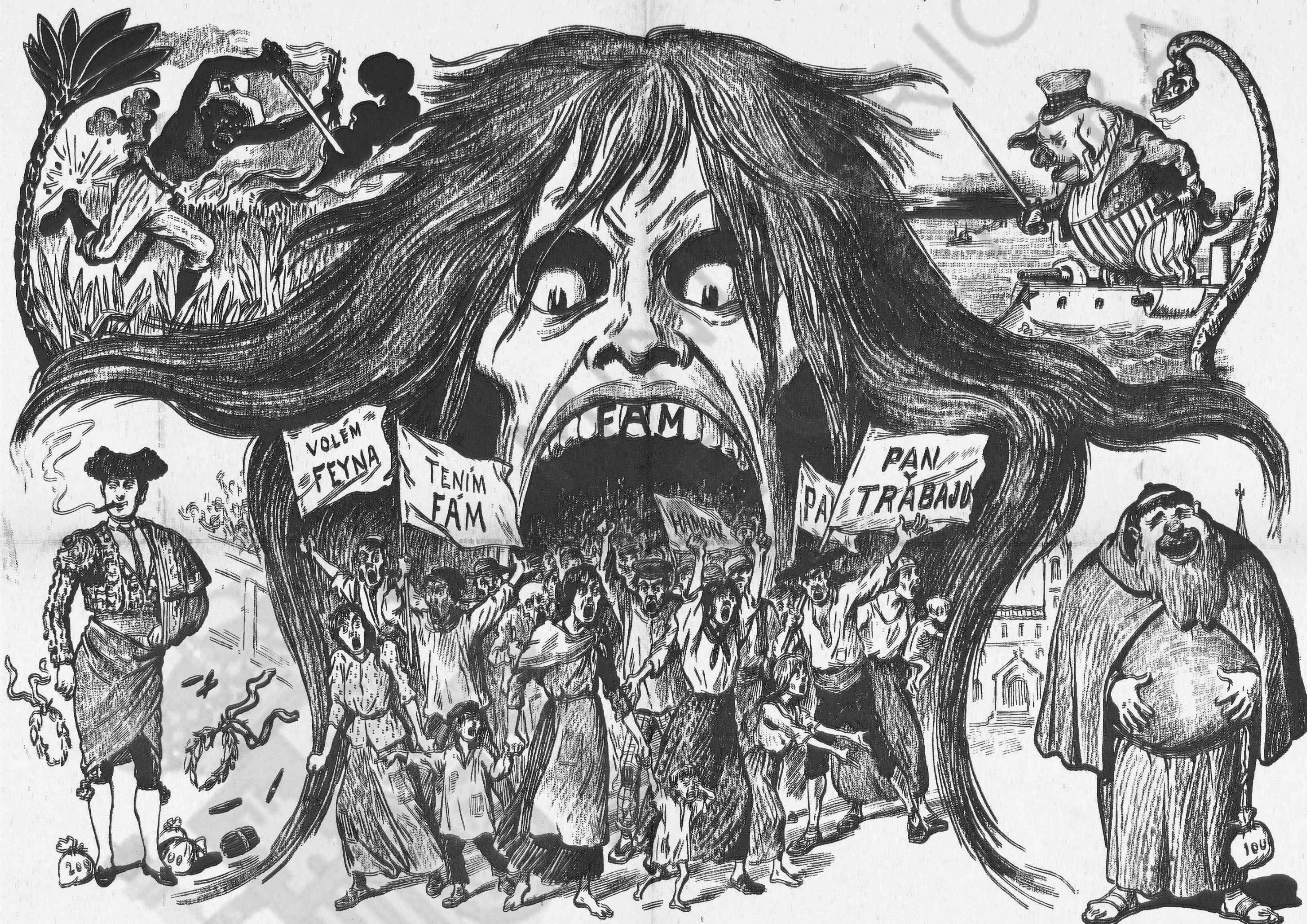
La Espanya, als 24 anys de restauració monárquica

Es veritat: no renyeixen dos quan un no vol; Pero moltas vegadas al que no vol renyir li prenen la catxutxa.