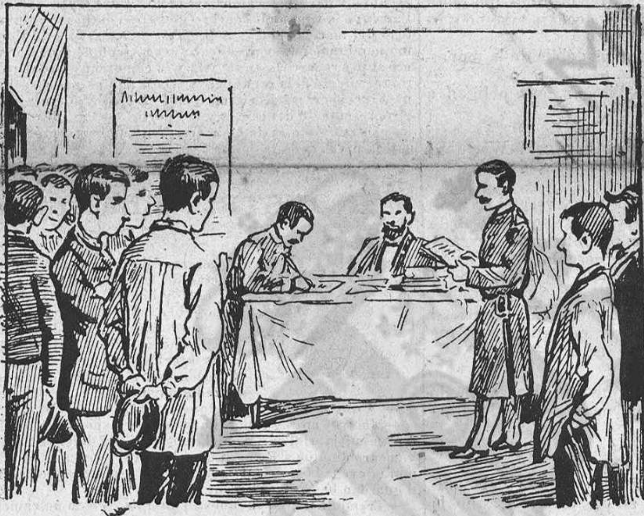
La del govern.