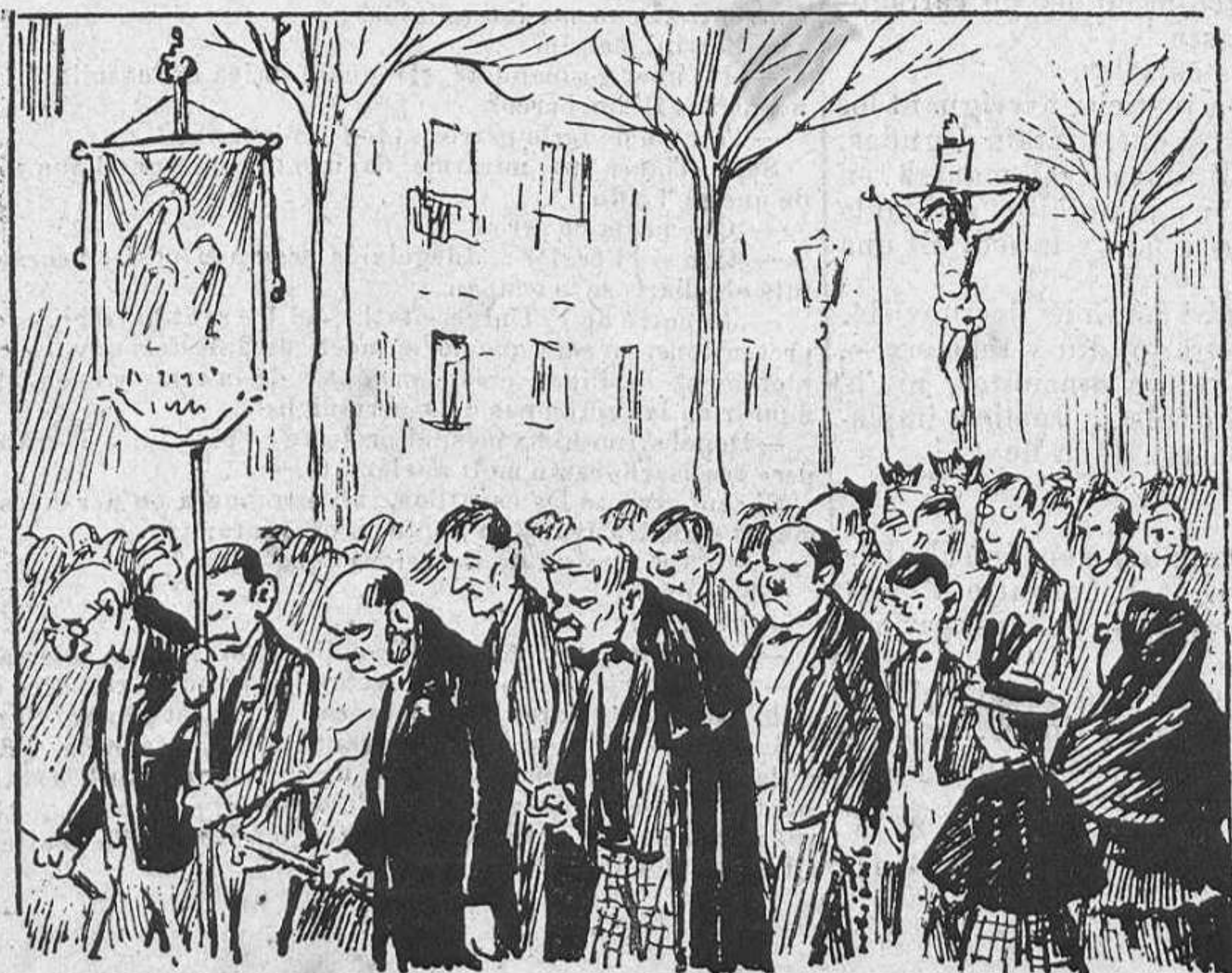
La de la llana.