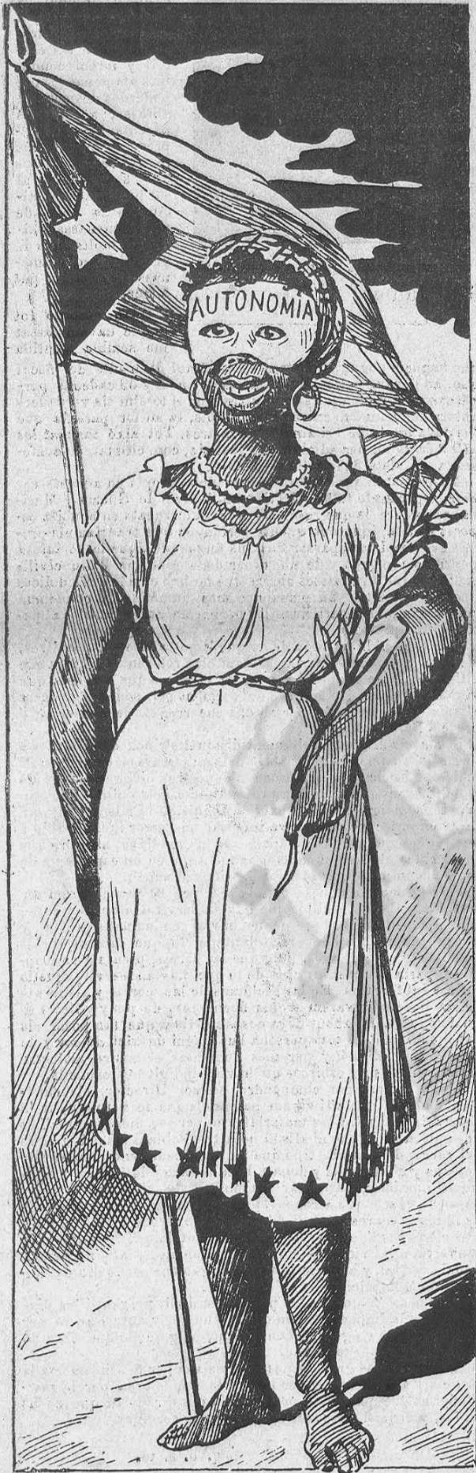
Encare que va disfressada d' Autonomia, 's diu Independència.

—¡Ay, fill! ¿Qué 's figura que desde aquí dalt no 's observa tot? Agafi la verdadera doctrina cristiana; interrogi als cristians que més cridan, y si n' hi ha un, jun sol que pugui alabar-se ab justicia de seguirla al peu de la lletra, tiro la corona de sant al foch y 'm retiro definitivamente á la gloria privada. —Aixó vol dir donchs... —Que trobo inconvenient que se 'm coluqui de patró en un establiment d' ensenyansa, com trobaria també un disbarat que s' oferis la presidencia d' un quartel al papa ó 'l patronat d' una catedral á n' Martínez Campos. —Calculi vosté que las corrents actuals son aquestas; que la religió ben enbarnissada dóna molt to y que 'l etiqueta que avuy avalora tots els productes es la del més refinat catolicisme. —¡Per xó aném tan bé!—exclamá Sant Tomás ab accent de profunda convicció:—d' aquesta grotesca barreja de pietat y cálculo n' arrenca una bona part de las desdixas presents. —¿Segons aixó, lo patronat de la Universitat barcelonina no es fácil que 'l accepti? —No 'l acceptaré ni 'l refusaré: per una orel·la m' entraré y per l' altra m' sortiré... lo mateix que si 'm diguessin Llucia. Y á modo de conclusió, 'l sant va anyadir: —A las iglesias 's ha de resar, á las ferrerías 's ha de forjar, á las tintorerías 's ha de teñir, á las universidades 's ha de enseñar. Lo méu lema en aquestos assumptos, es molt breu: Zapatero á tus zapatos. Ja ho saben los negociadors del patronat: Sant Tomás, el mateix Sant Tomás, els tracta de sabaters .