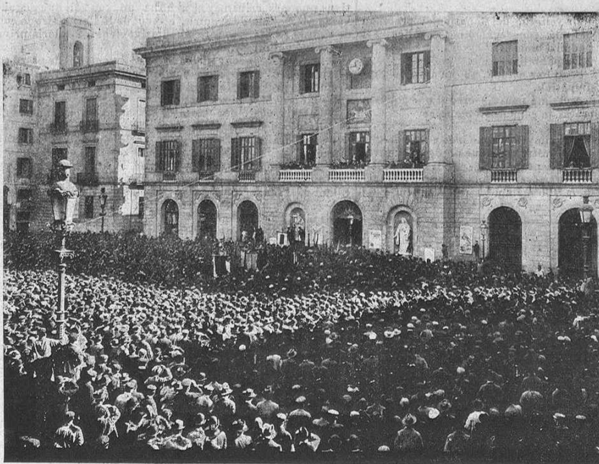
La manifestació á la Plassa de Sant Jaume