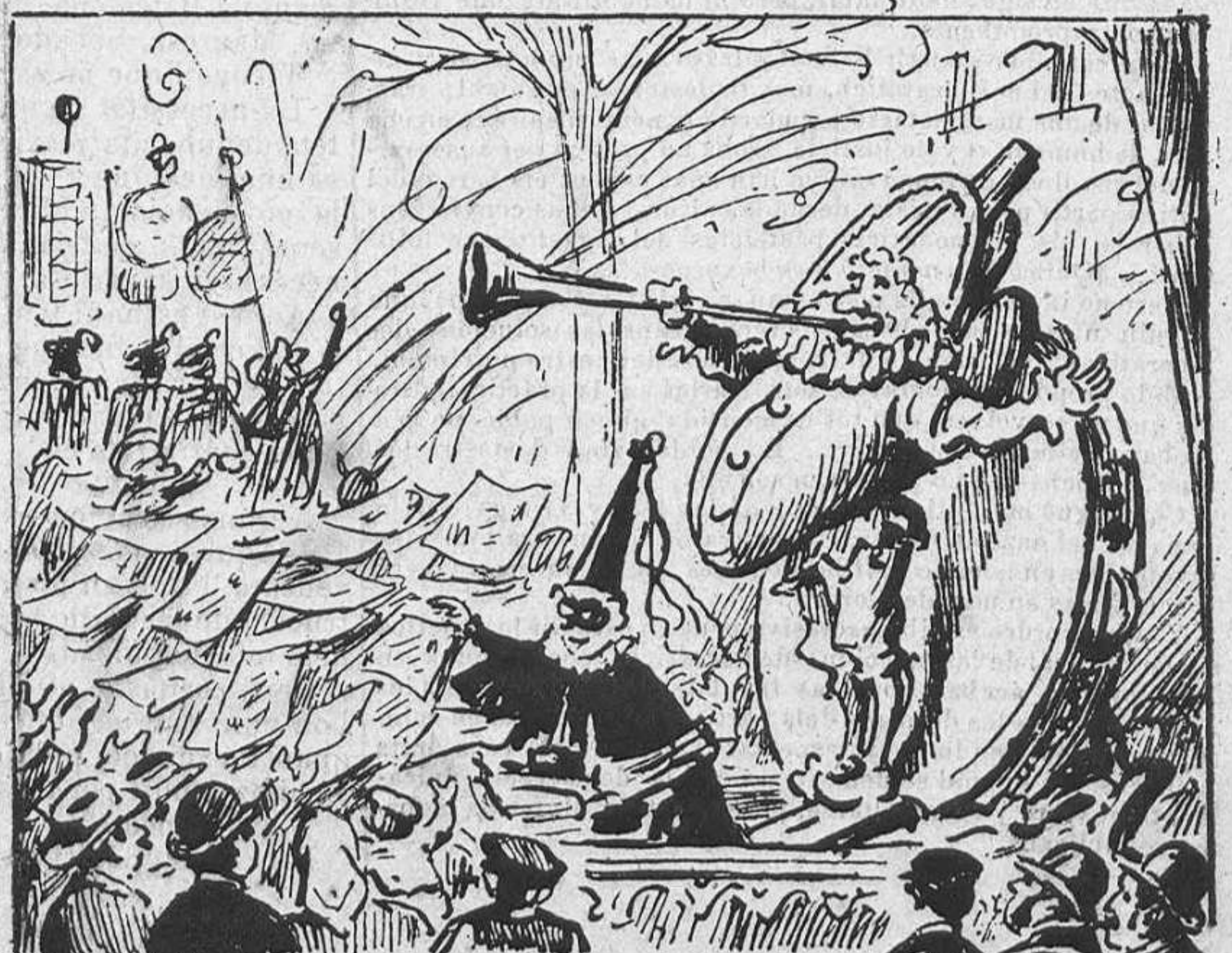
La de la gresca.