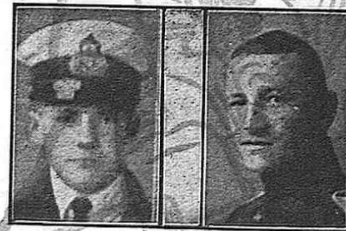
Ewin Kern i Hermann Fischer, assassins de Walther Rathenau

Quan sapiguérem la trista nova de l'atemptat del que fou víctima el gran home públic alemany Rathenau, ens imaginàrem desseguida terribles complots organitzats per ferèstes militars, no menys terribles, amb grossos bigotis, llargues barbes, mirada extraviada i gest ferreny. Però no, la nostra fantasia s'ha equivocat. No són terrenys, ni tenen llargues barbes, ni grossos bigotis, ni tan sols tenen el gest malhumorat. Res, que de primer cop de vista són simpàtics.