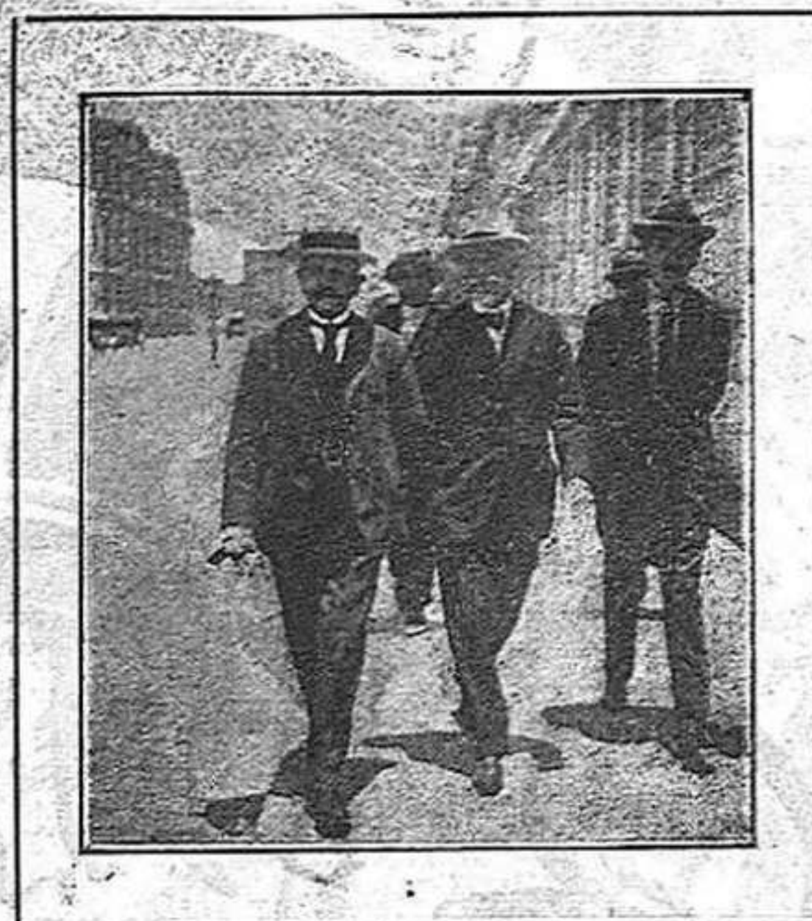
El senyor Venezelos (el del mig) passejant per un carrer de Lima

La figura del gran home públic grec és en tots