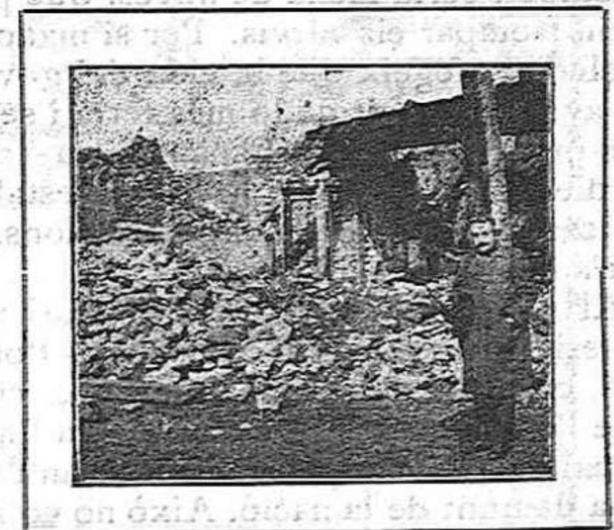
Einstein contemplant les runes de Dormans

També ha estat a Dormans, i davant les runes