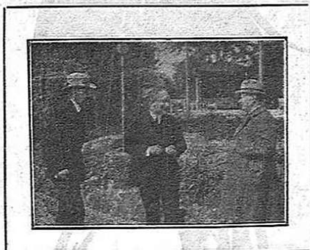
Vorovsky, Tchitcherín i Litvinof, de la Rússia soviètica

Vorovsky, Tchitcherín, Litvinof, etc., han si-