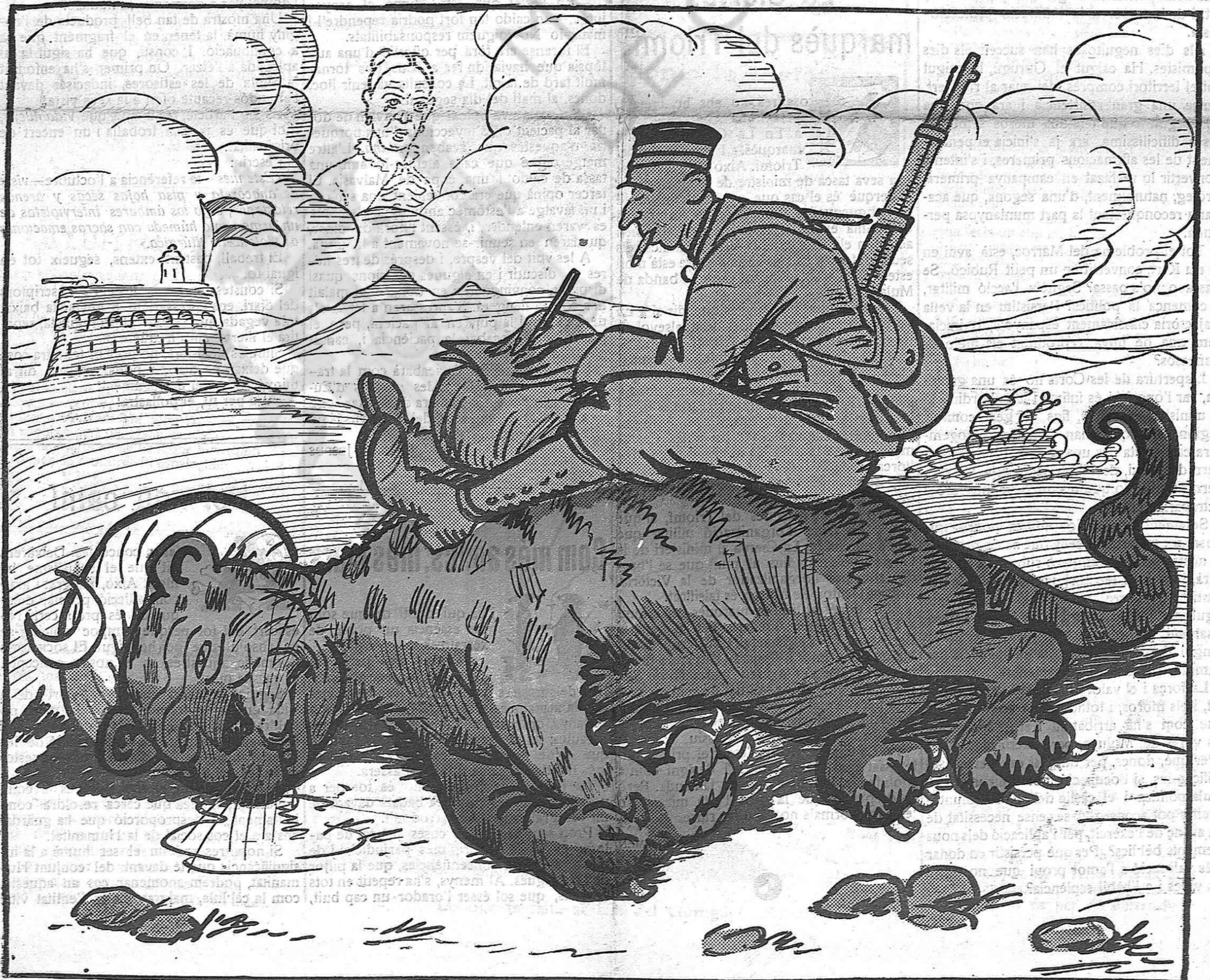
—No te'n fiis massa, fill meu, que encara li han de tallar les ungles.