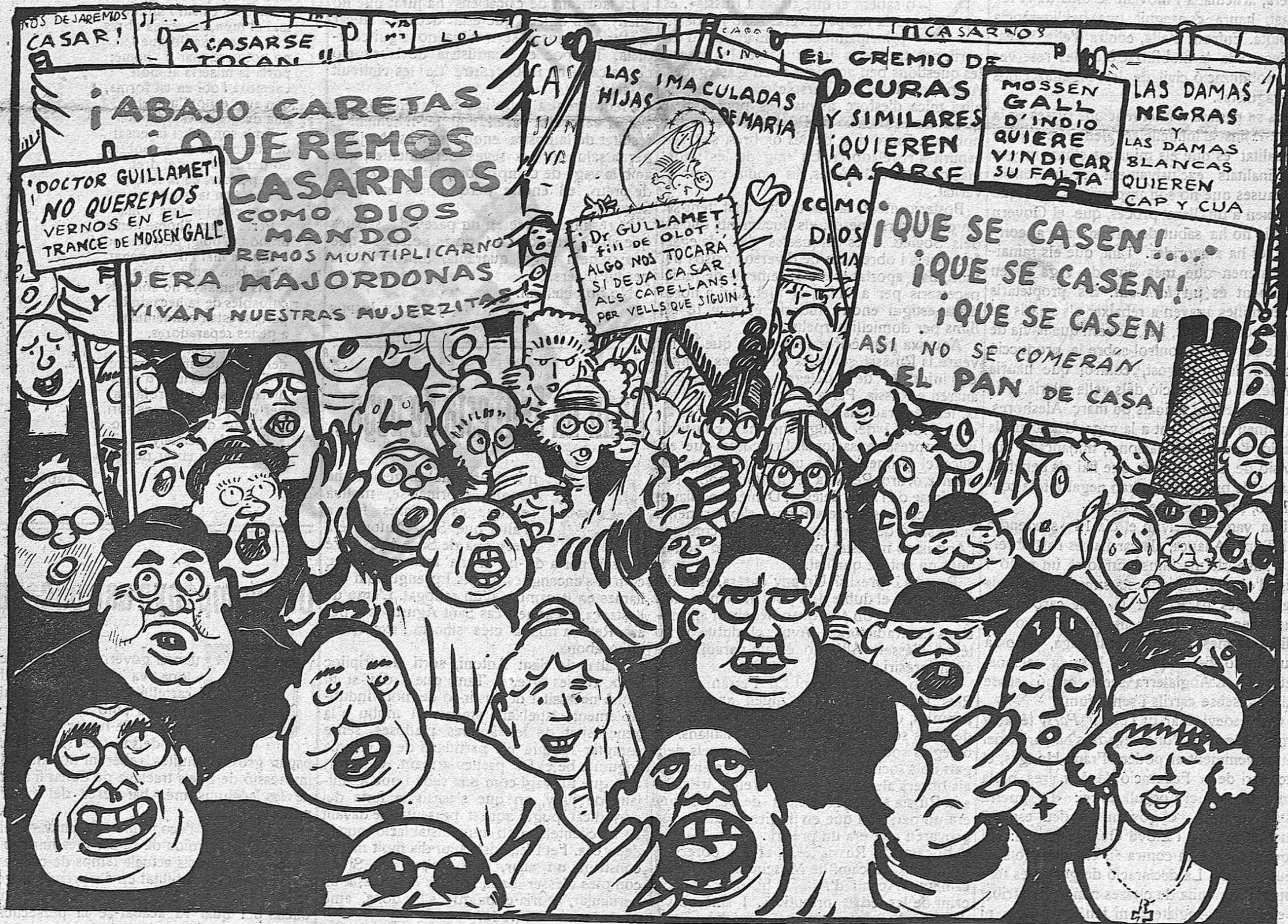
Una manifestació en pro del sant matrimoni, davant de cal Bisbe