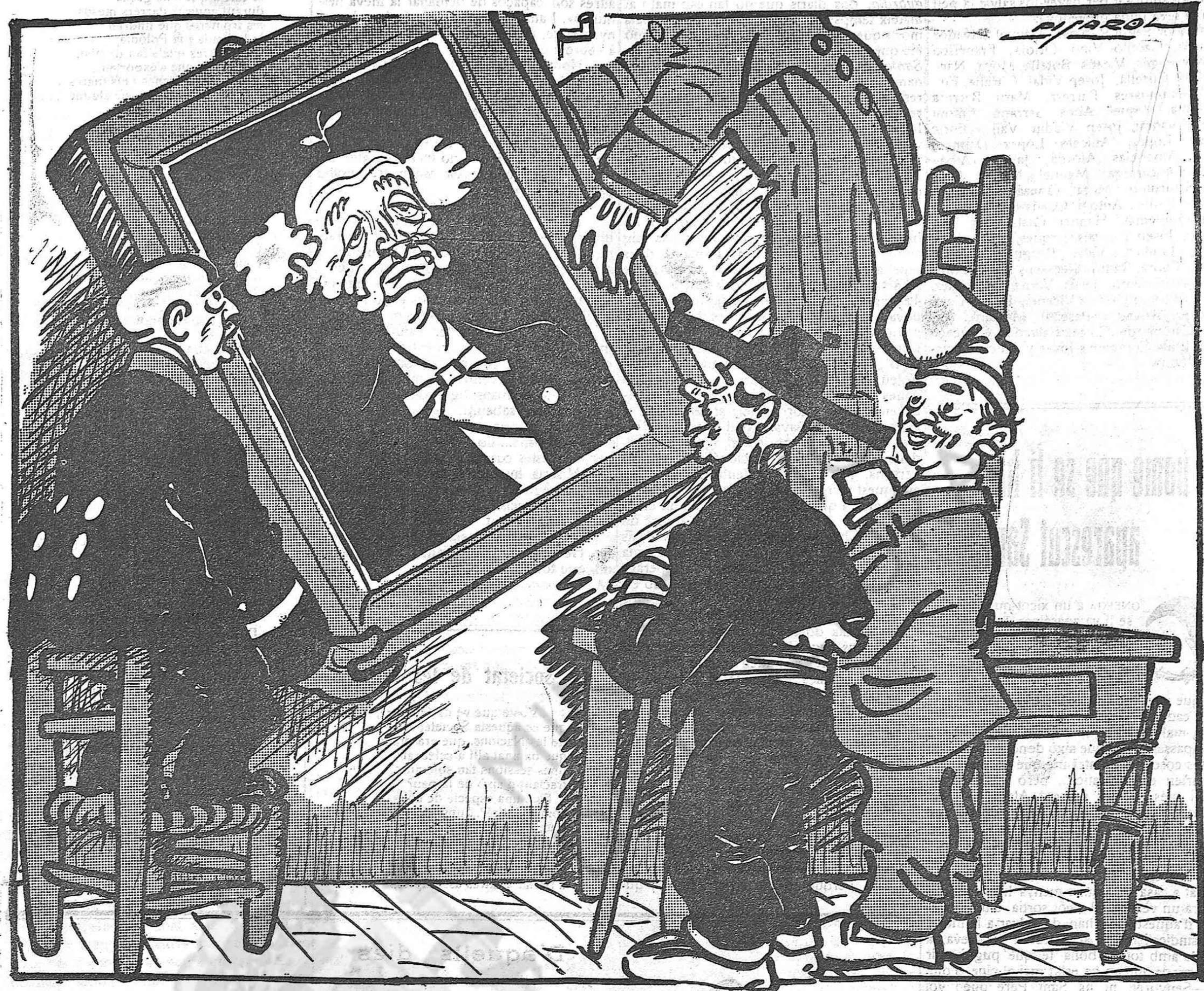
—Si guanya les eleccions, el penjarem a la Galeria, i si les perd, el posarem de cara a la paret.