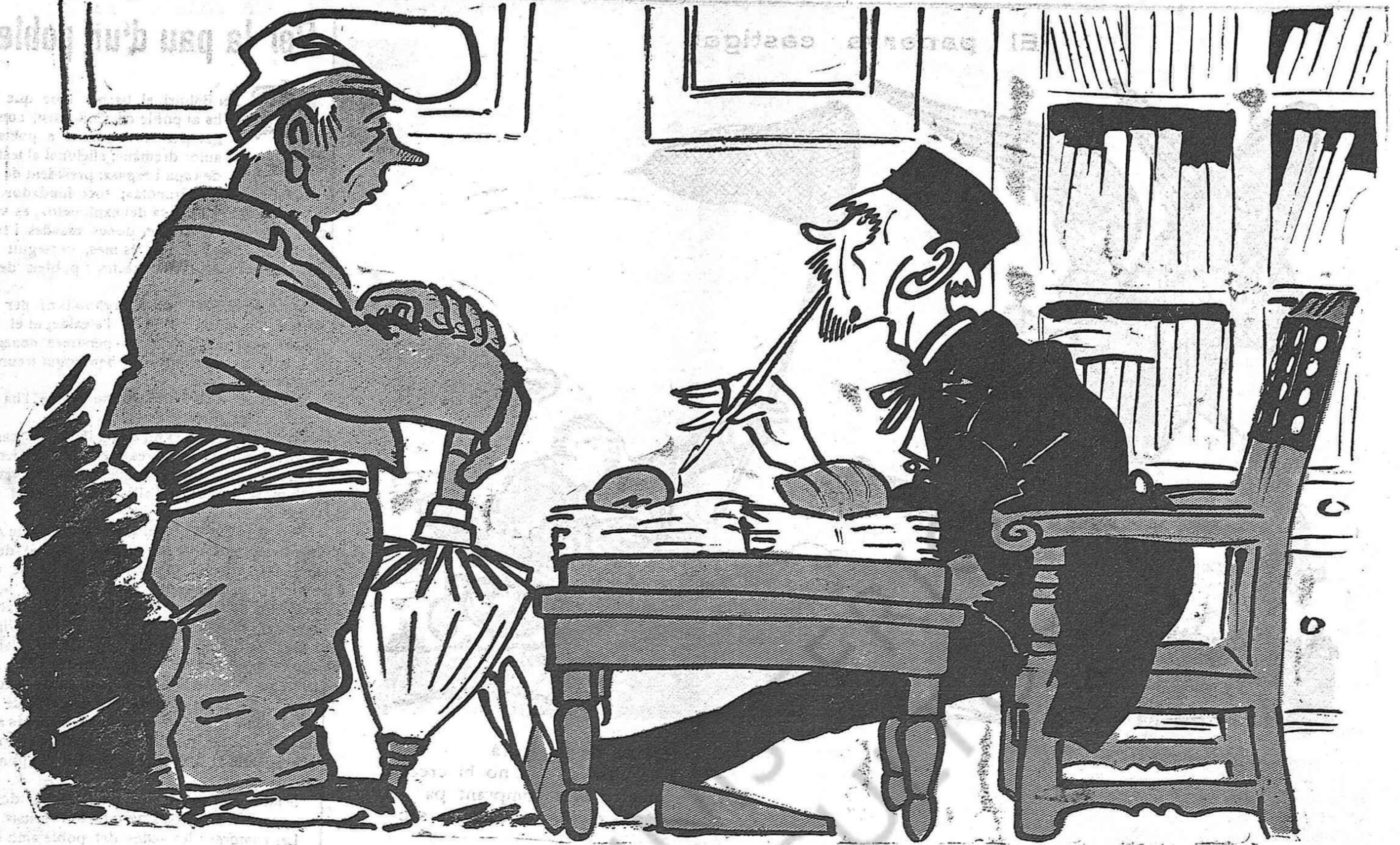
ESCENES RURALS—A CAL NOTARI