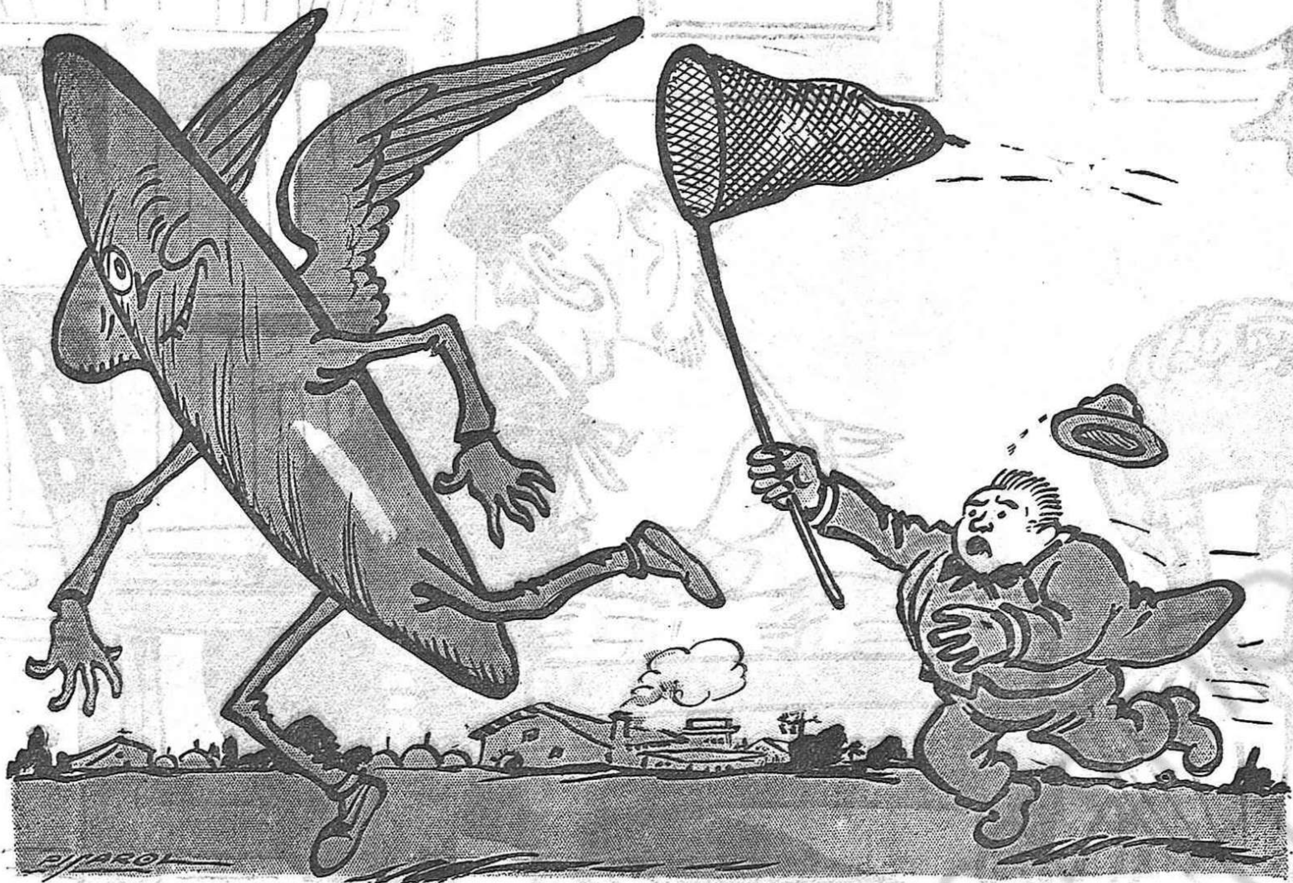
—Això de l'acaparar és cosa que ja no hi crec: quatre dies comprant pa i ara el tinc de menjar sèc