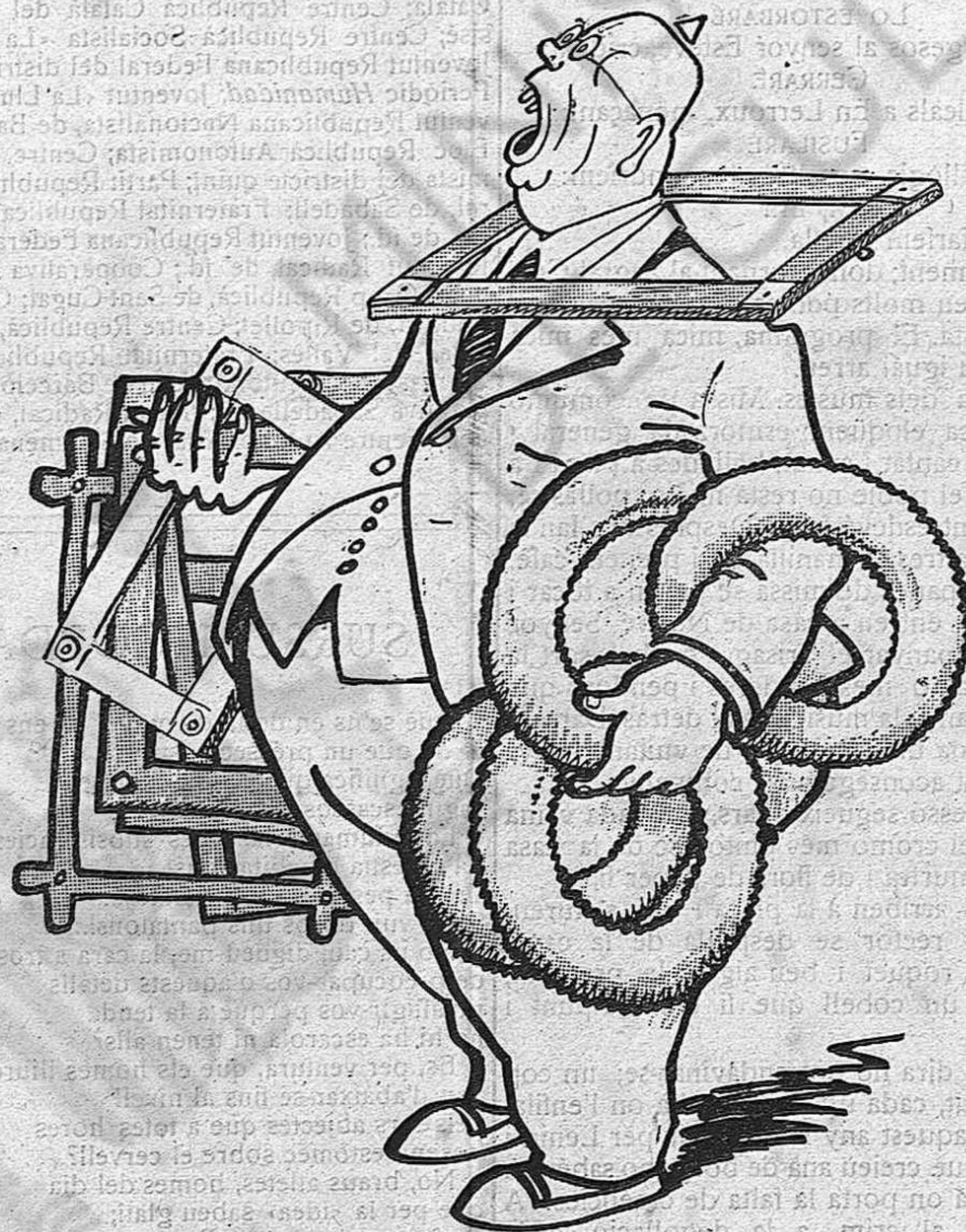
— A rall... a ral marks!... (I aviat a cap diner)