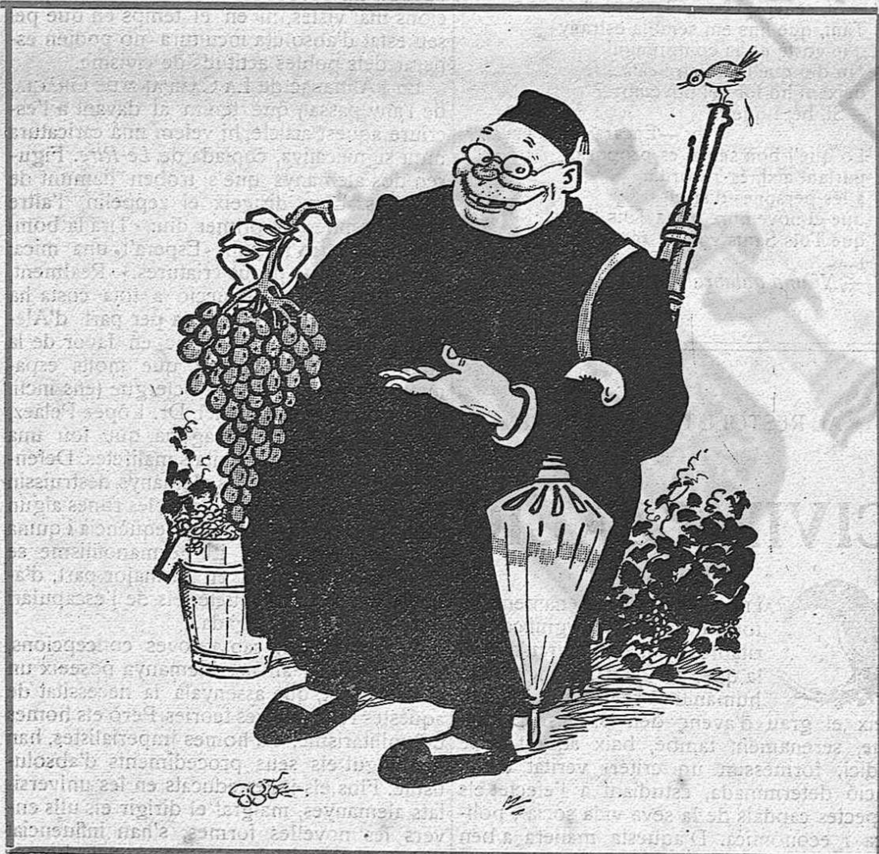
—Encara!... Encara podem fer vi suficient per a dir unes quantes misses!...

dorosa. Els seus fonaments seran uns altres i l'edifici de la seva nova adaptació social se aixecarà fort.