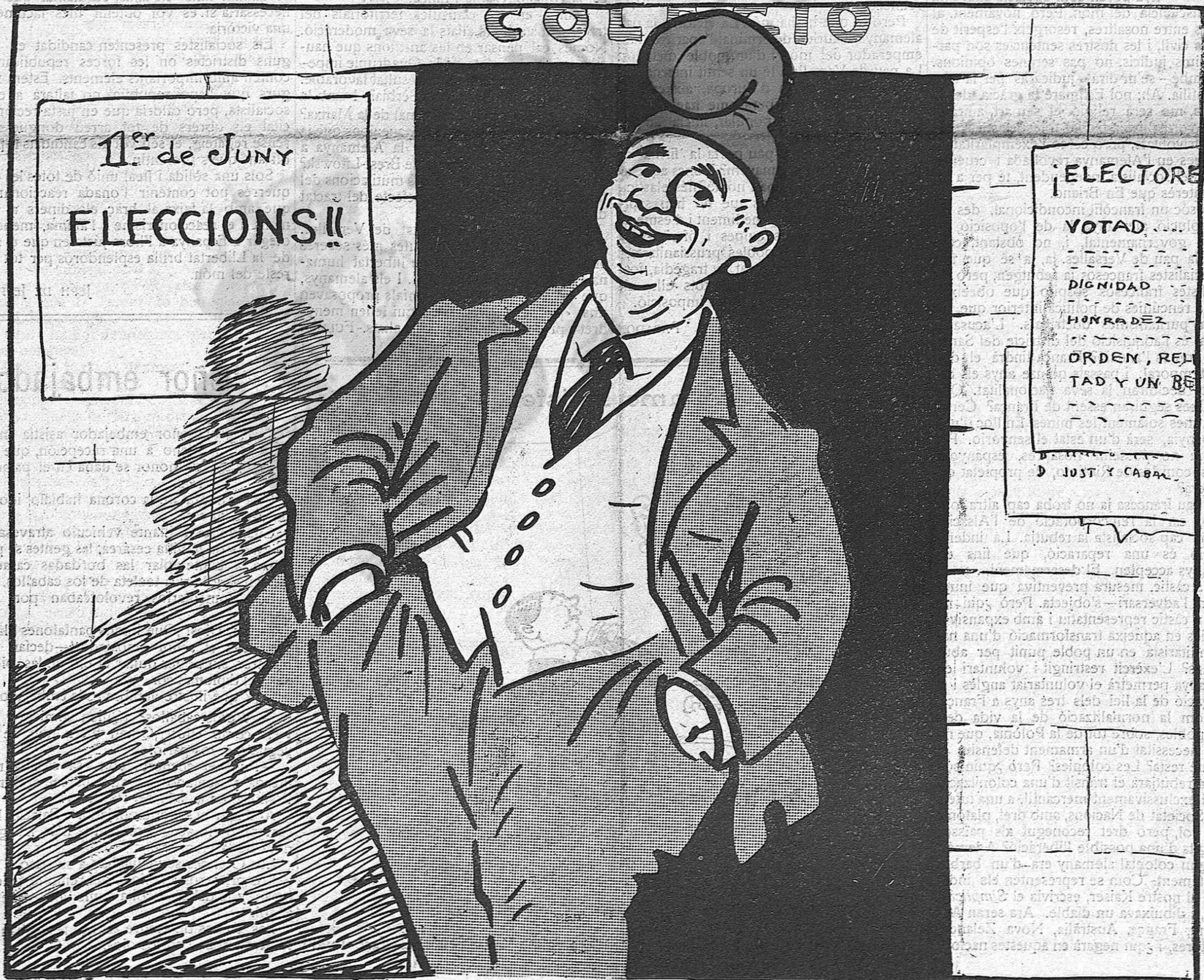
—Ah, no!... Jo, segons per qui, no'm trec les mans de la butxaca.