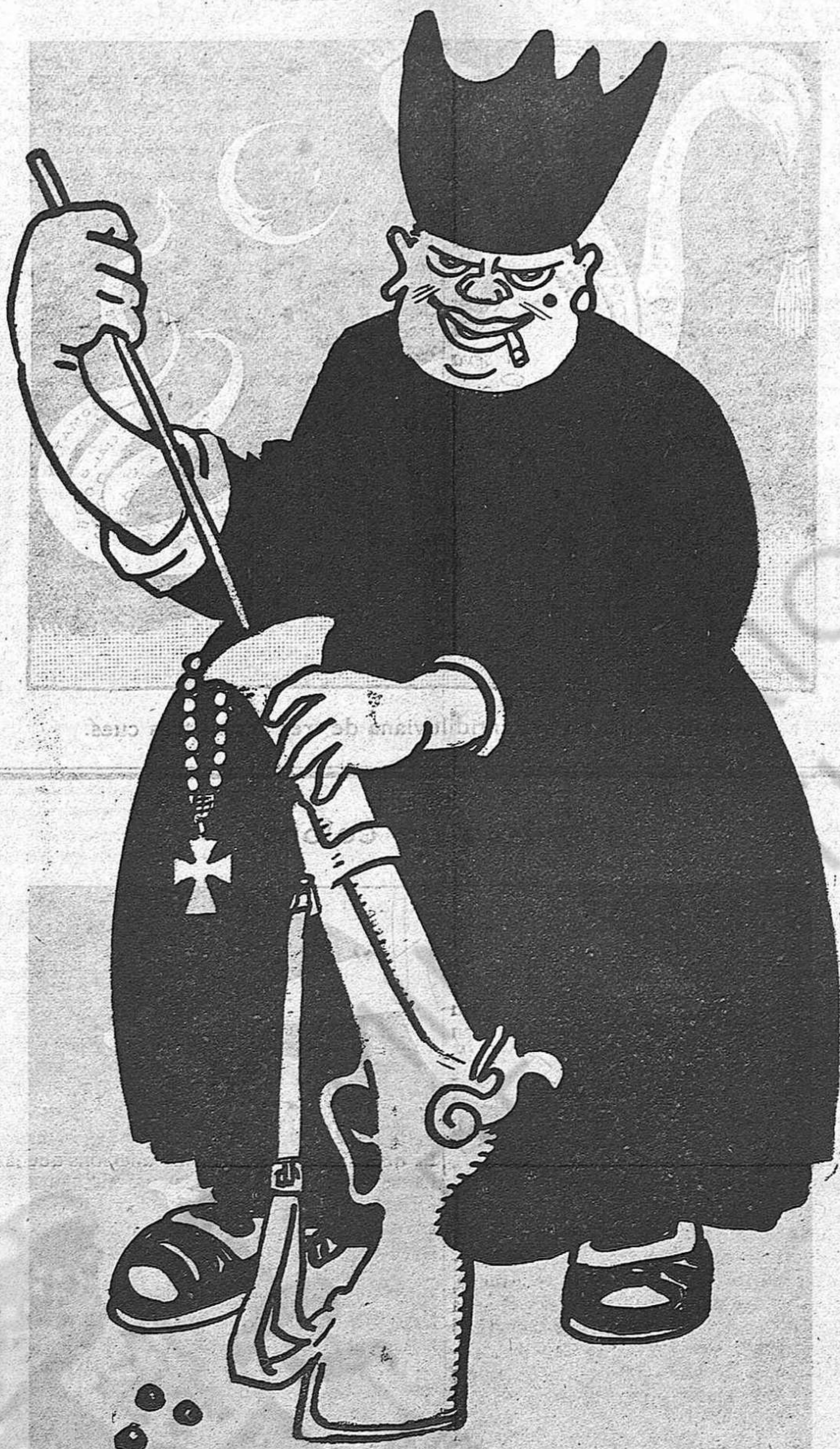
—Alabat sia el santíssim nom de Jesus!..

Aunque era viejo, aunque era feo, aunque era plebeyo, se le hacía acatamiento, porque representaba a un Estado guerrero y a un gobierno vencedor.