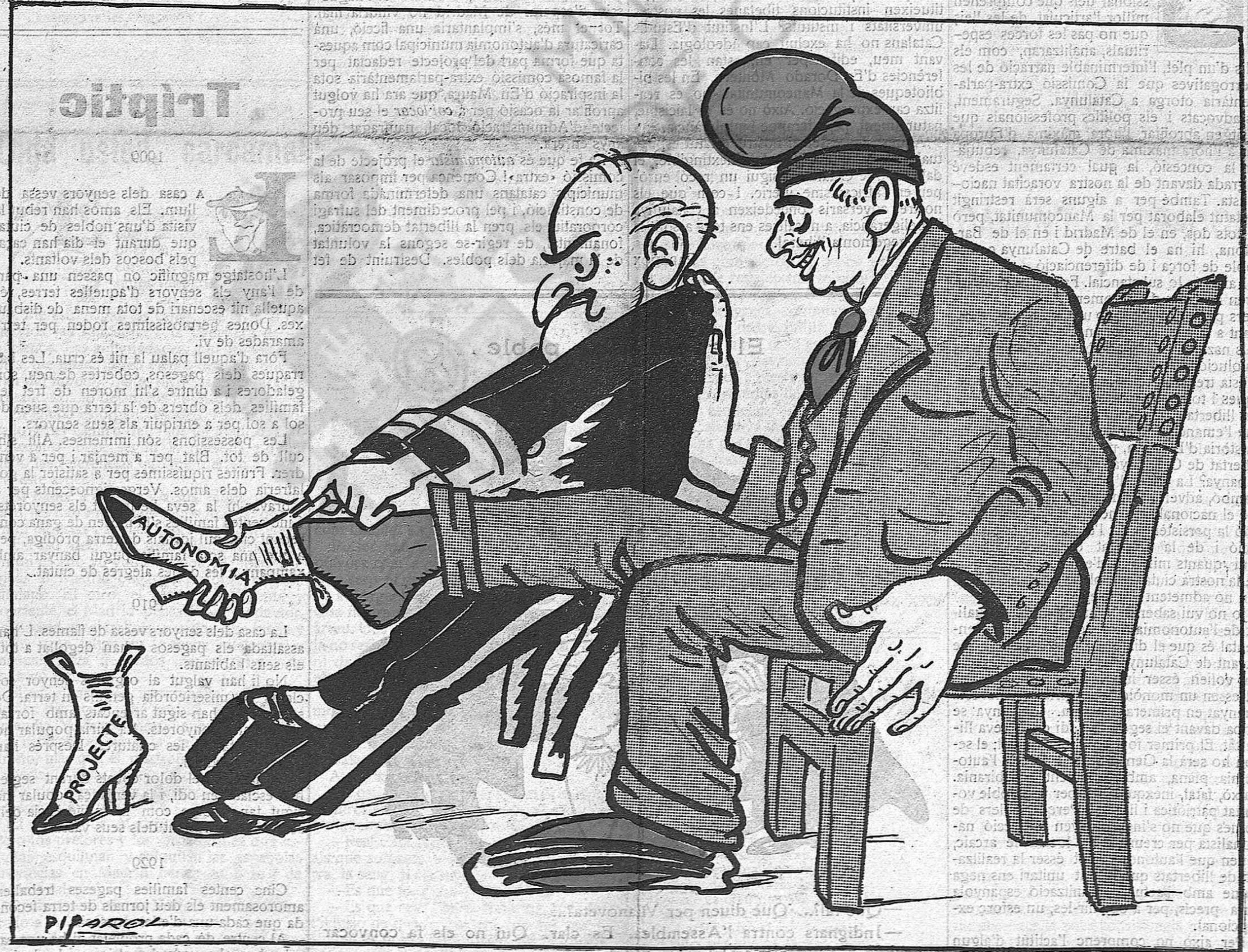
—No's cansí, no... Si de una hora lluny se veu que'm són estretes!...