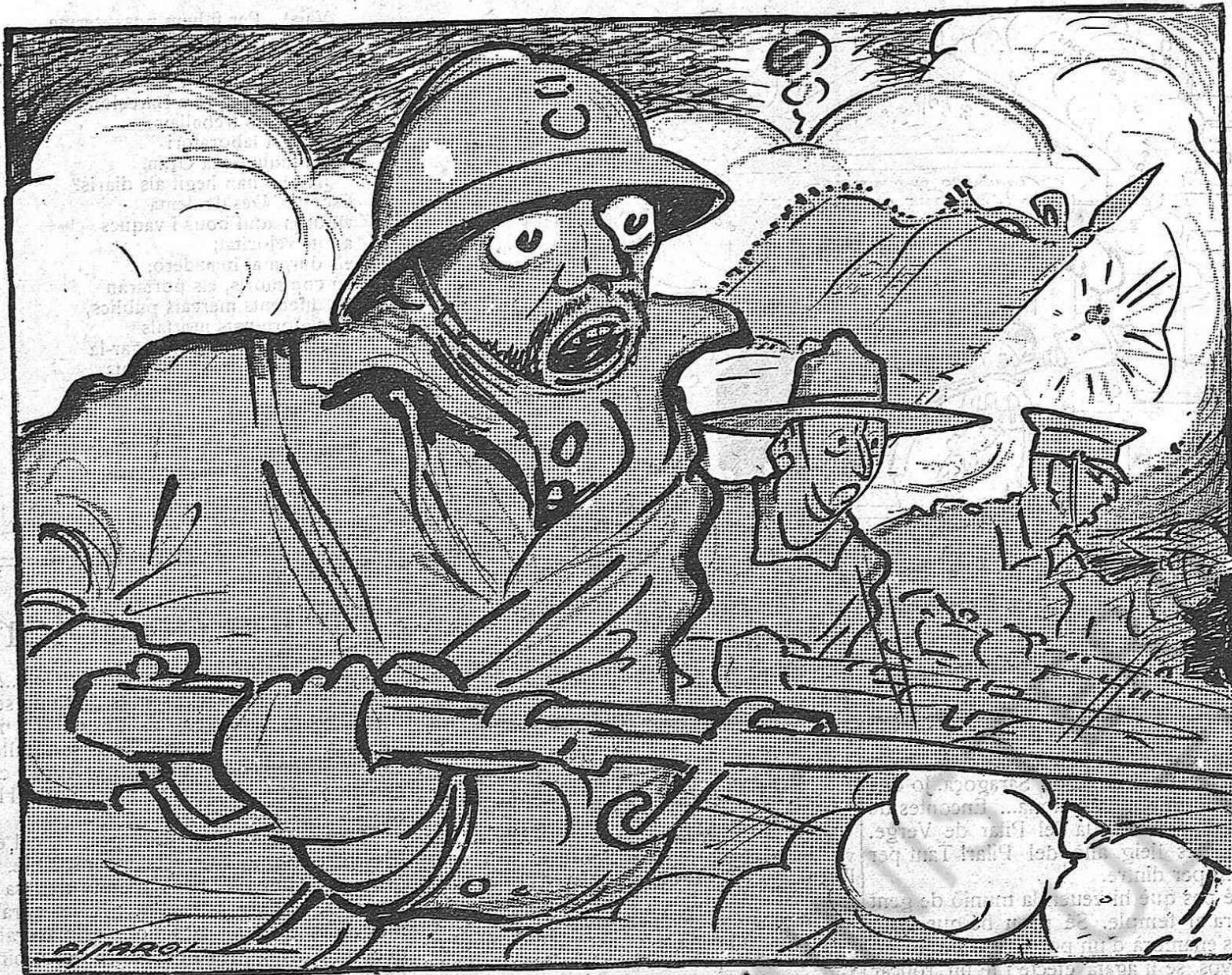
—Ara prou!... I ençera fins a casa vostra!...