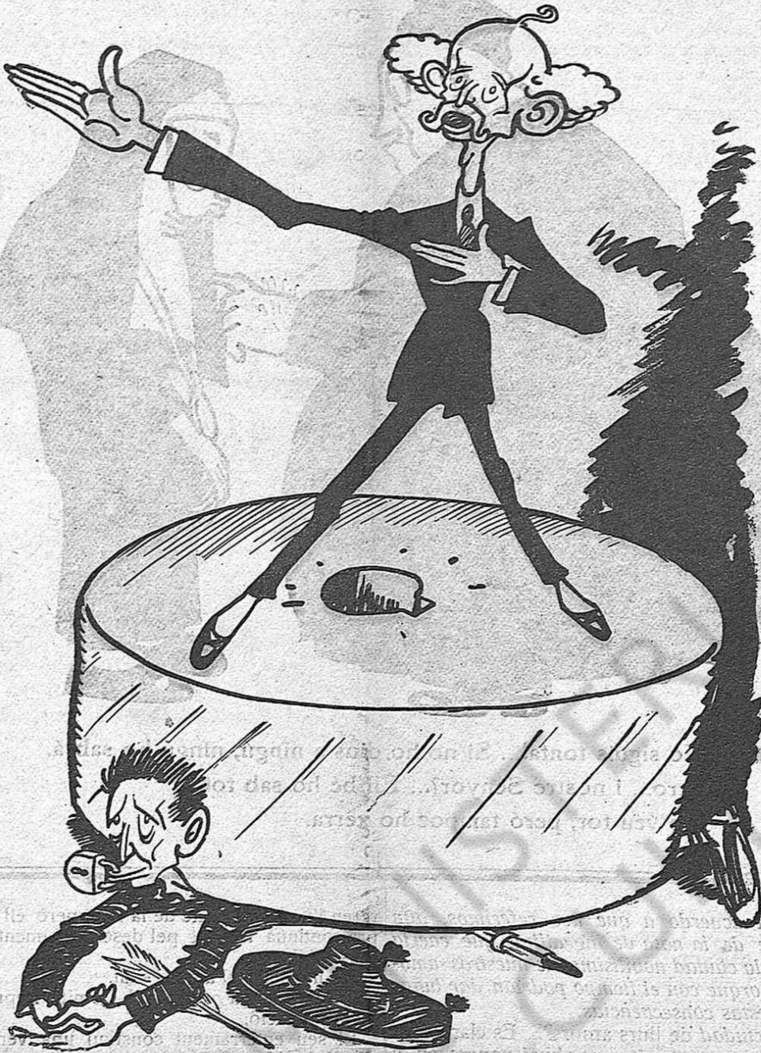
— Llibertat? .. Encara voleu més llibertat de la que disfruteu?