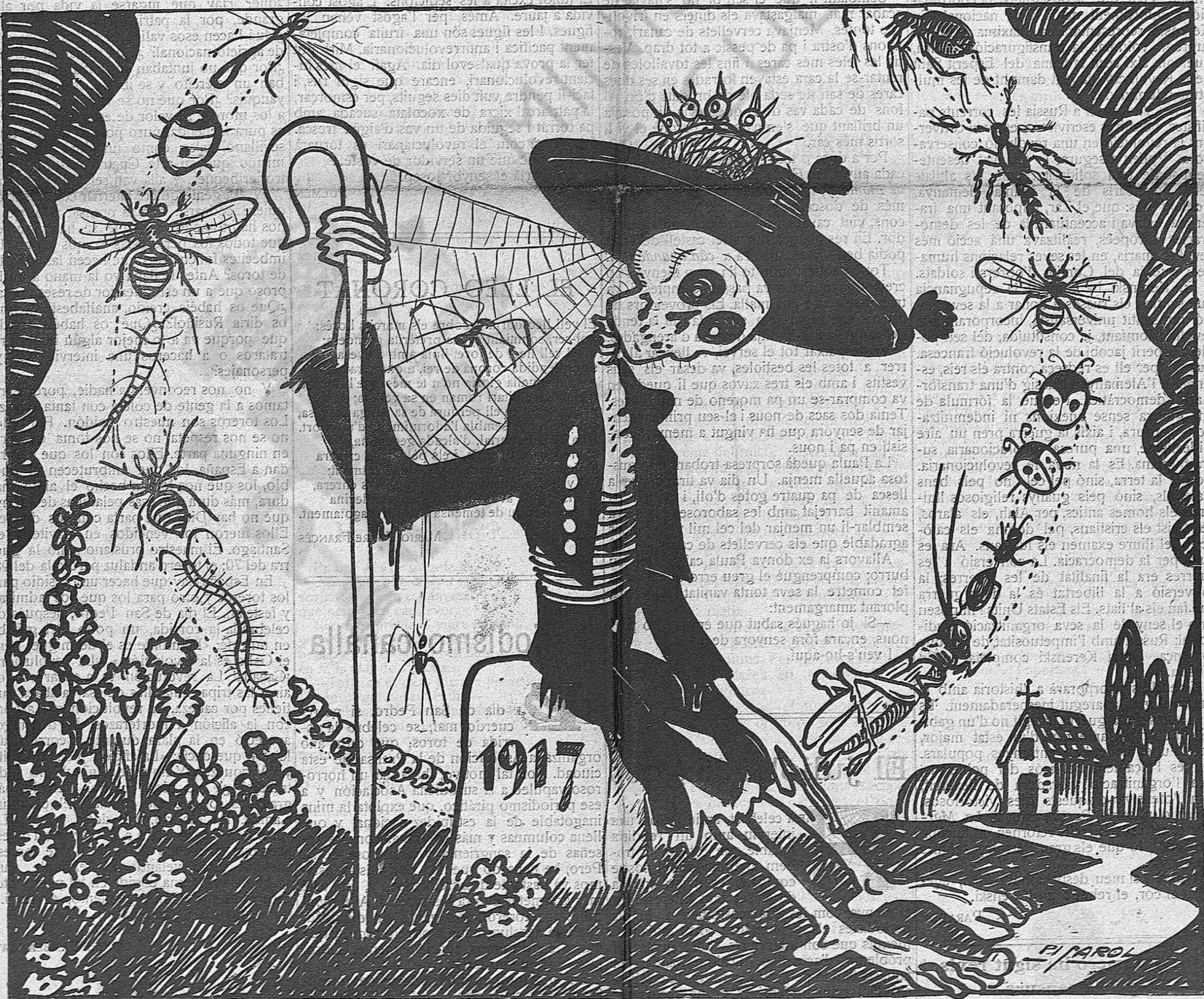
«A l'estiu, tota cuca viu»