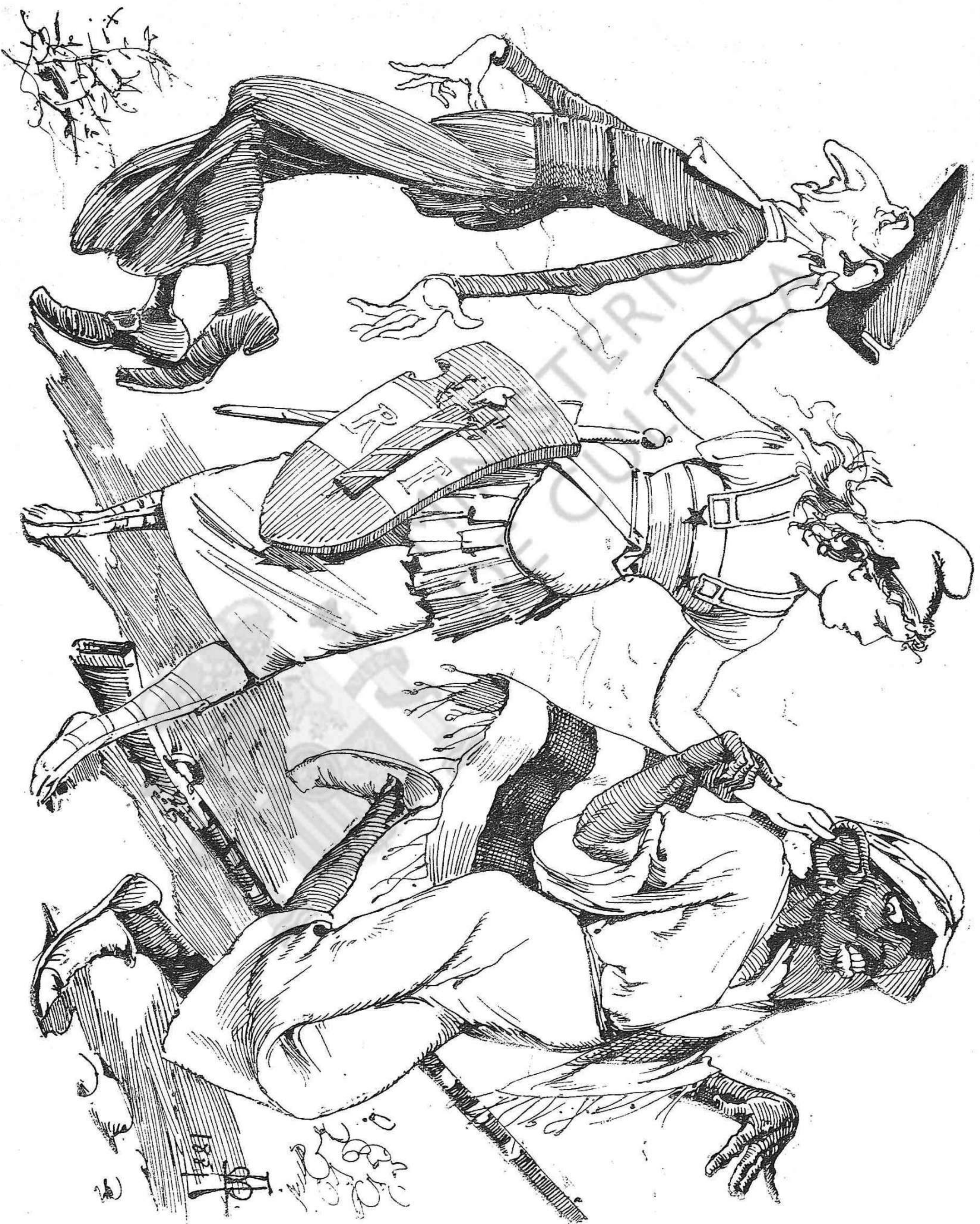
Que vaja venint gent negra: ella ray, encare s' hi diverteix.