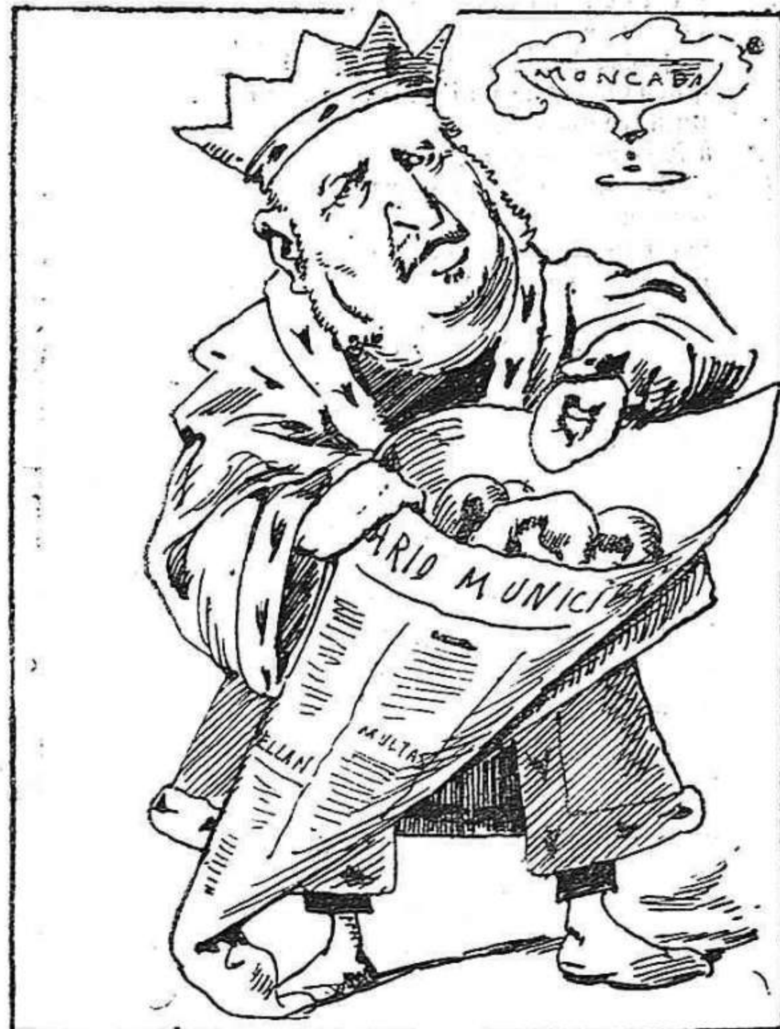
—No era mal pensat: fundar un diari per embolicar los bunyols que fassi.