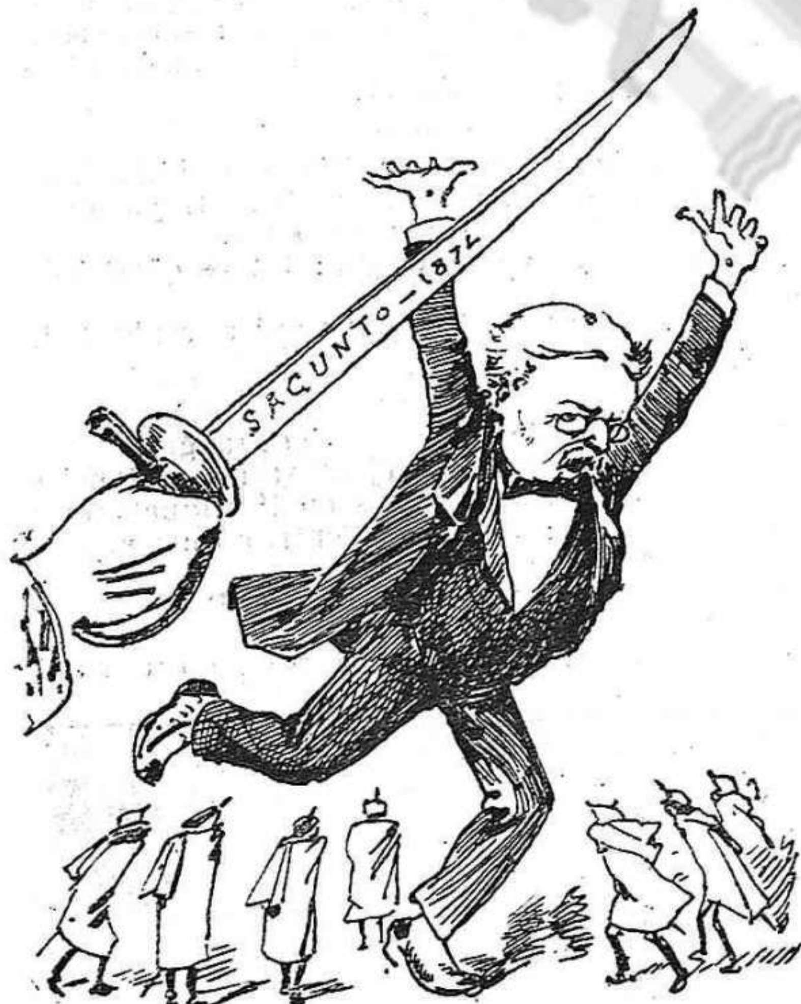
—Quien á hierro mata á hierro muere.