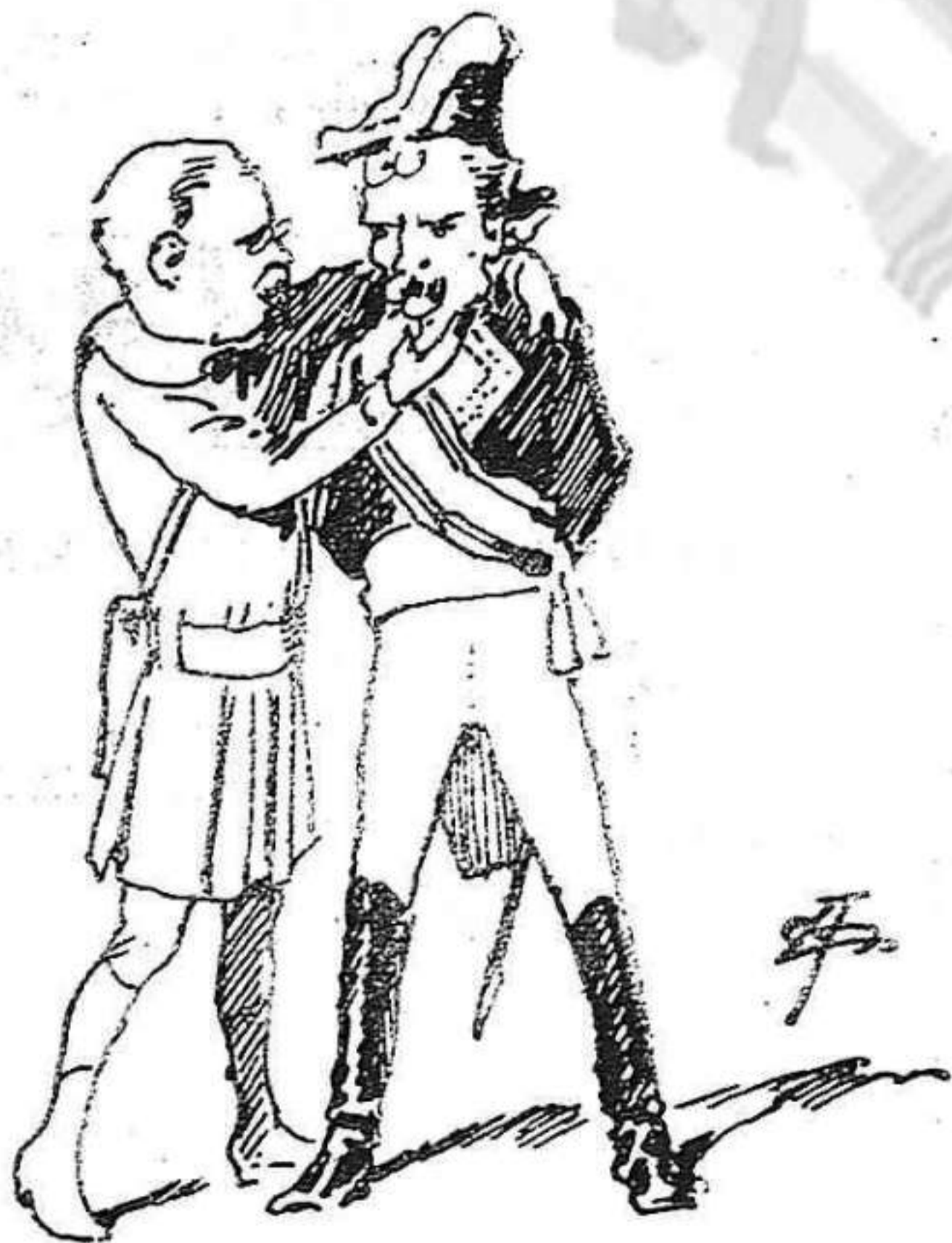
De davant molt tocarli la barbata.