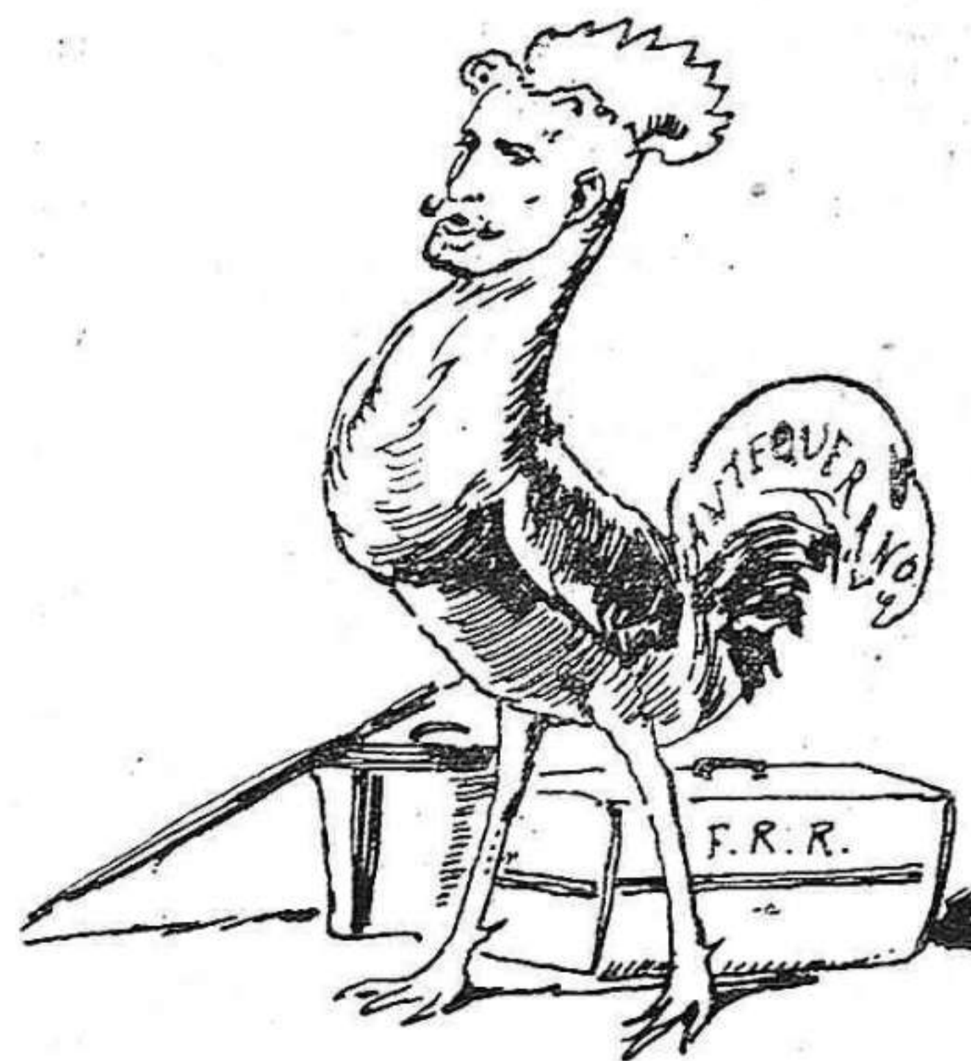
Encare que torna curat de la gargamella 'm sembla que no farà més que galls.