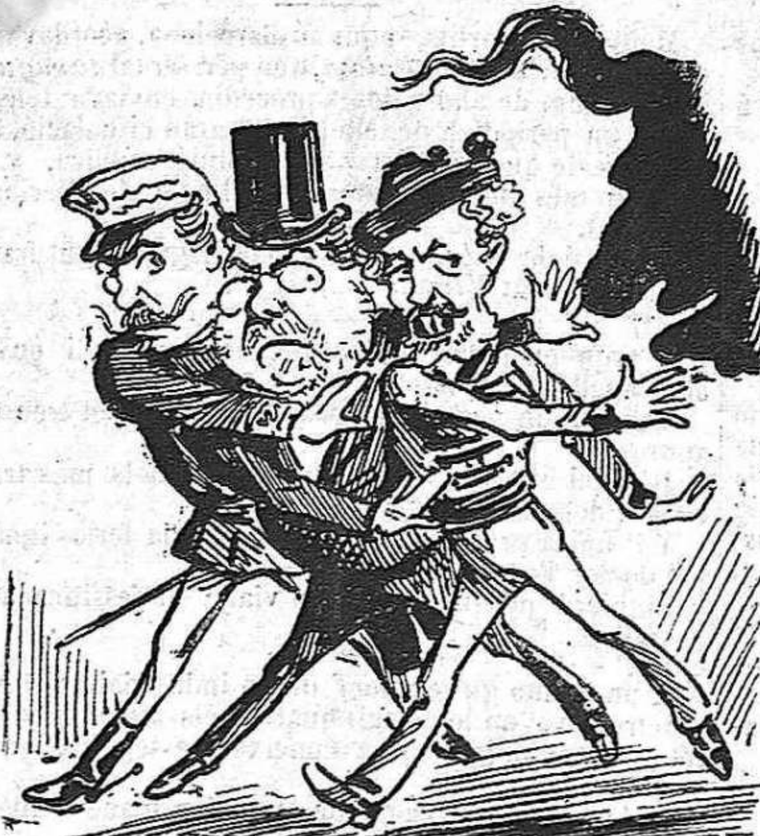
Los conjurats:—D. Práxedes, ó 'ns ho dona tot ó li direm: «¡Búsqvis pobre!»