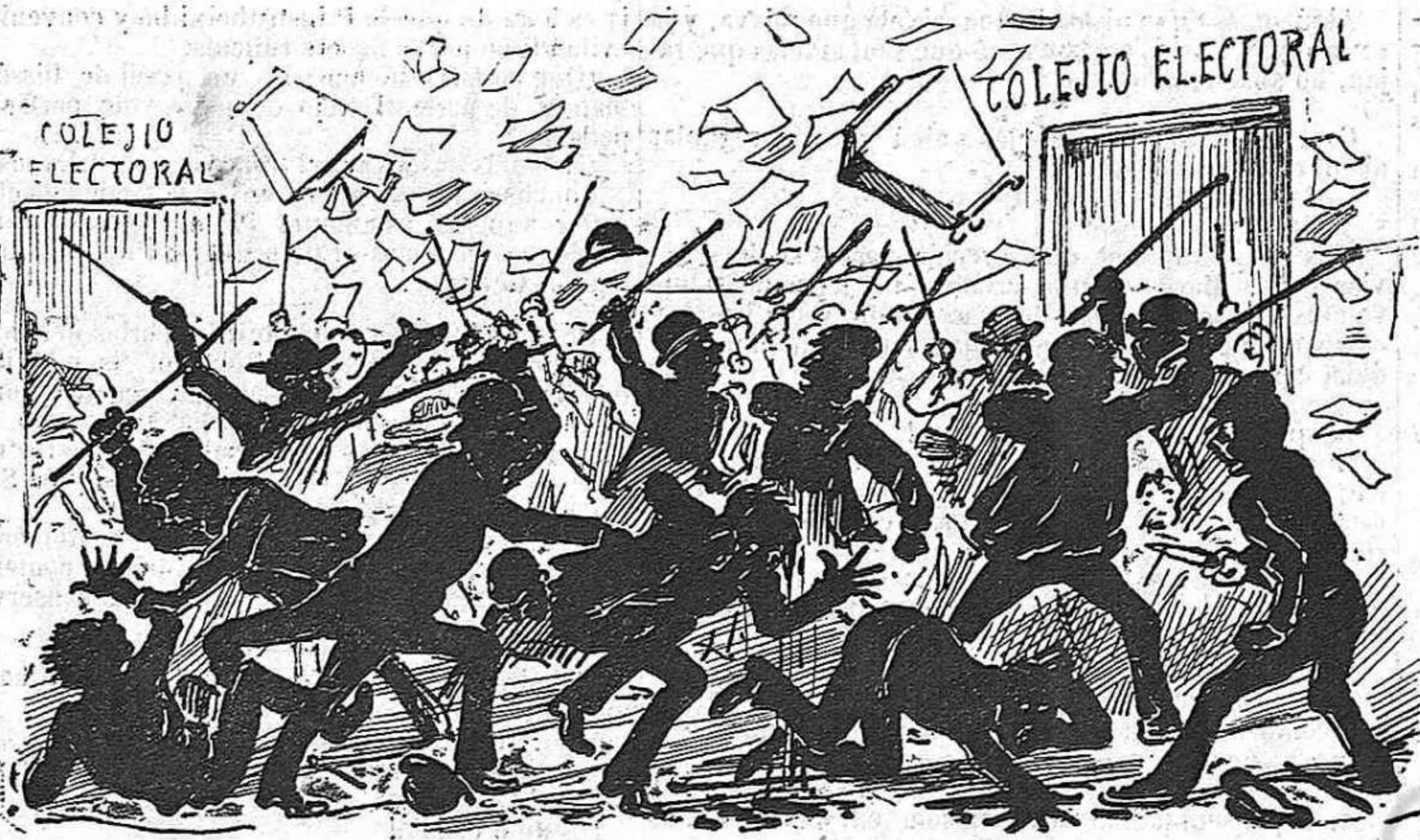
Las elecciones de Sant Andréu de Palomar van ser molt animadas.