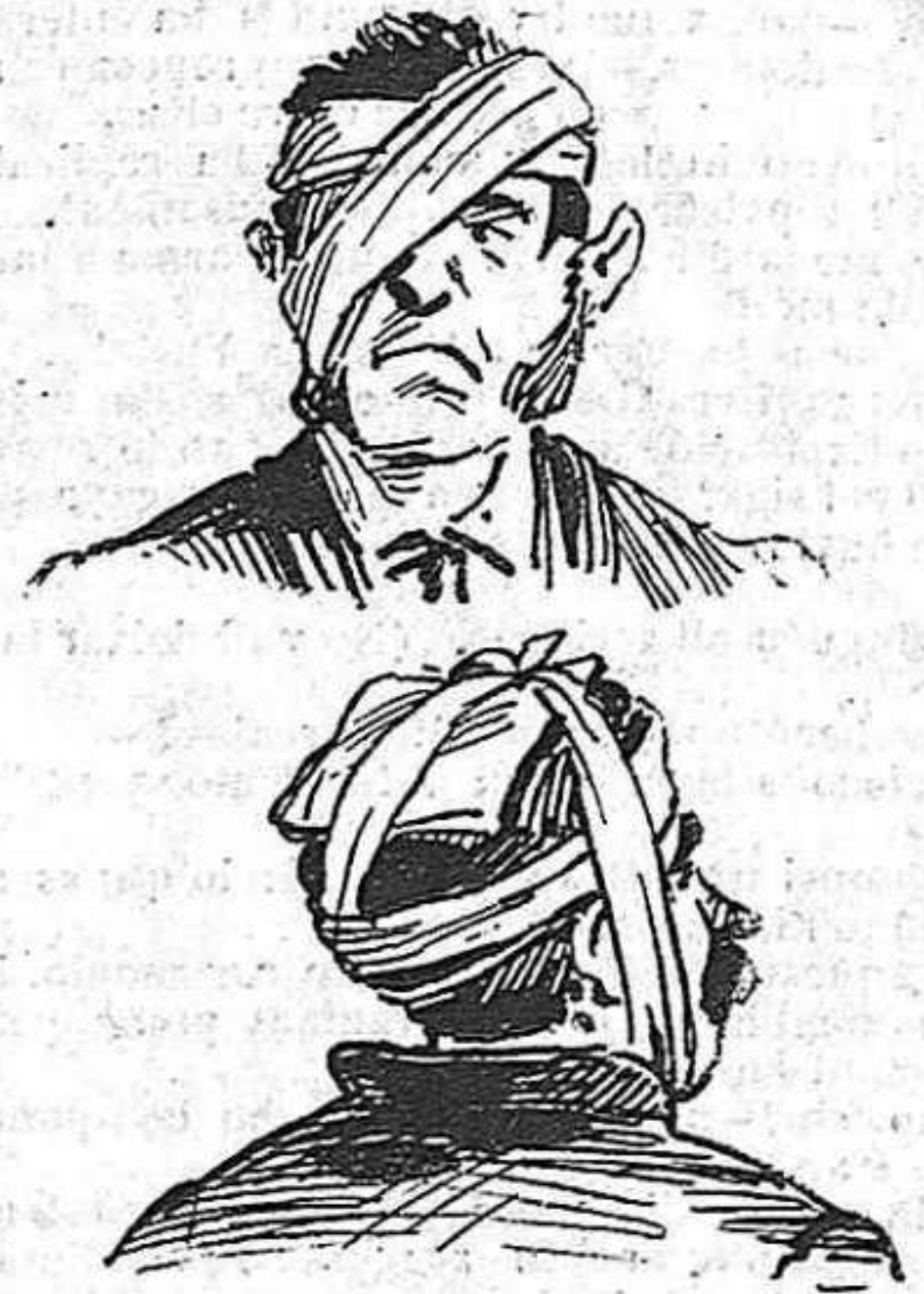
Resultat:—Sant Andréu qui troba es seu.