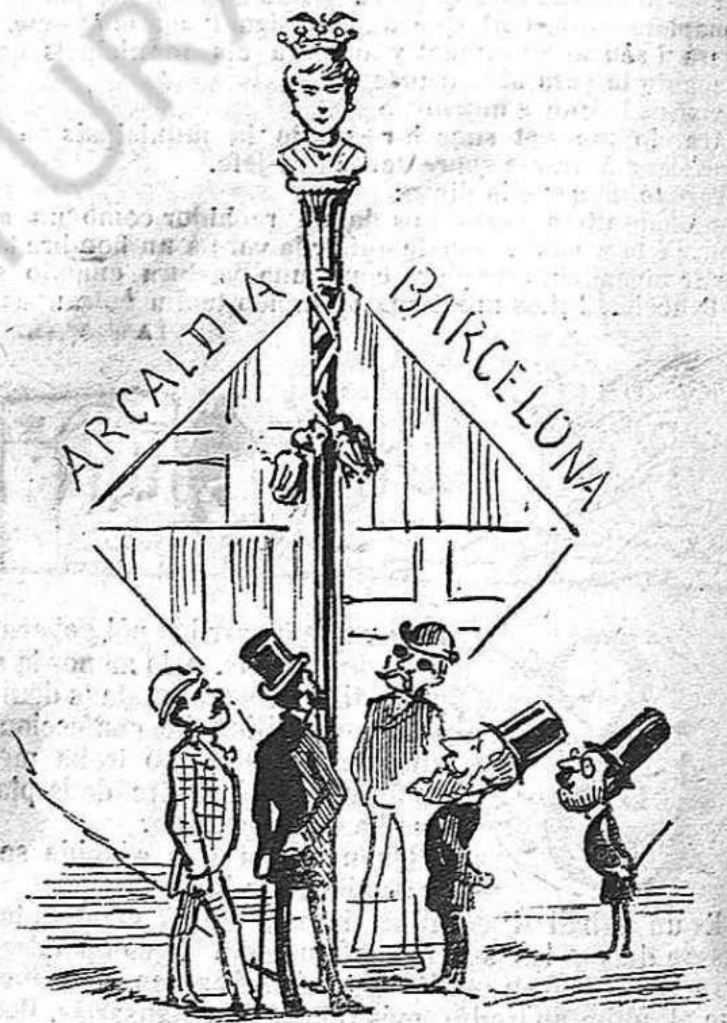
La vara:—Alsa amigo noya no 'n tens pochés que 't festejan!