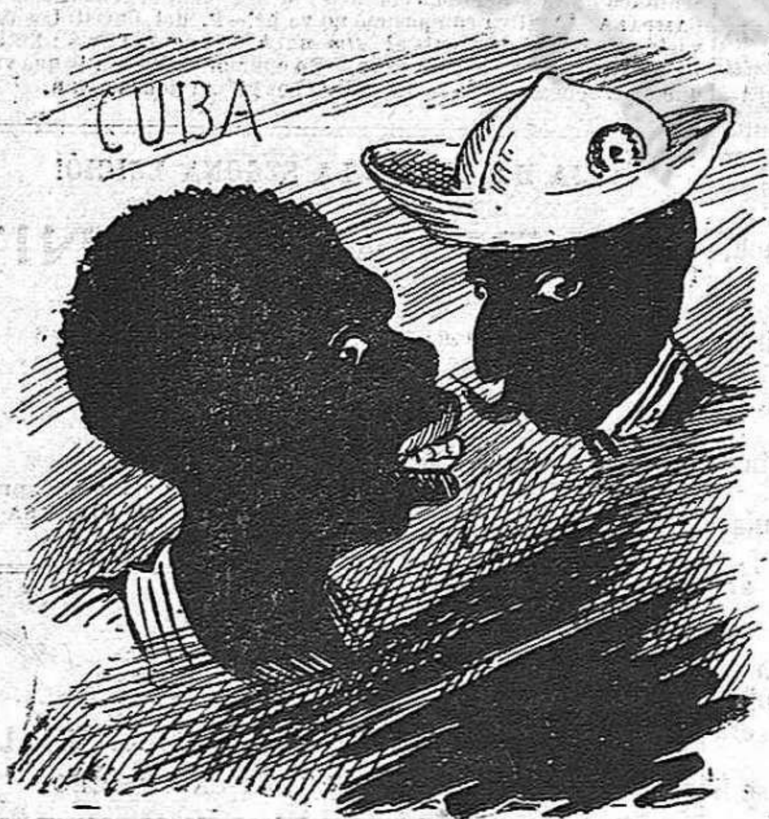
La qüestió de Cuba:—En aquella terra, ara com ara tot se torna del mateix color: tot negre.