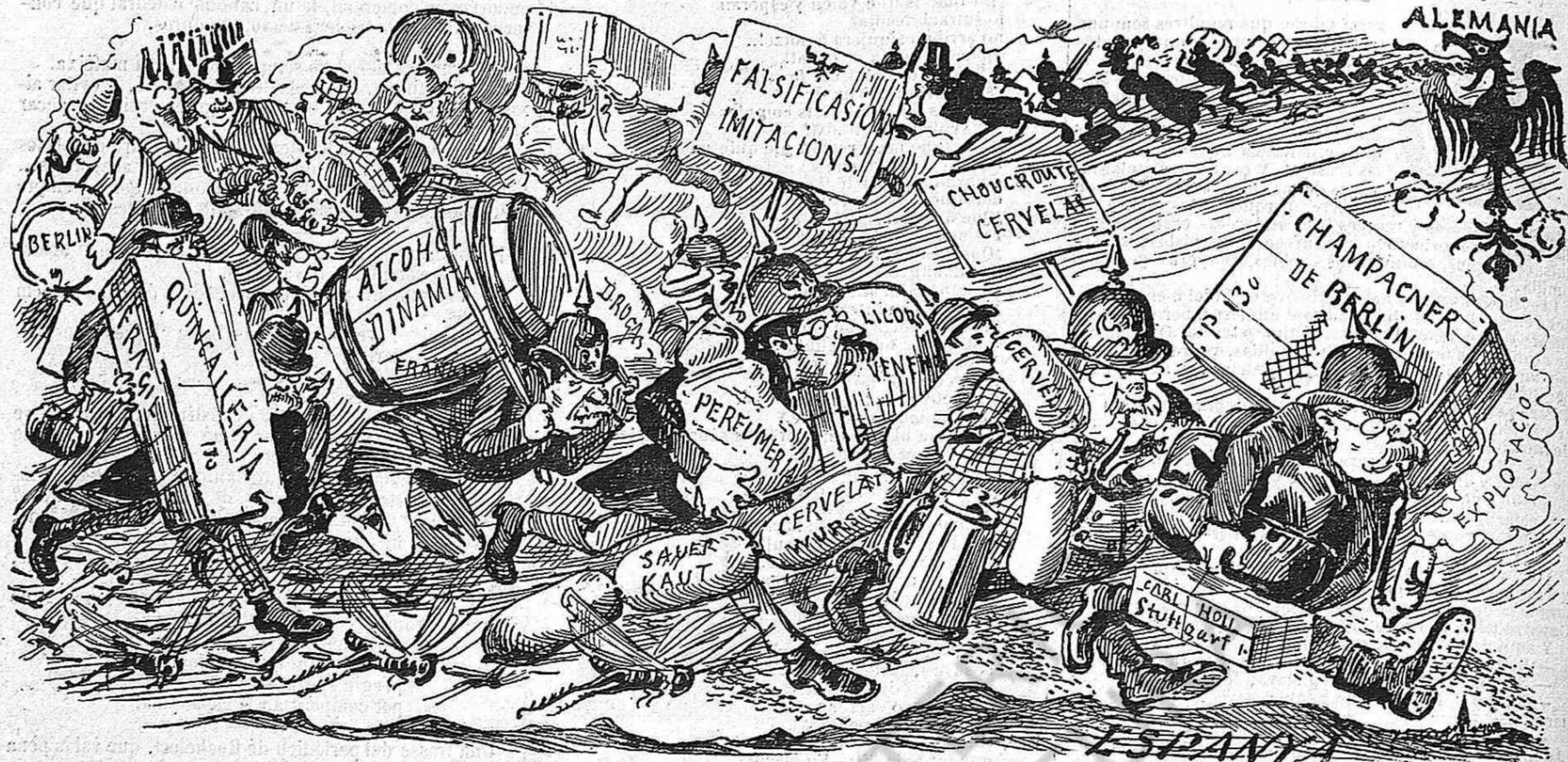
No n'hi ha prou ab las trifulcas que 'l govern nos fa passar que venen á envenenarnos los productos alemanys.

Y todas las naciones de Europa, fins las más enemigas de la República, hija legítima de aquell matrimoni, més d' hora ó més tart, al últim han saborejat los confits de la boda.