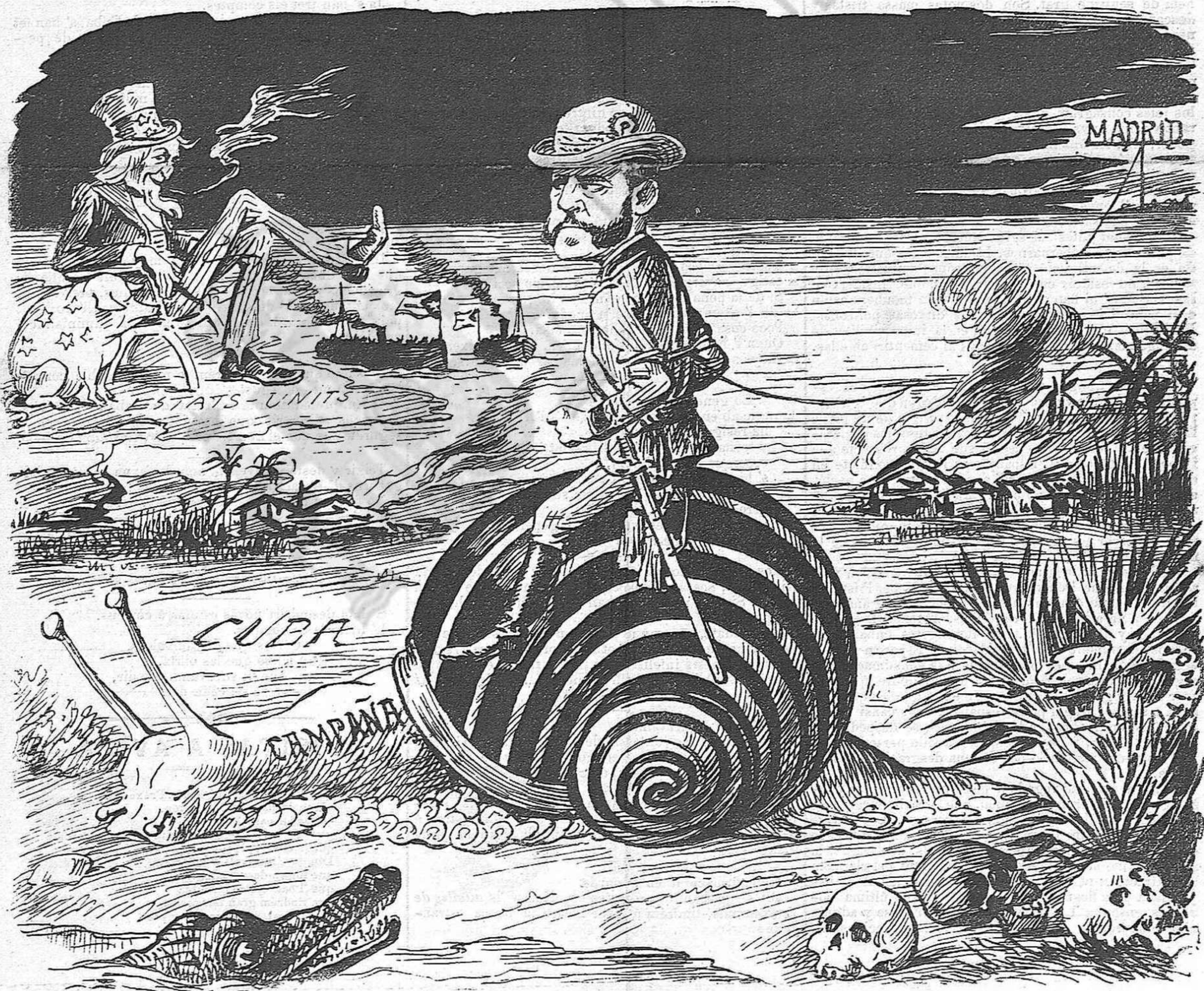
La campaña de Cuba continúa «avansant» ab una rapidés extraordinaria.