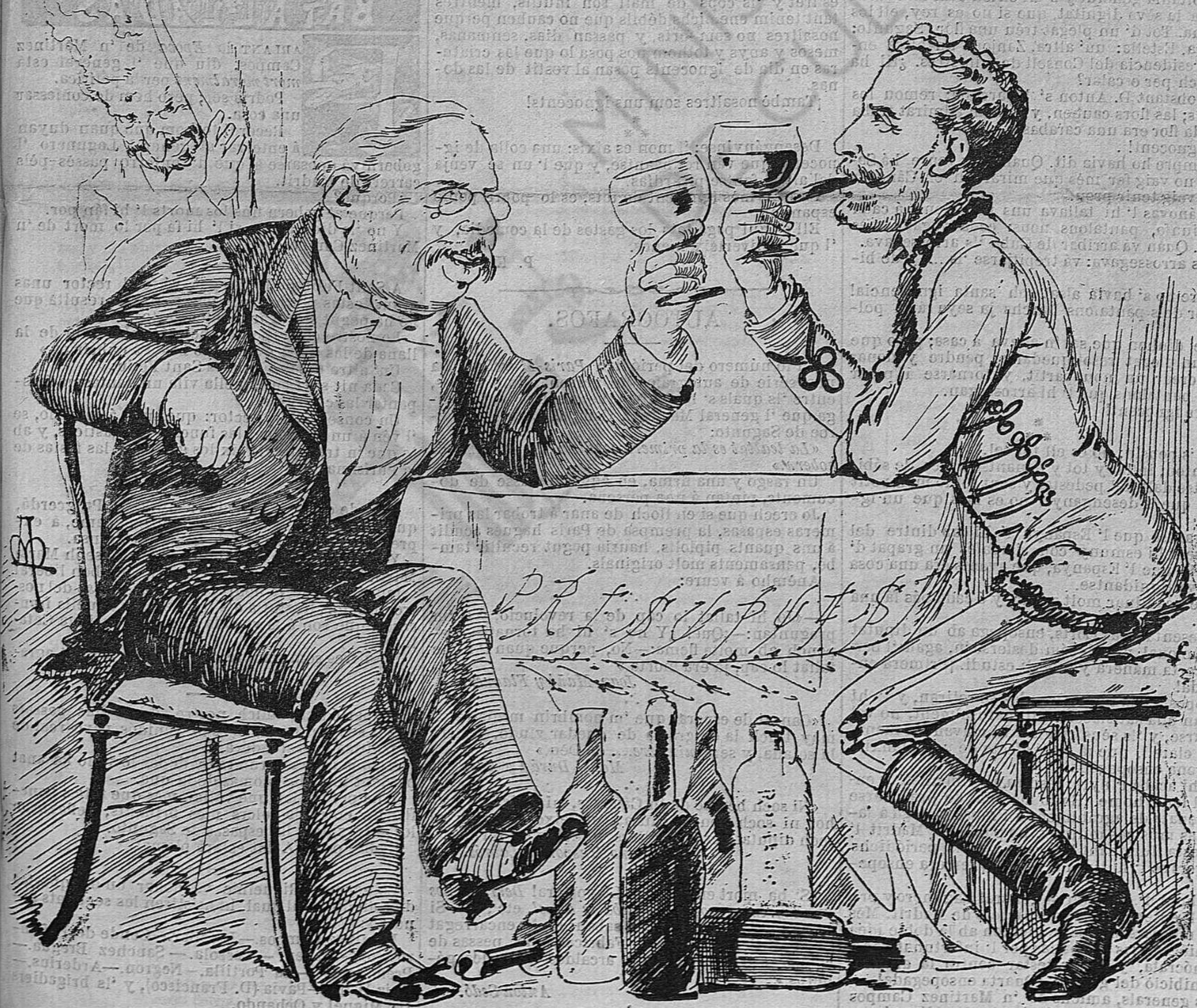
Per Nadal cada ovella al seu corral.