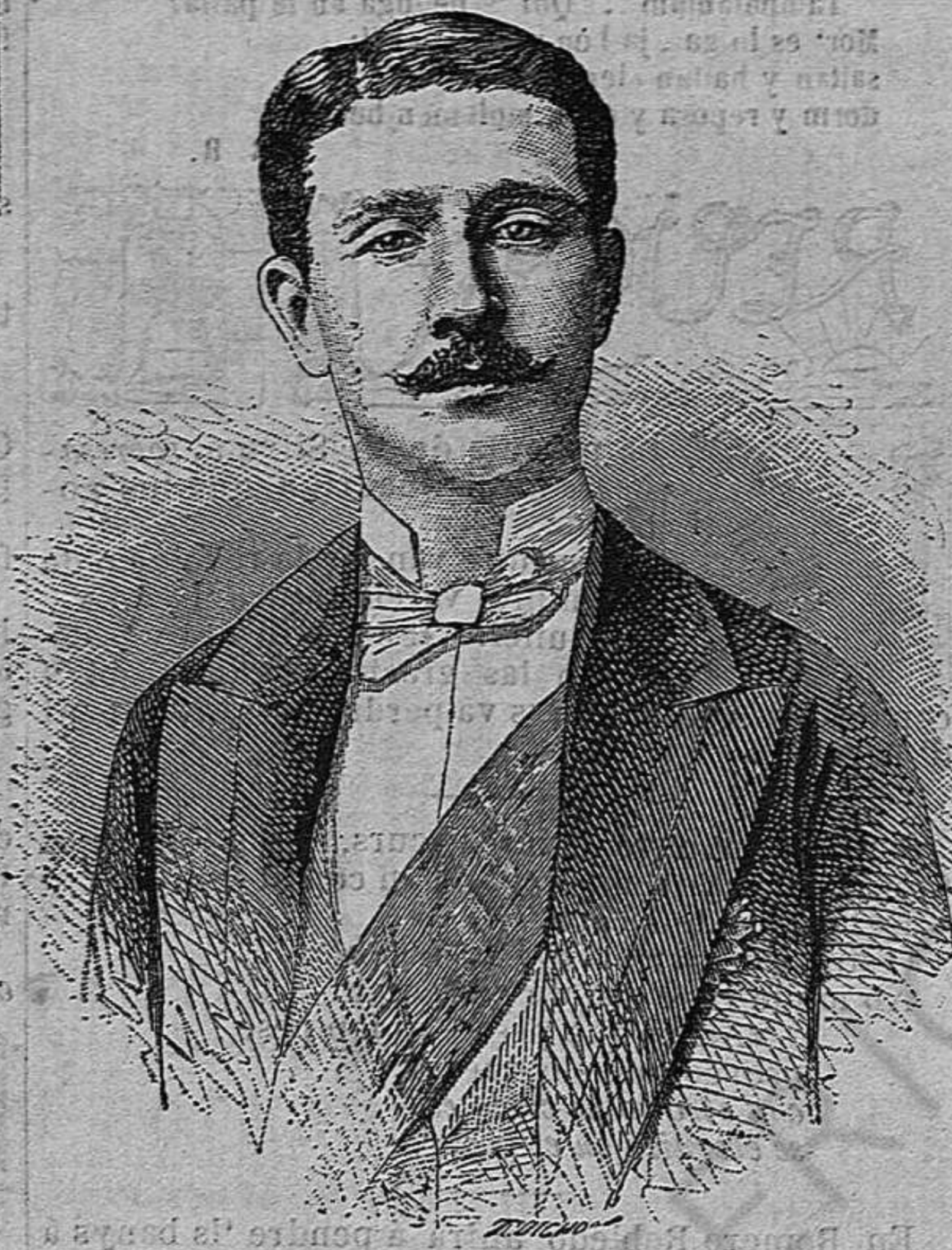
LLUIS NAPOLEON, mort á mans dels zulús.

GEROGLÍFICH. D I INES FABIA V O t k IX S.