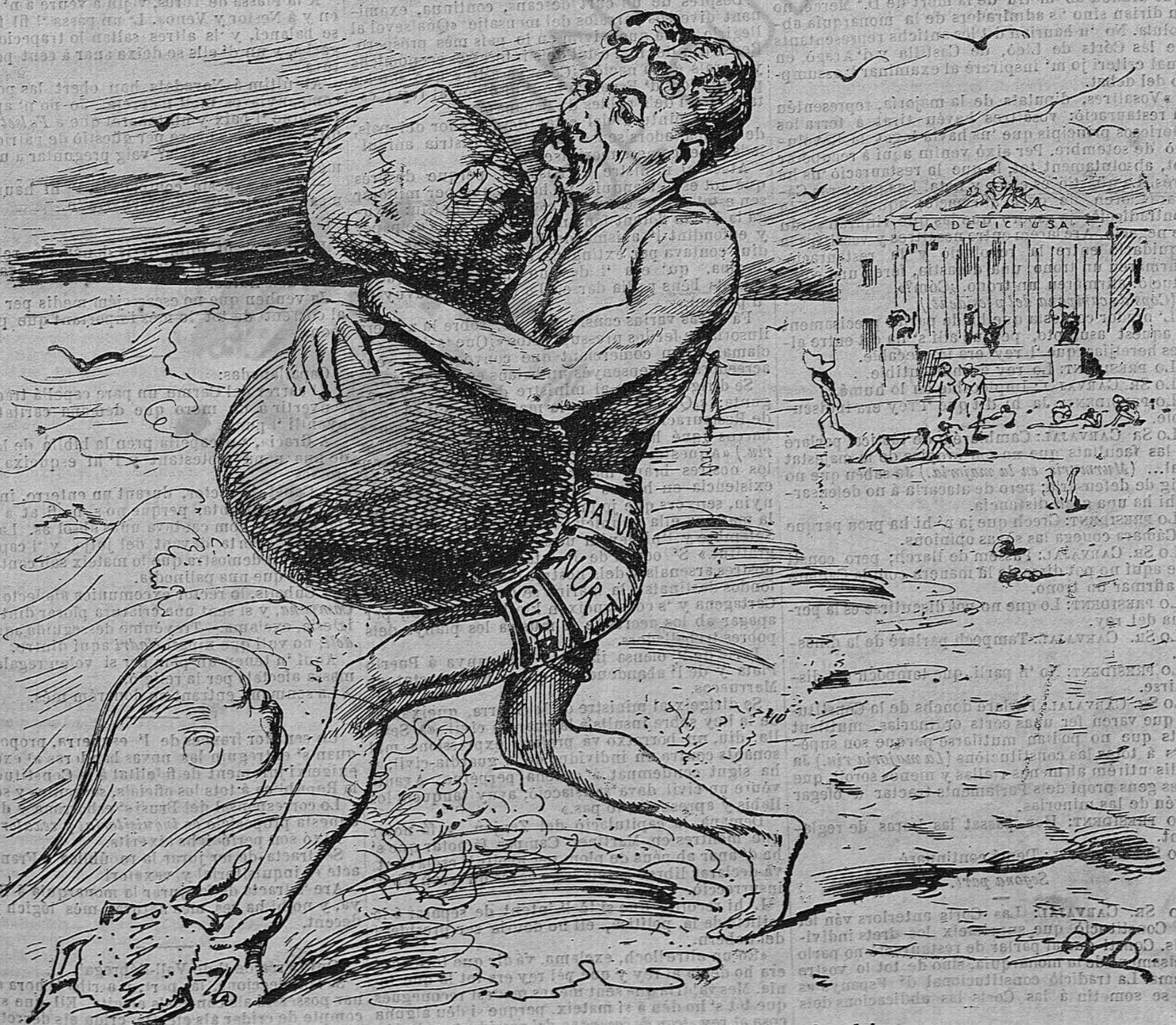
No n' hi ha prou ab surar; la cuestió es nadar bé.