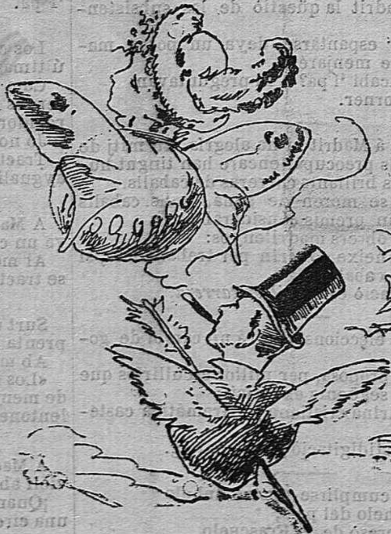
—Y de 'ls amors.