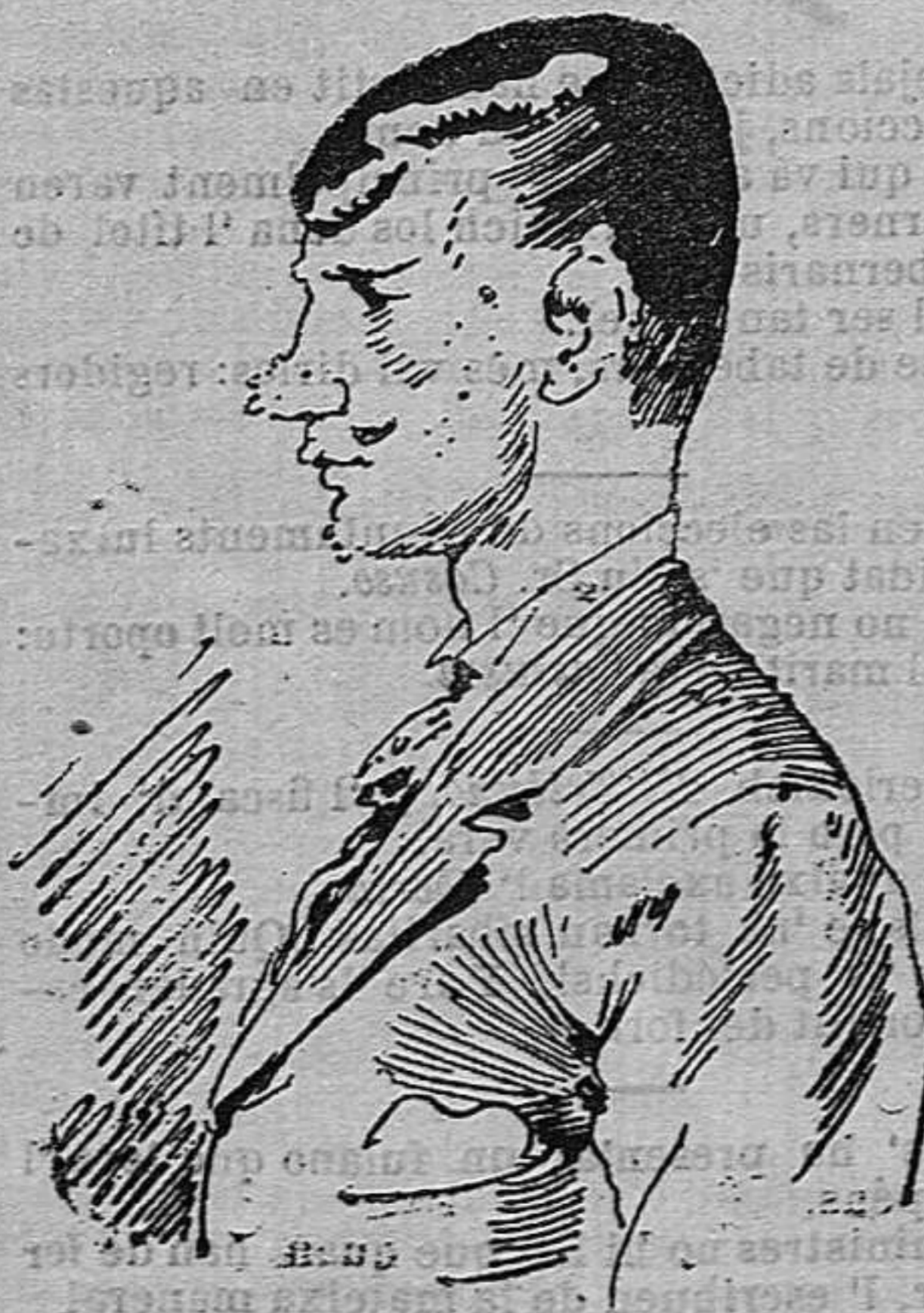
—Jasom al temps de las flors.