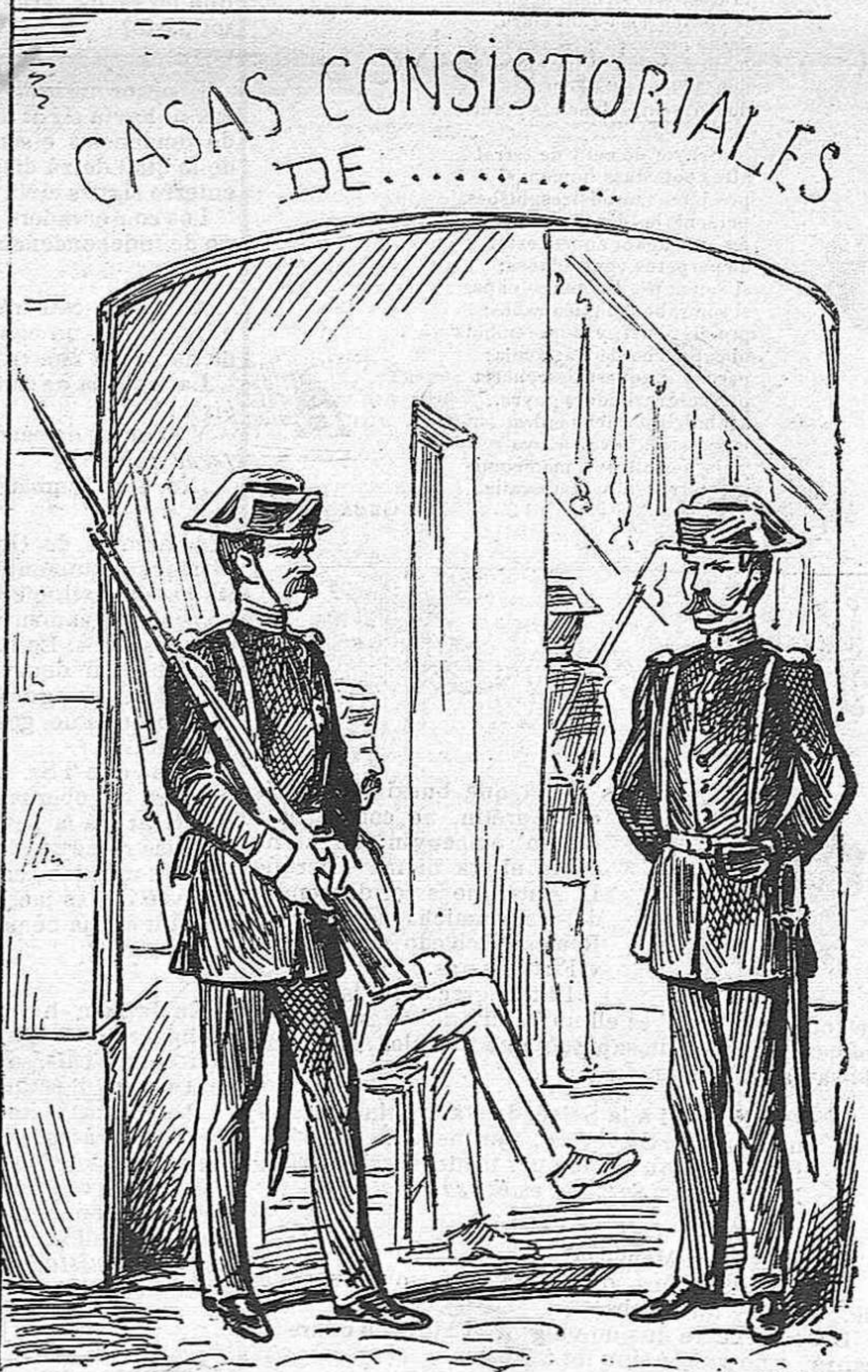
Una reforma necessaria.—Consigna rigurosa: molta vigi- lancia y escorcollar á tots los que surten de la casa.