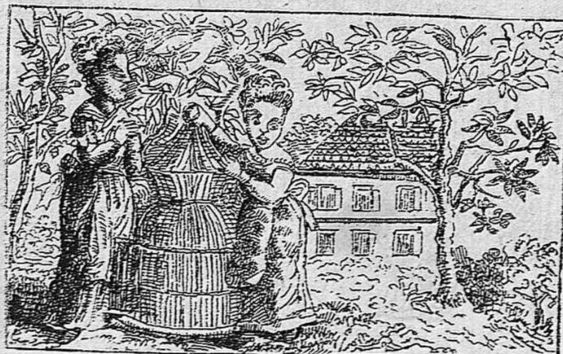
¿Ahont es l' ausell?