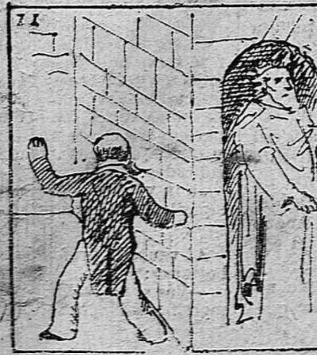
Huye de ca la vida.