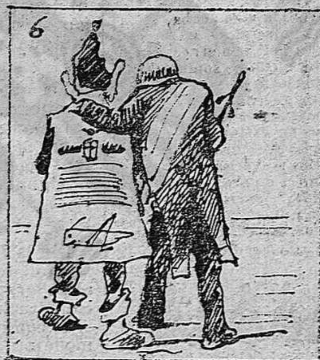
Va con malas compañías.