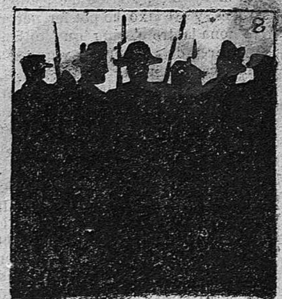
Hace mover á los guras.