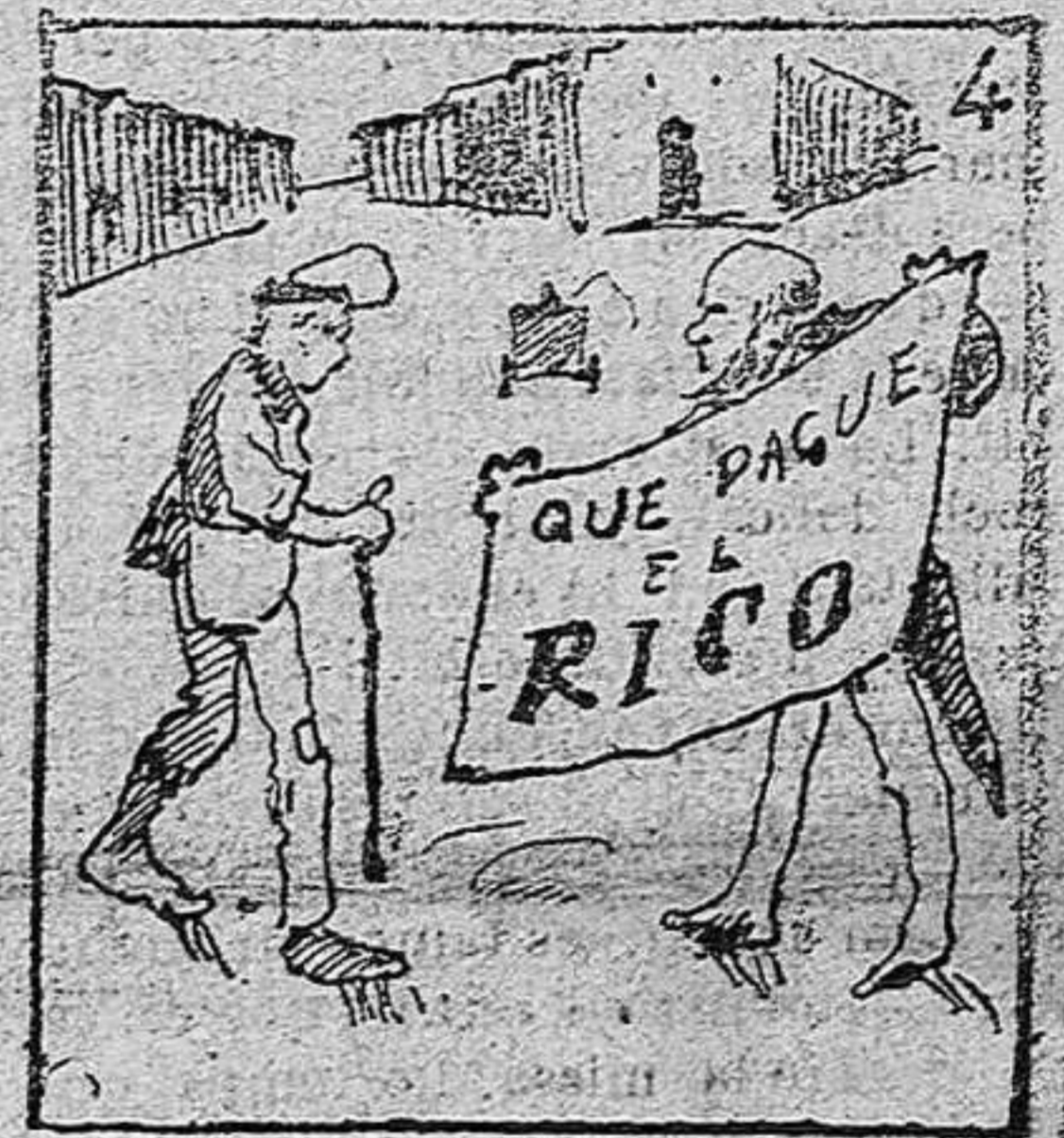
Se burla de los pobres.