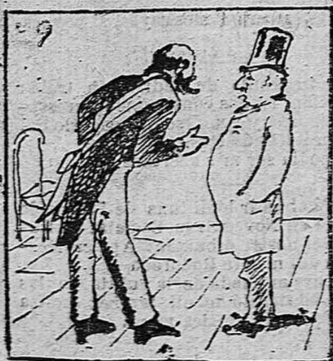
Lo participa á un amigo.