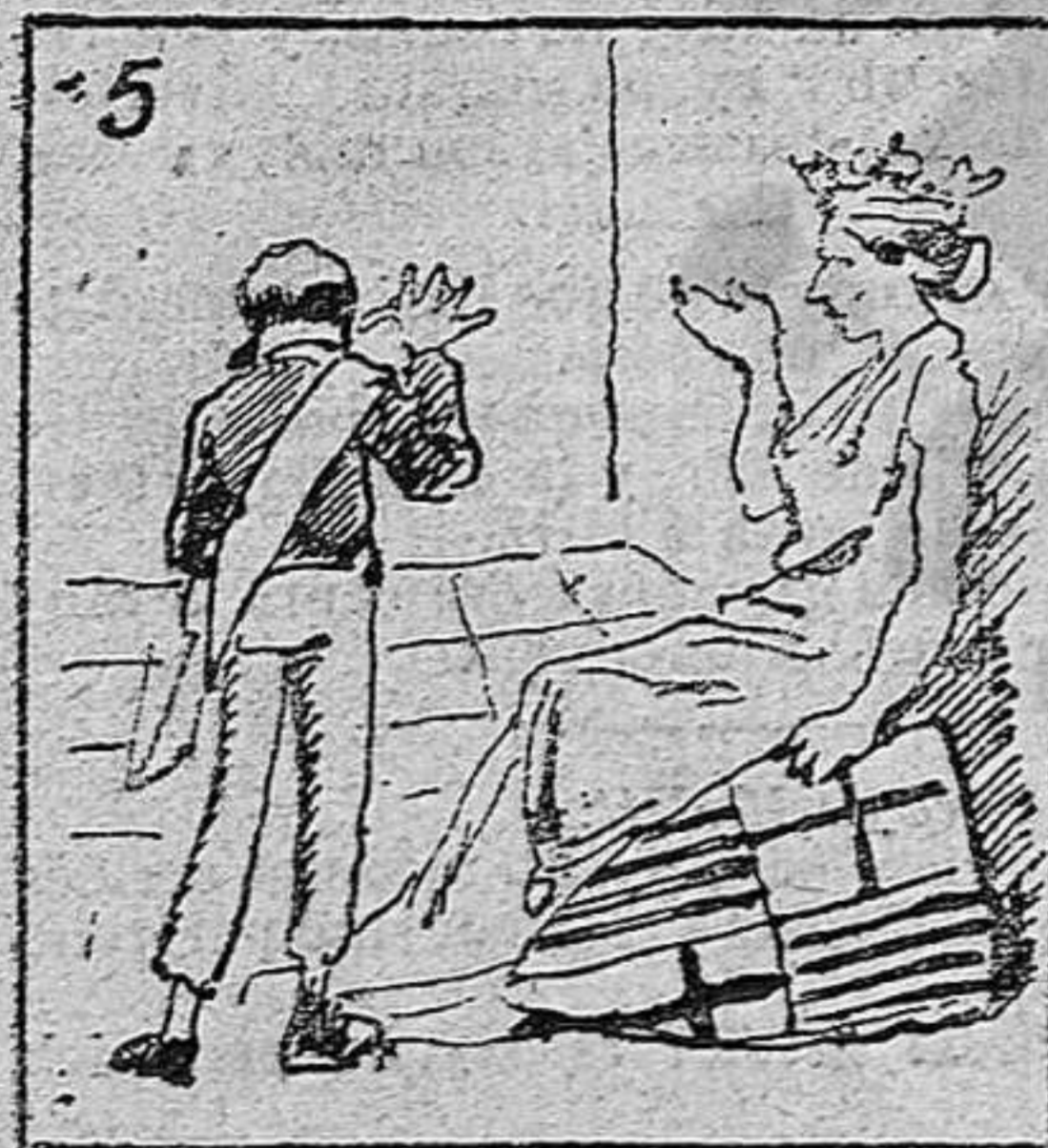
Hace burla de su madre.