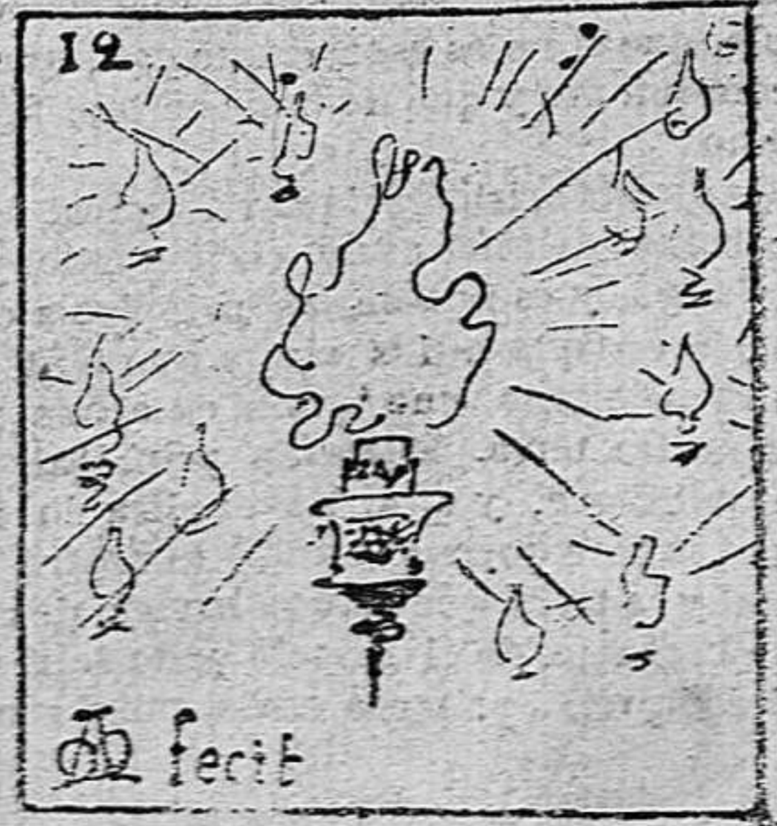
Se hacen iluminaciones.