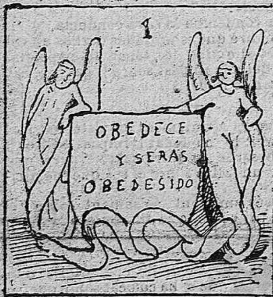
Vida del ayuntamiento malo.