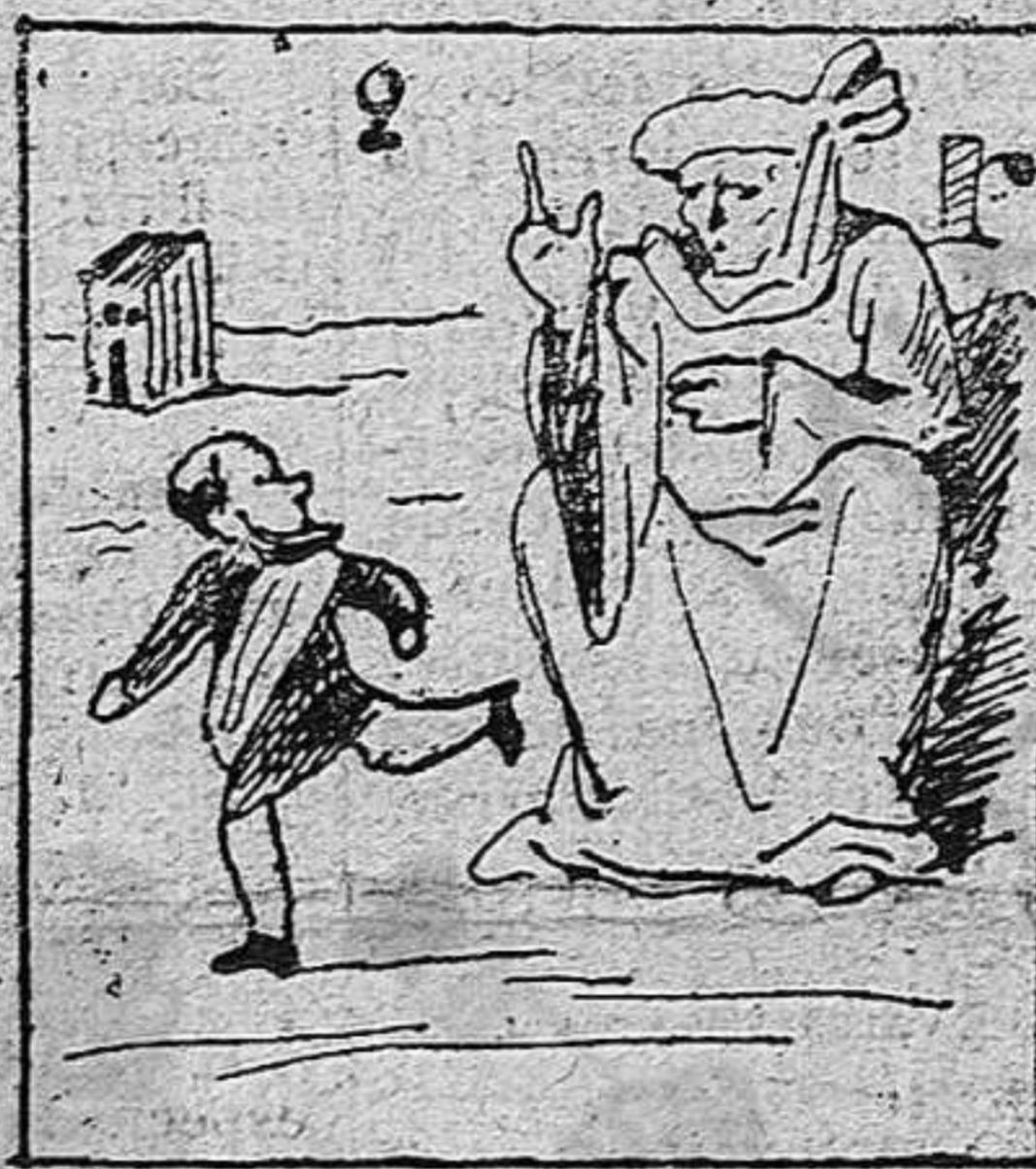
No obedece á su abuelo.