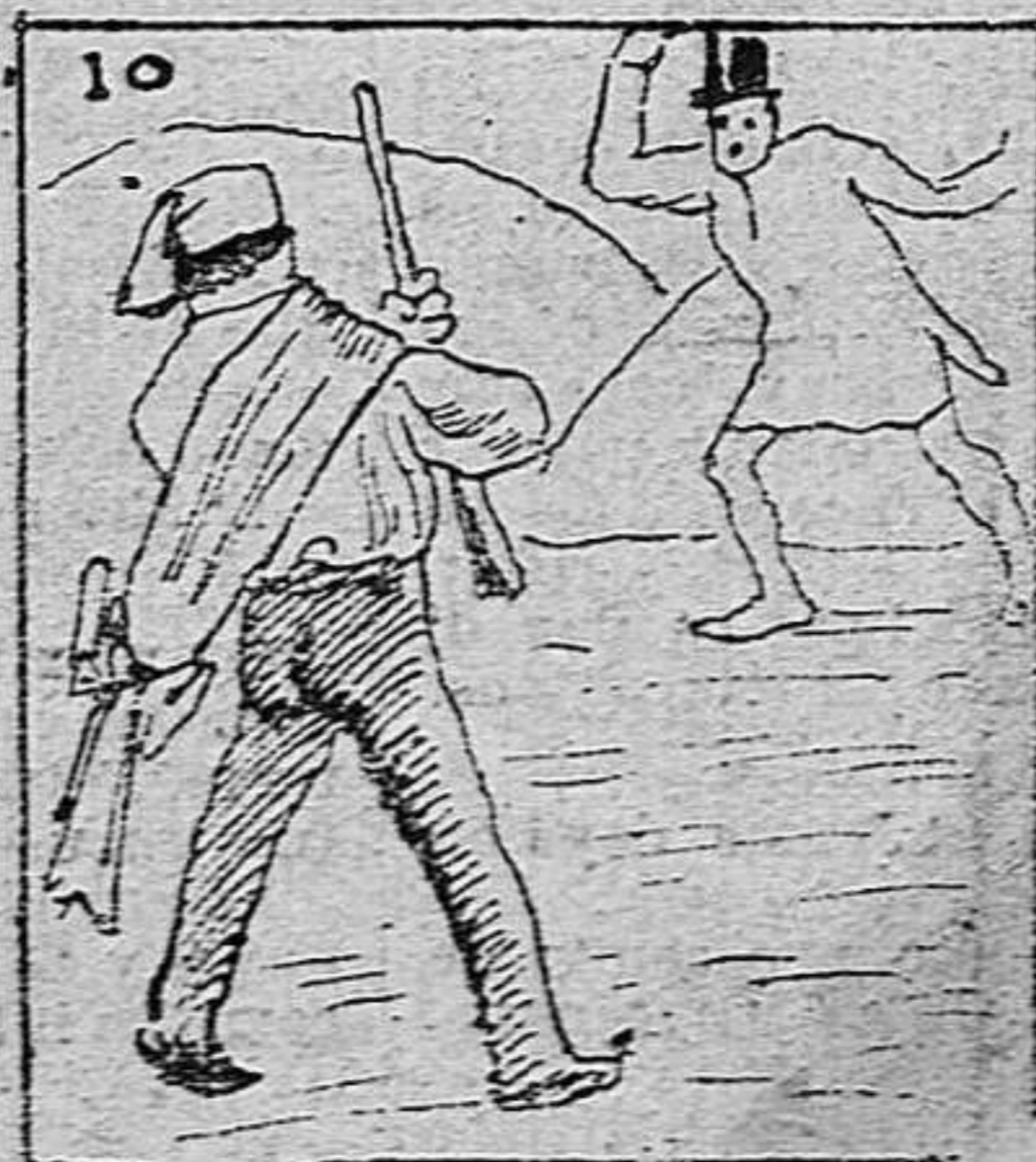
Da sustos al contribuyente.