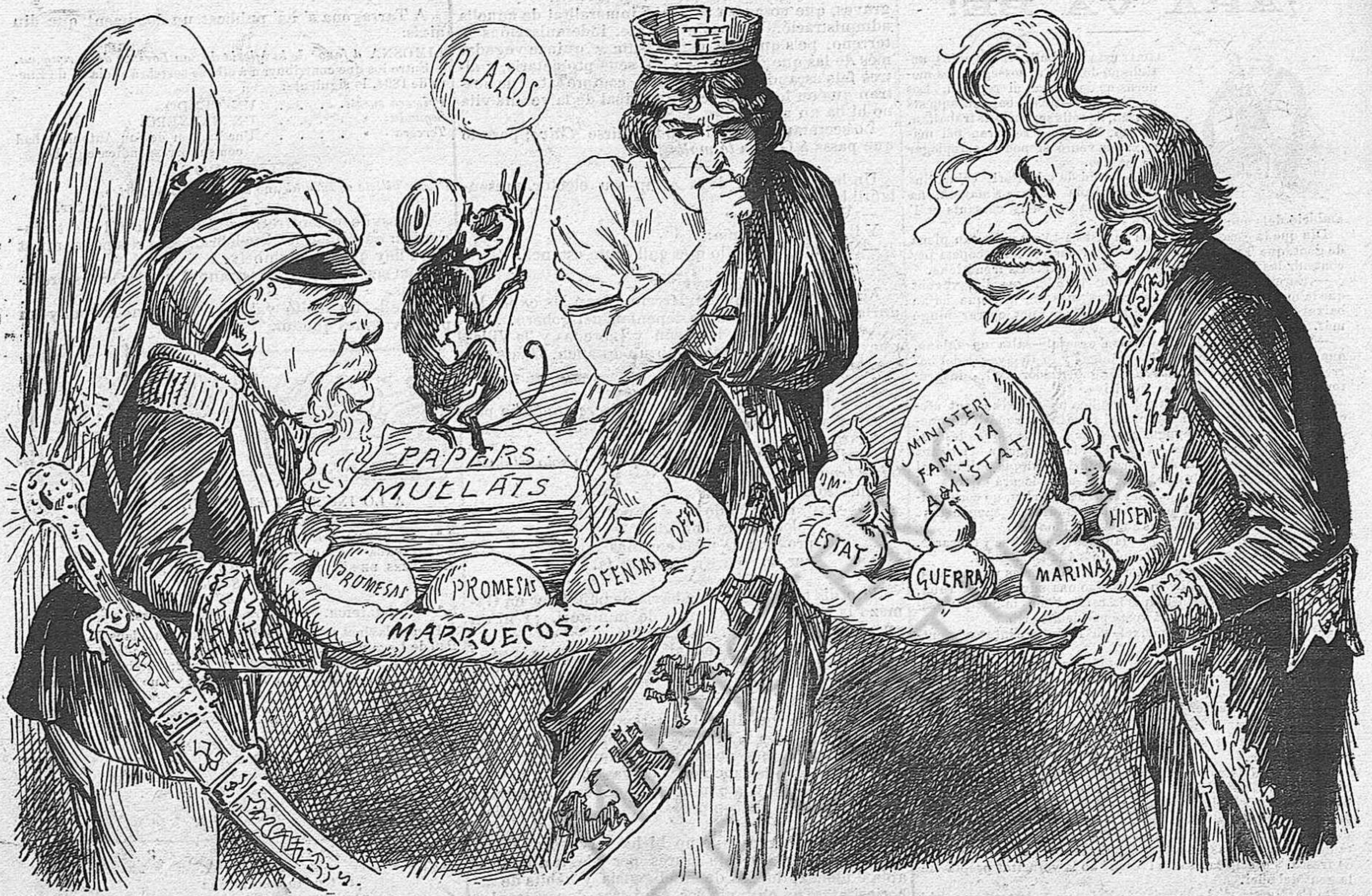
Aquí tenen los obsequis que 'ls senyors de la fusió