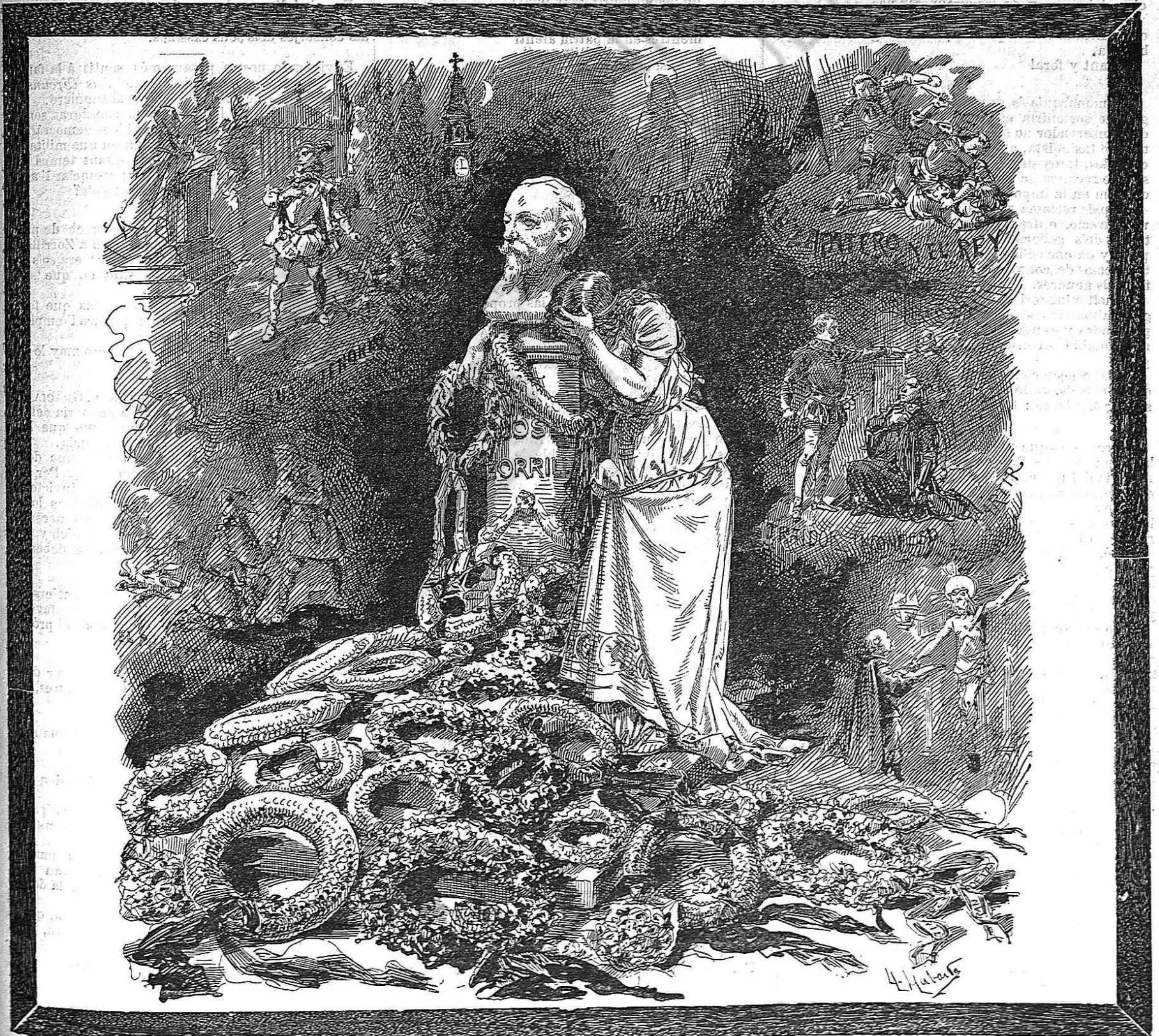
¡A LA MEMORIA DEL GRAN POETA ESPANYOL JOSEPH ZORRILLA!

PREU DE SUSCRIPCIÓ: Fora de Barcelona cada trimestre ESPANYA pessetas 1'50. Cuba y Puerto-Rico, 2.—Estranger, 2'50.