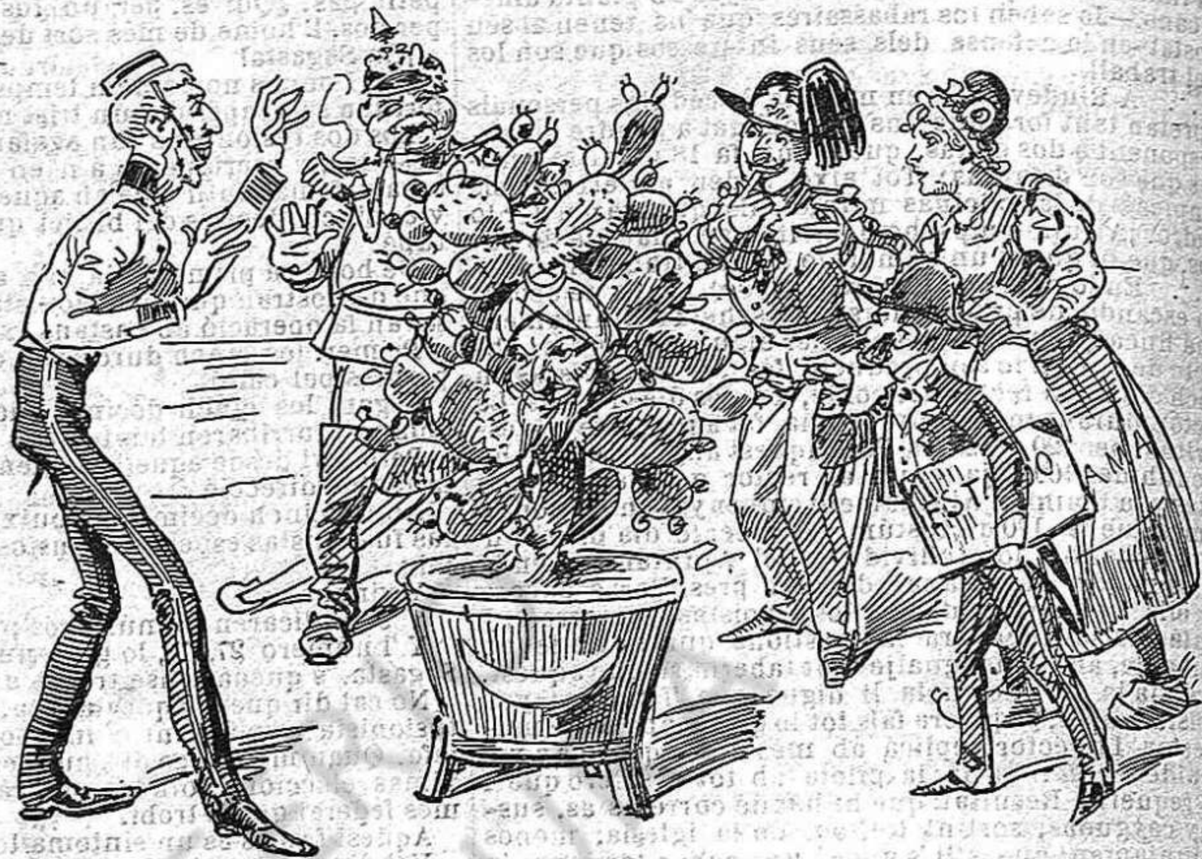
La qüestió de Marruecos de igual modo sempre está: tothom té por de punxarse; ningú la gosa à tocà.

por donde los astros van, dile que mire à D. Juan llorando en tu sepultura.» en Zorrilla exclamà: