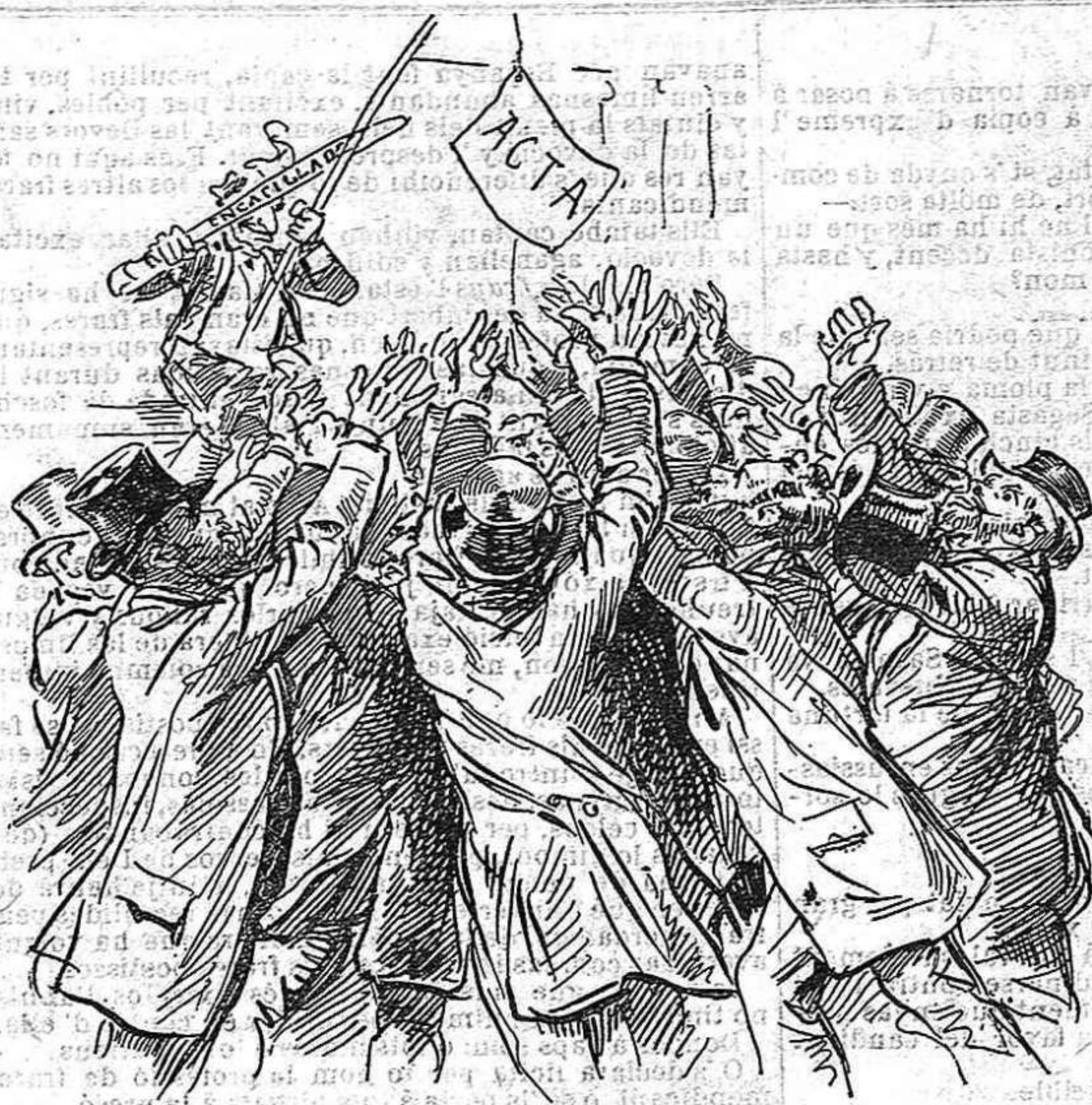
Aquí tenen l' espectacle que avuy te lloch à Madrid: ¡y dihuen que als diputats los ha de elegí 'l país.