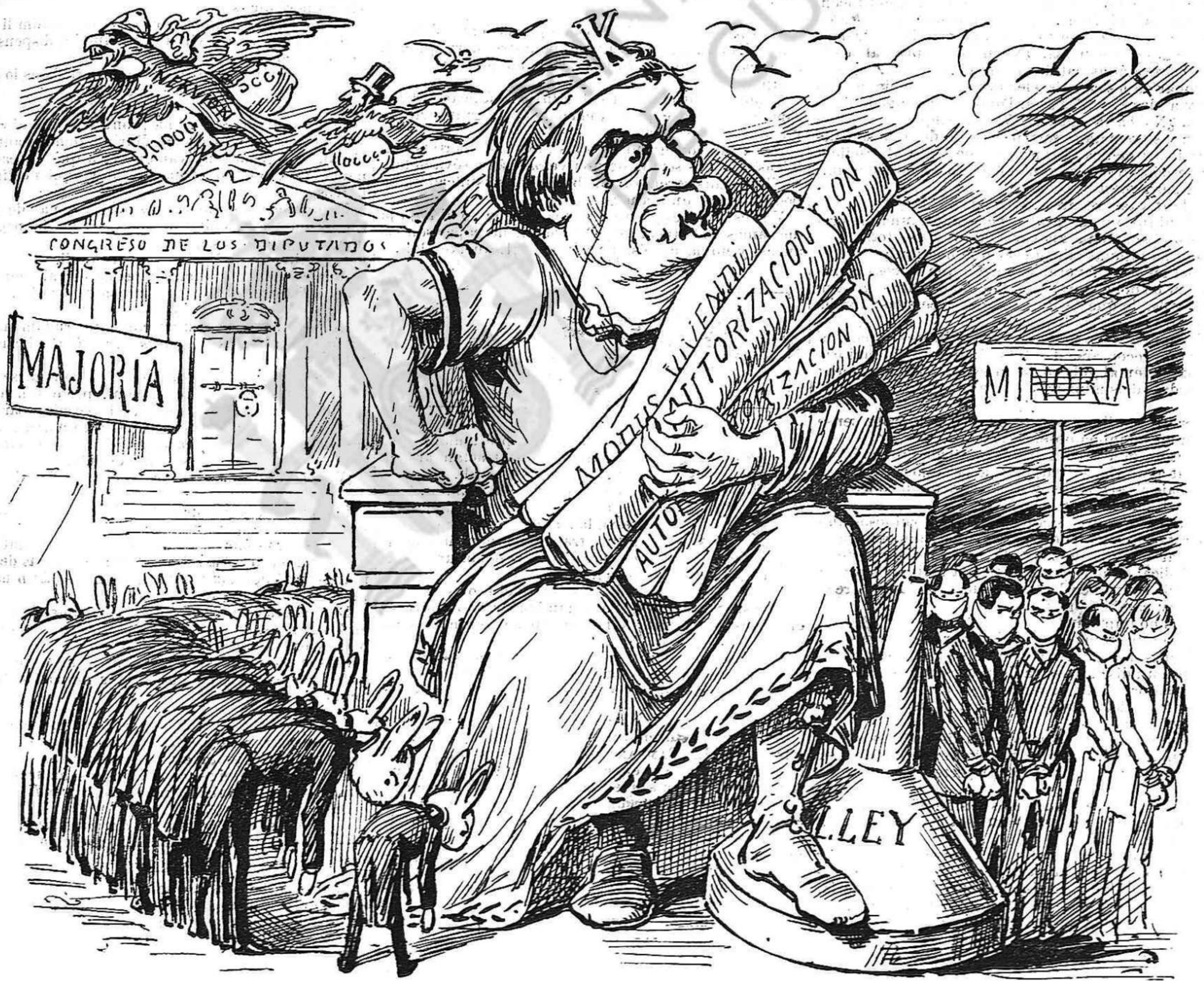
Vingan autorisacions y tot lo demés son trons!