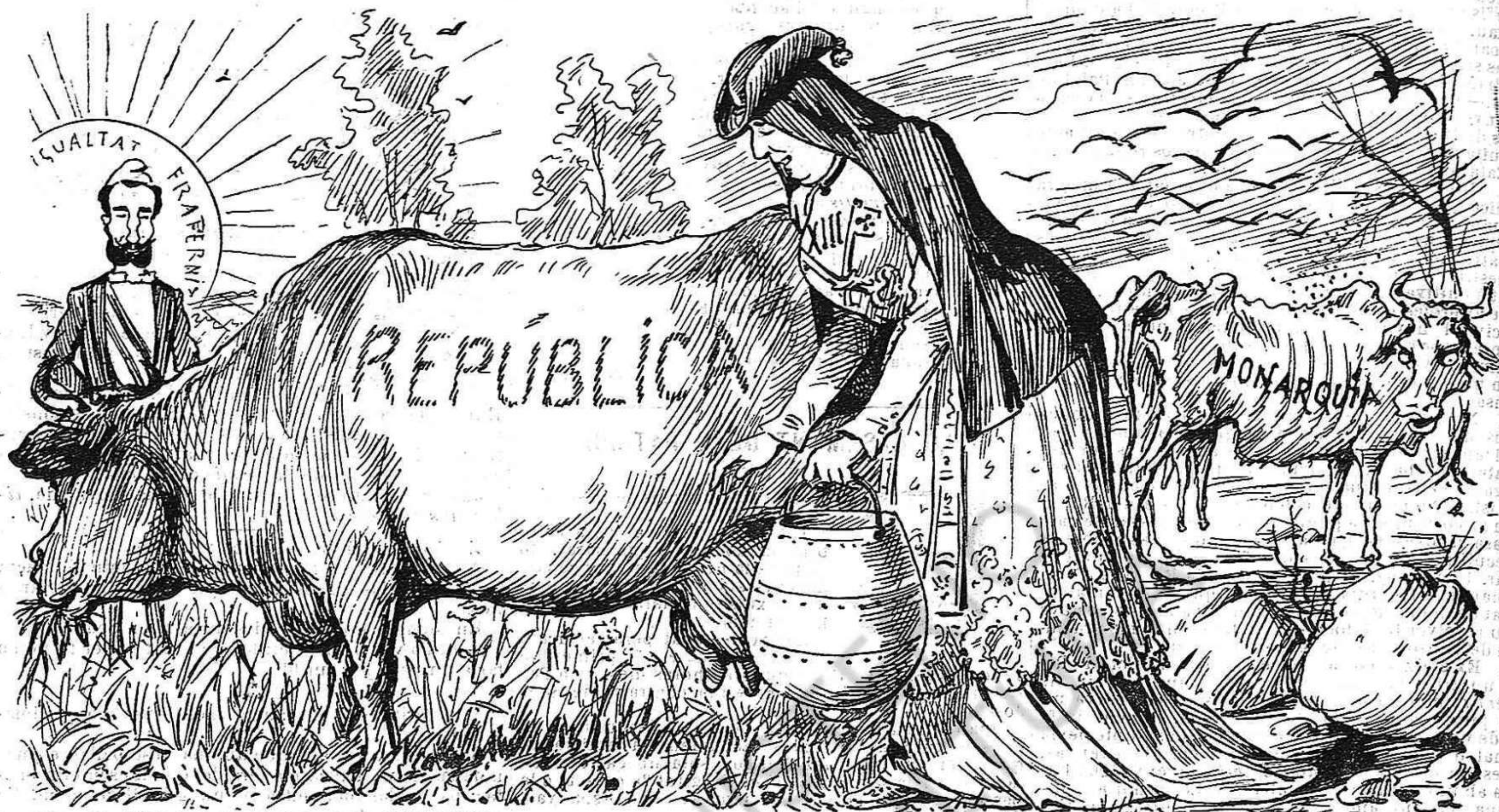
La Iglesia deixa la flaca que ja no li pot servir,