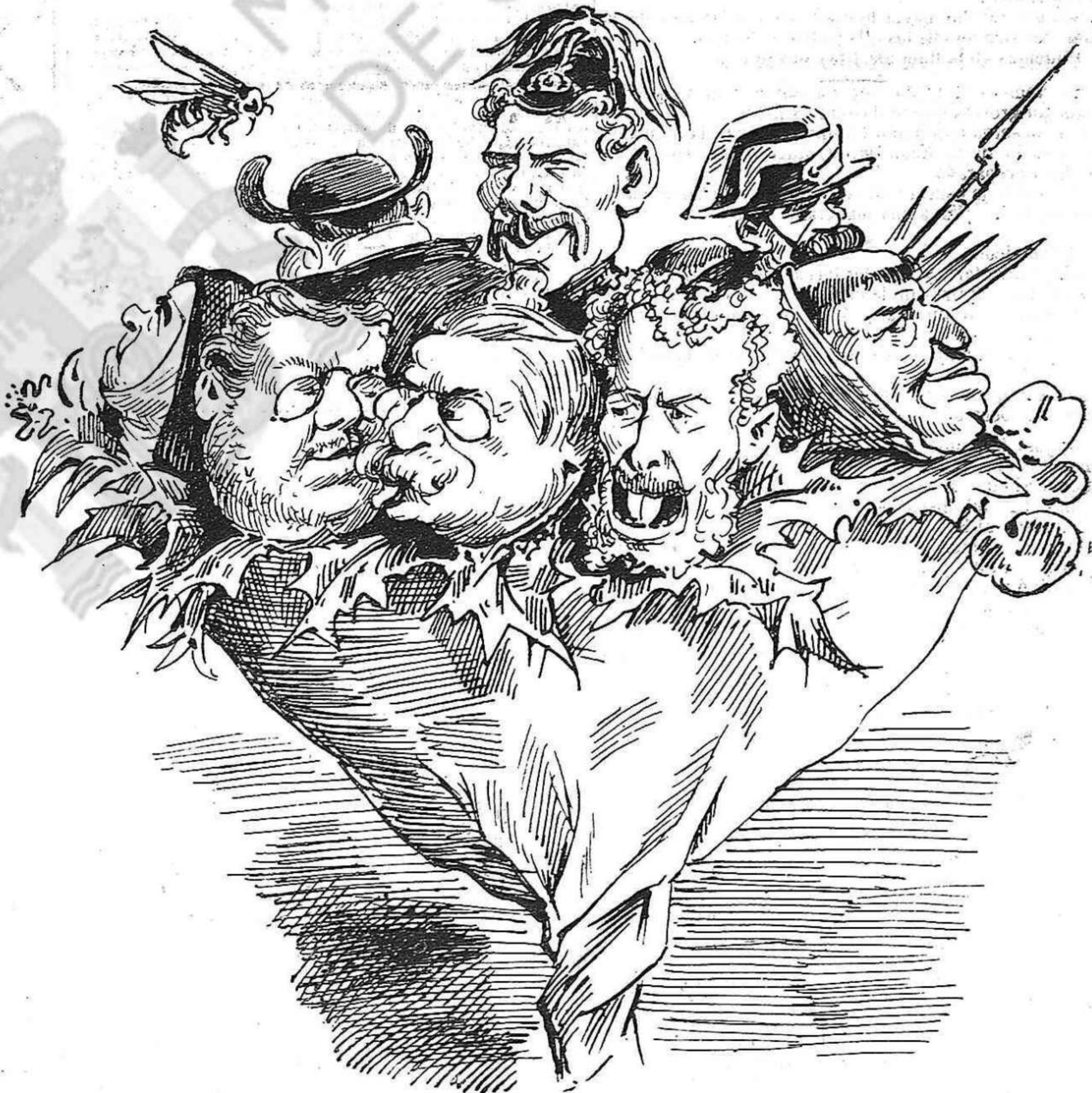
¡Vaya quinas flors!