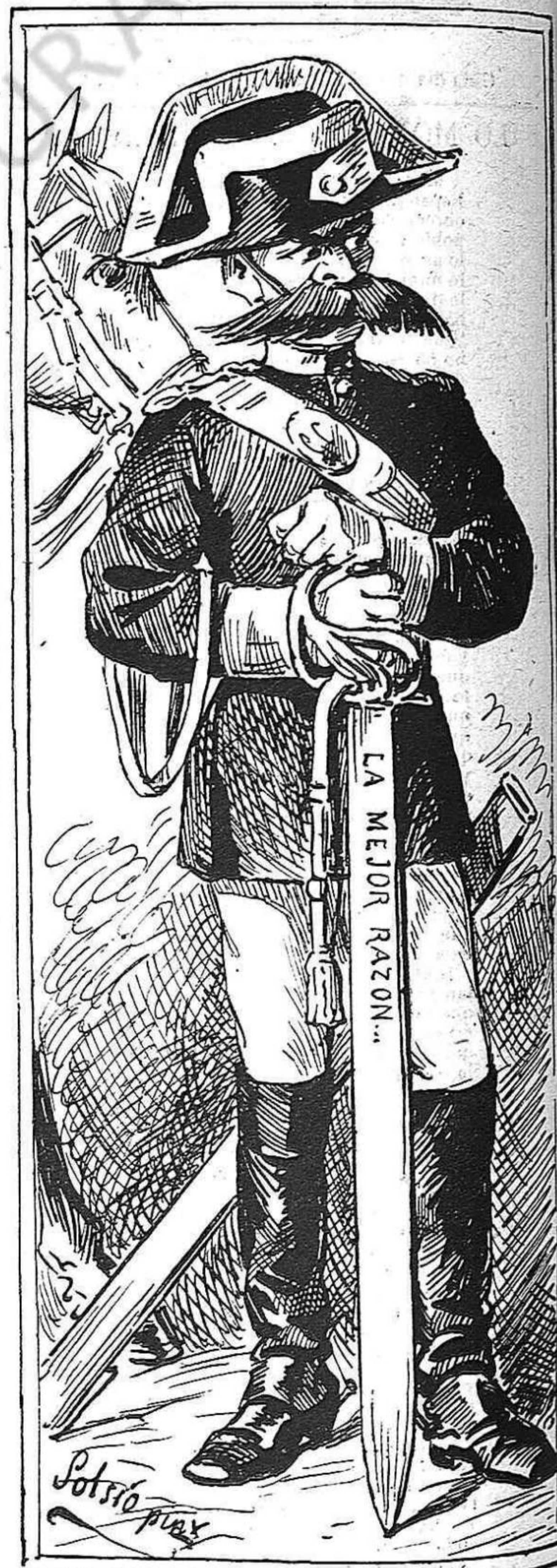
Esperant lo primer de maig. (Pintura a la sanguine per Sol-Esio.)

LOPEZ, Editor.—Rambla del Boij, 20. Barcelona: Imp. de Lluís Tasso, Arch del Teatro, 21 23