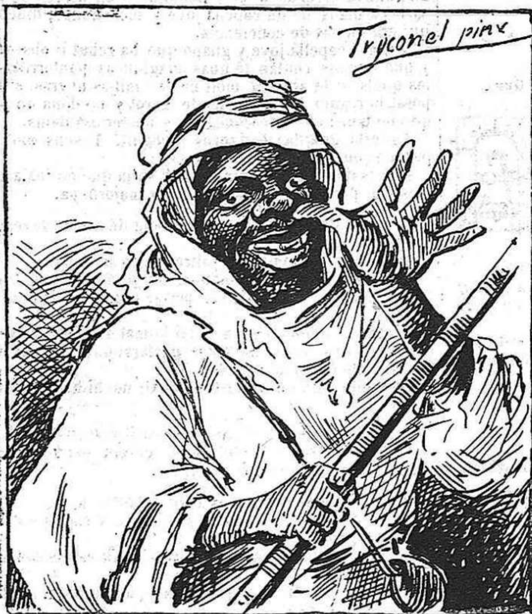
Moro rifenyo saludant als espanyols. (Pastel de Tryconel.)