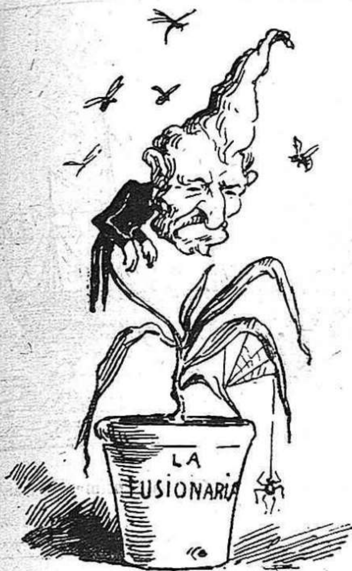
Cada dia més decayguda per taltarli arrels.

per veure si 'l poble hi cau: Ha pensat en Santa Bràbara perque ara ha sentit tronar; però en passant lo rubasco, dintre d' un més ja que va que ni menos se 'n recorda del seu discurs del Senat?