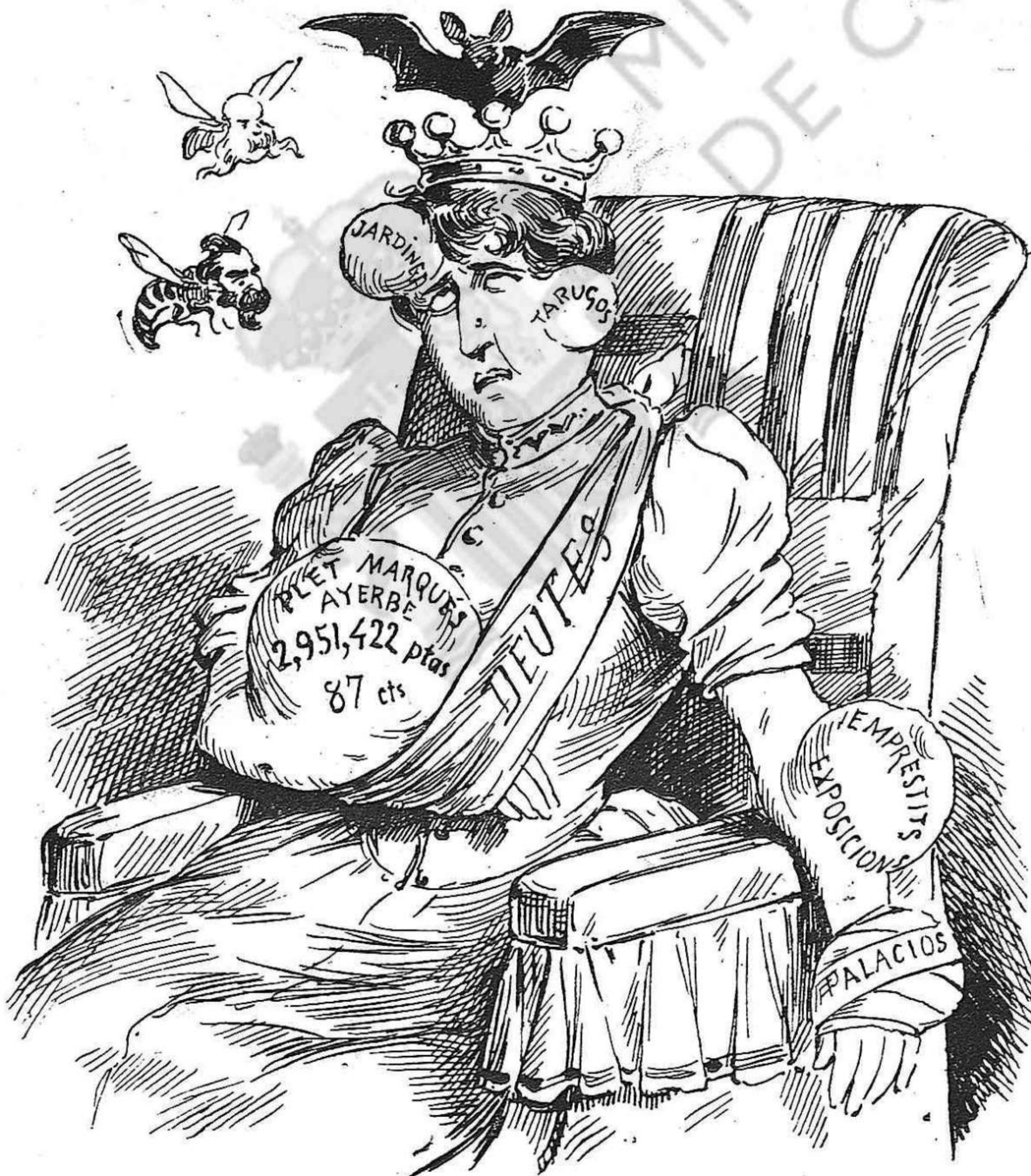
Pobra Pubilla, ¡quins foronçols!