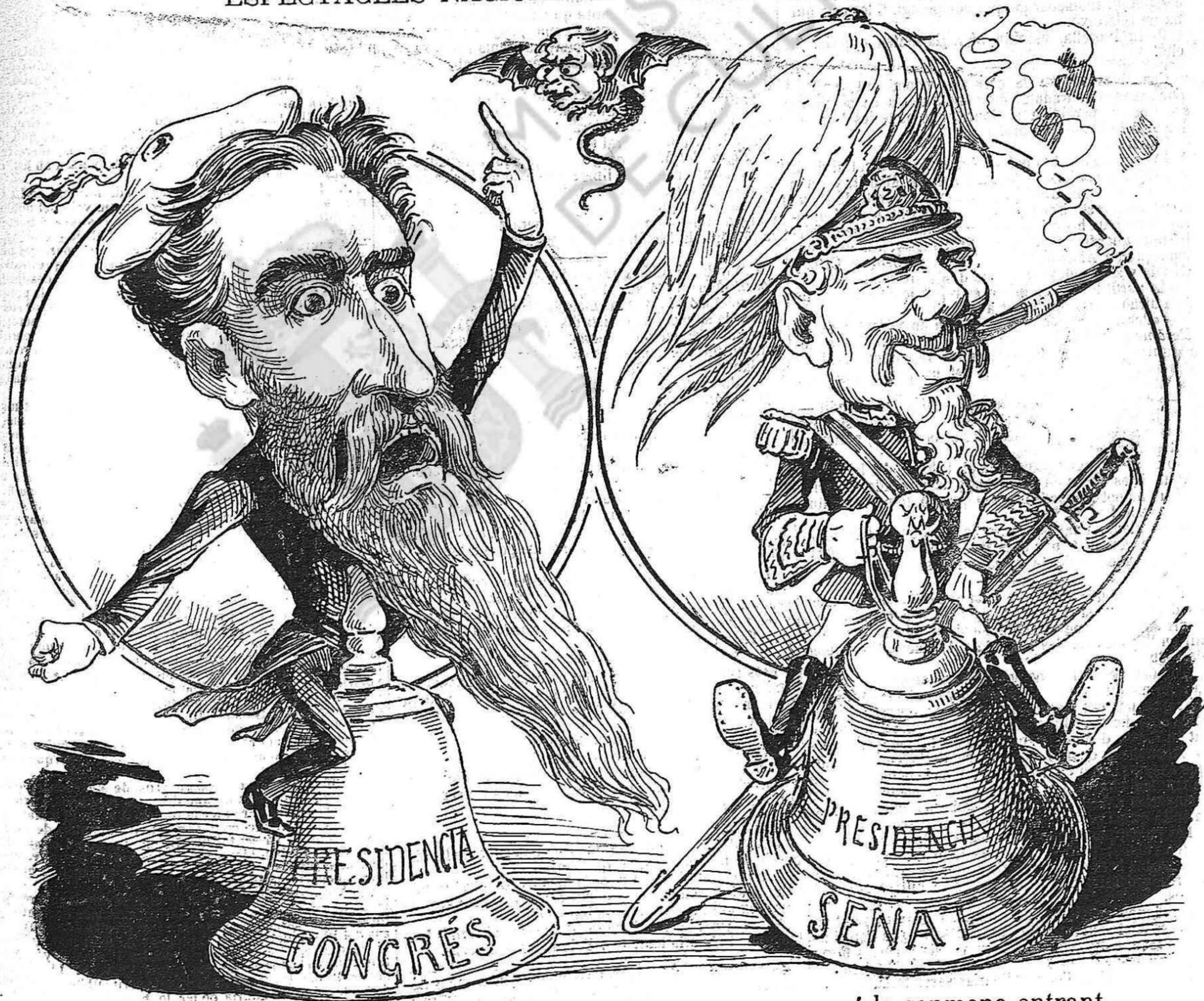
Los directors de las funcions de la temporada, que comensará la senmana entrant.

ESPECTACLES NACIONALS.—COMEDIA POLÍTICA.