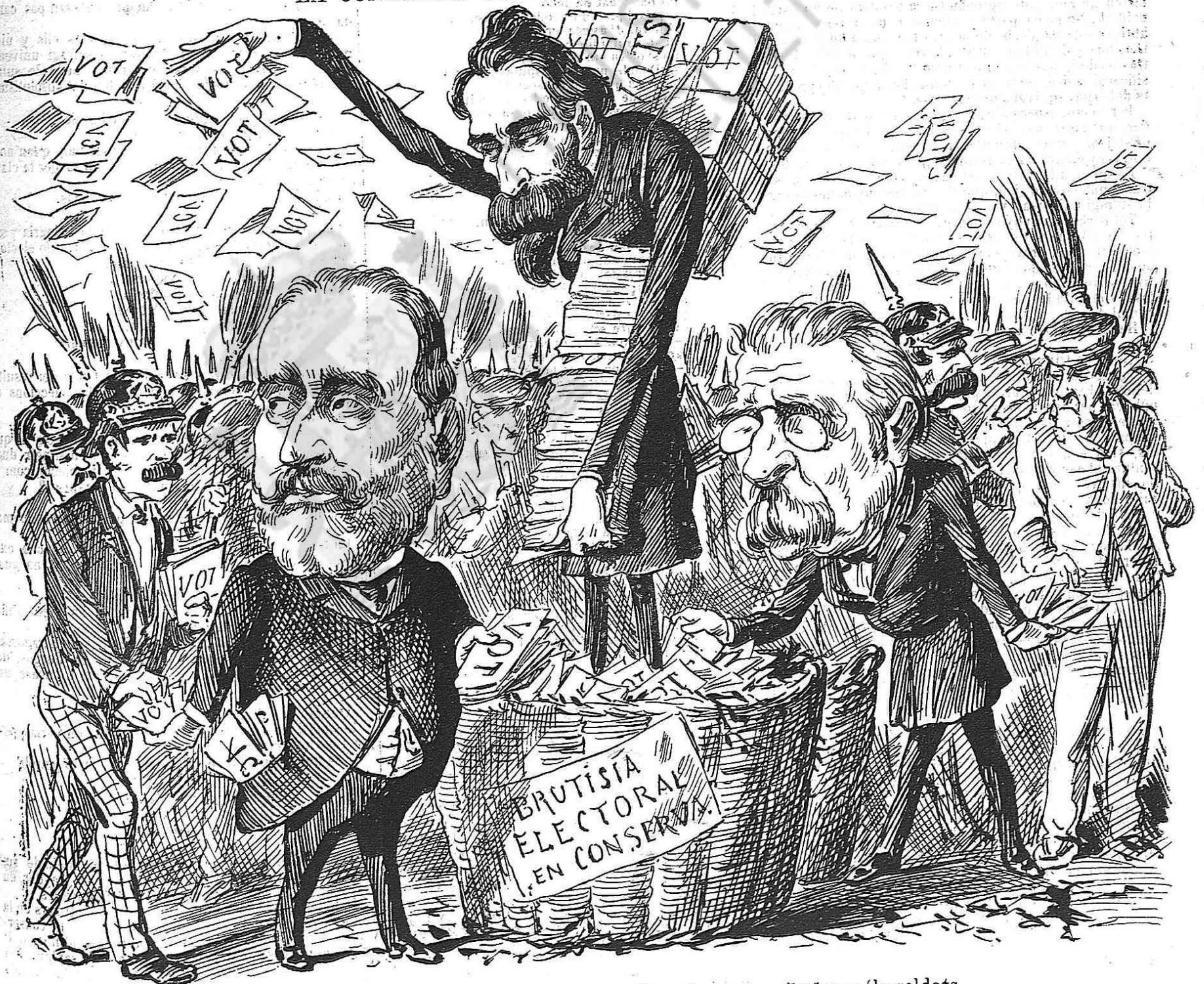
Aquí tenen tot lo partit conservador de Barcelona: los quefas y 'ls soldats.