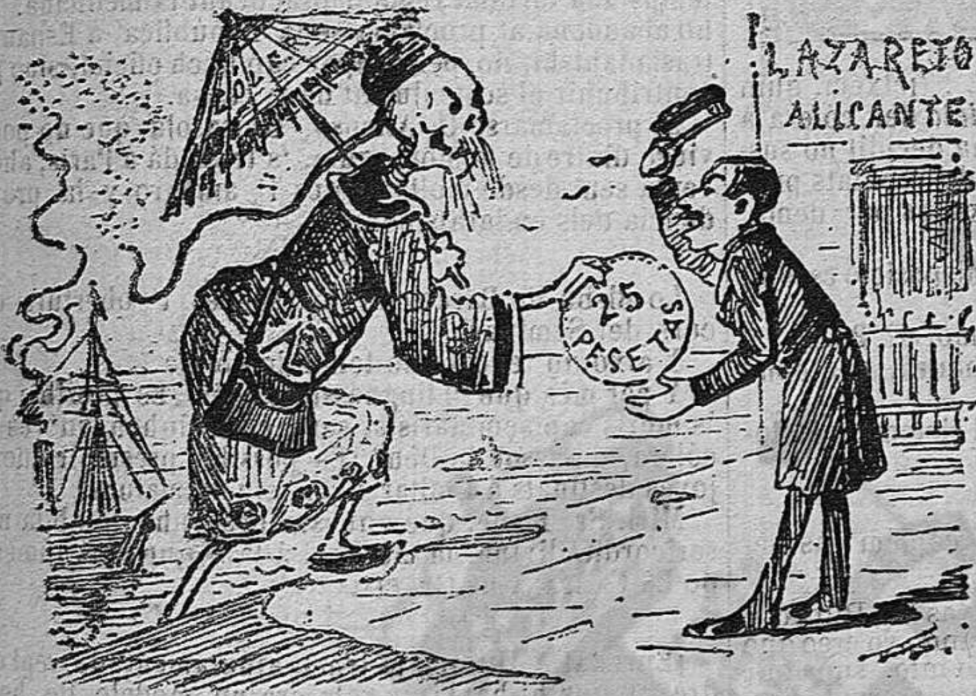
A Alicant hi entra pagant cinch duros.