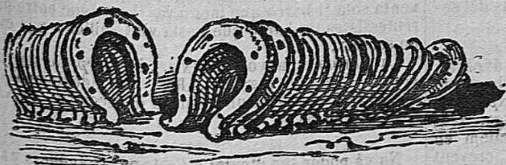
Compra d' espanyas.—SÍNTOMAS.