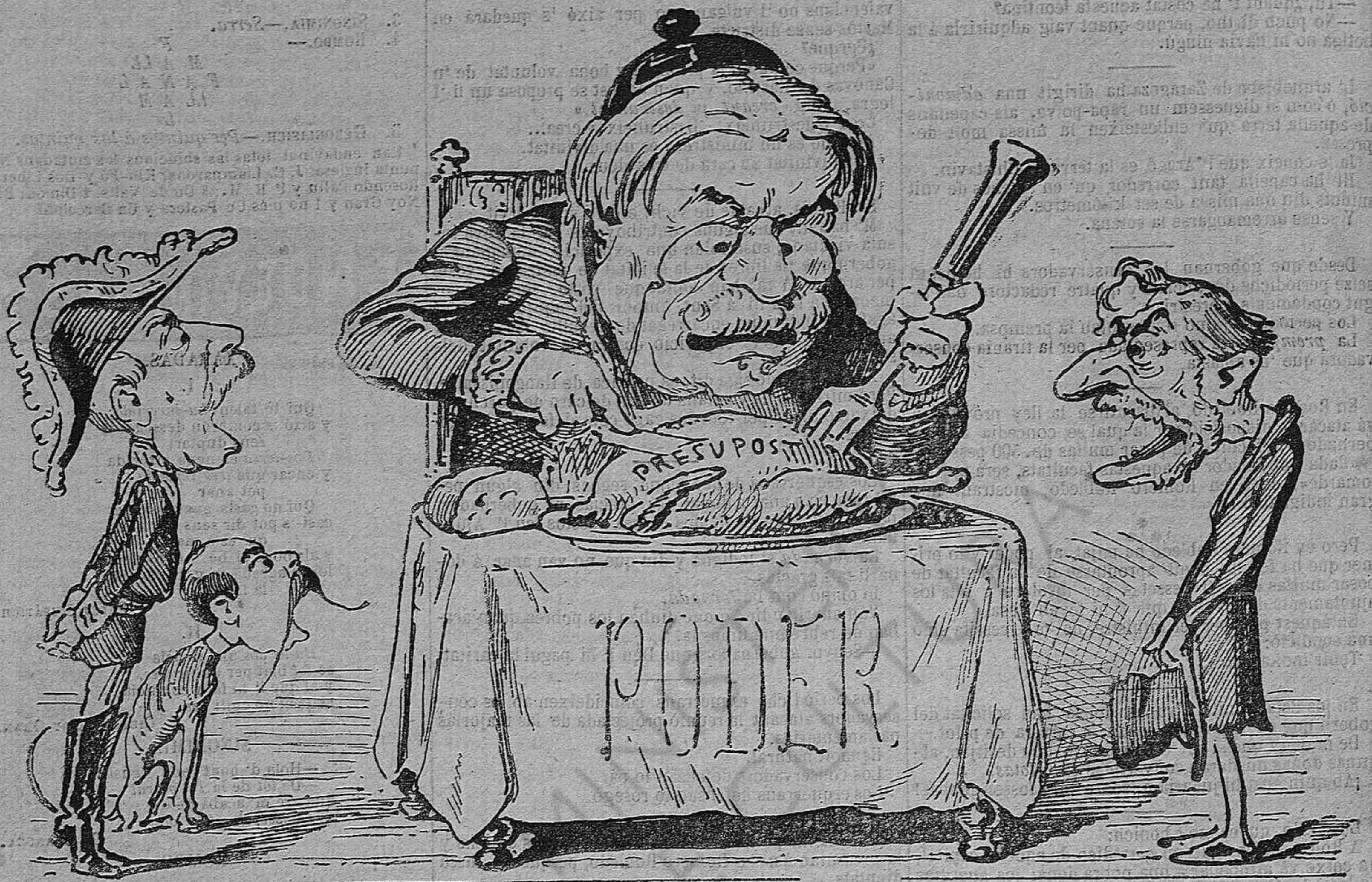
Lo qui té la butlla y los que no la tenen.