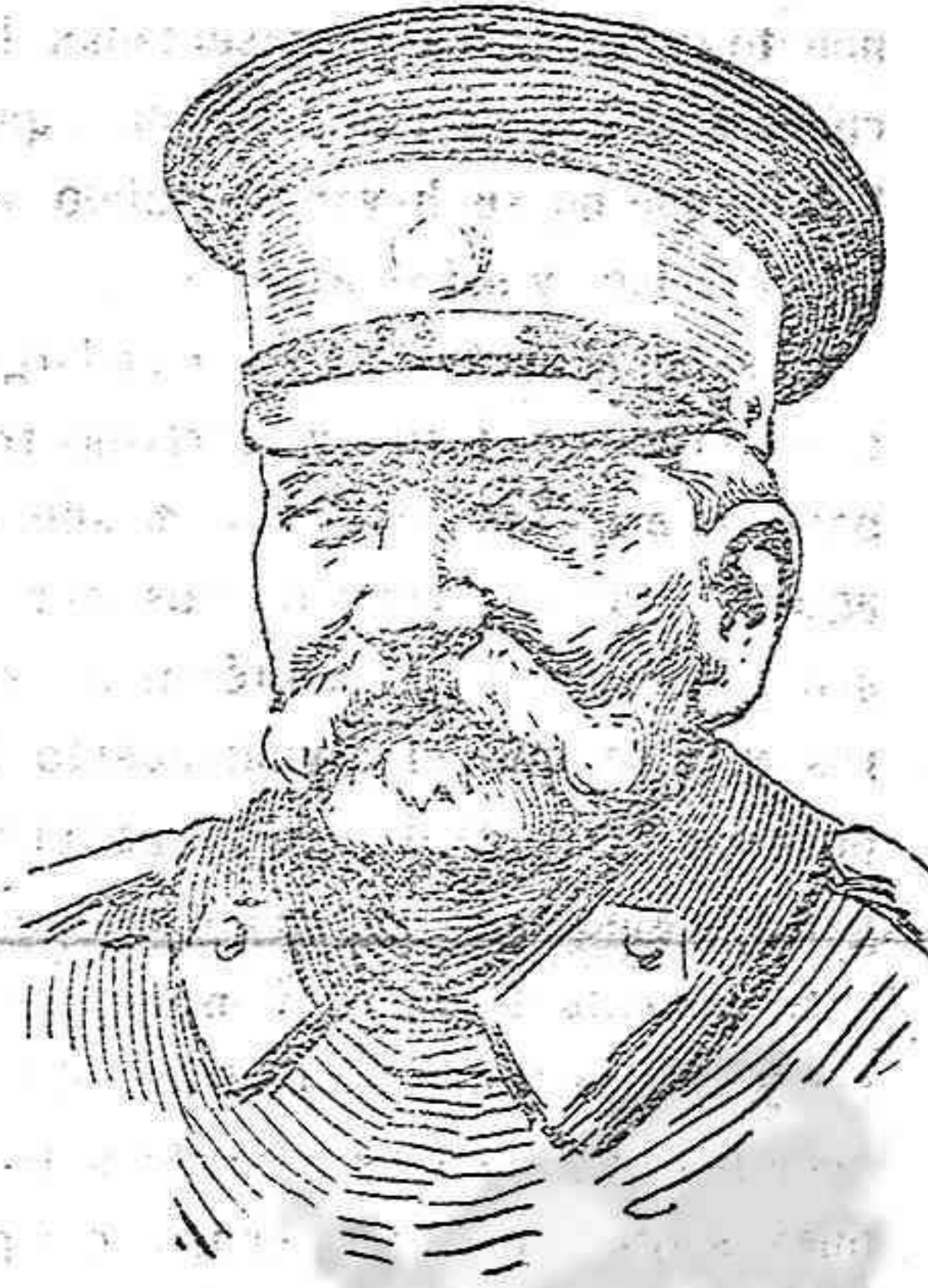
El rey Pedro I de Serbia