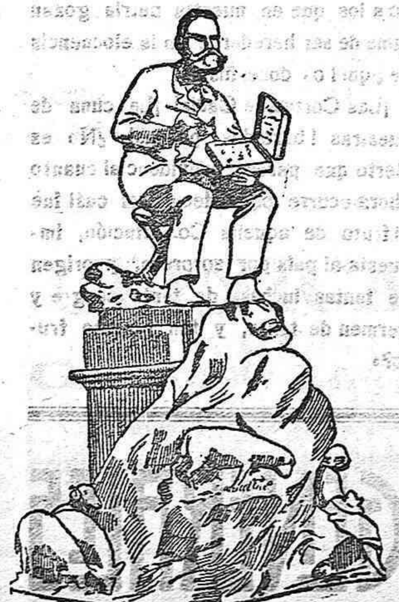
Proyecto del monumento a Casimiro Sainz.

Reinosa va a elevar a Casimiro Sainz un monumento digno de él, y de su eje-