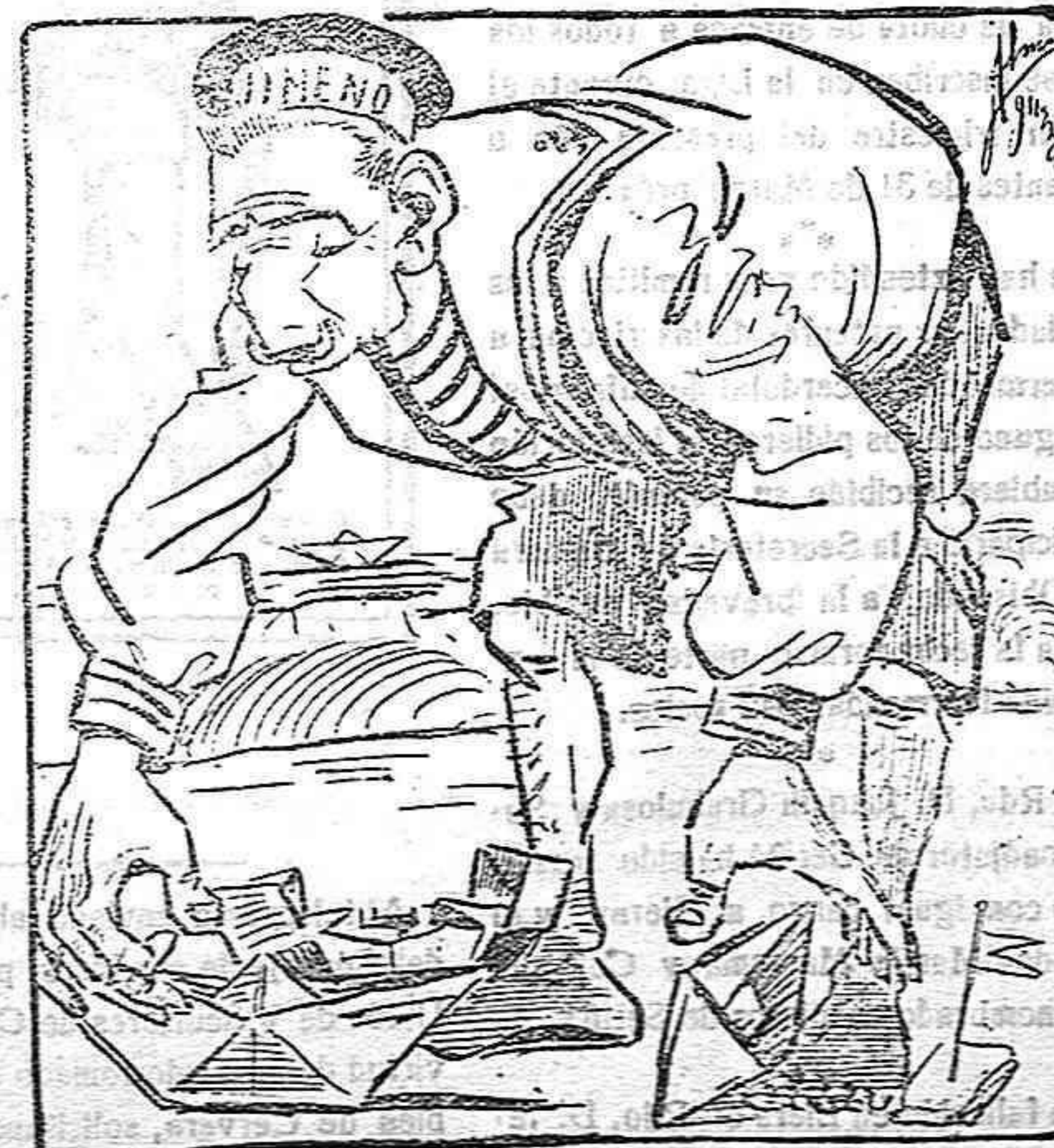
¡Bueno! ¿Y qué hago yo con estos birquichuelos?