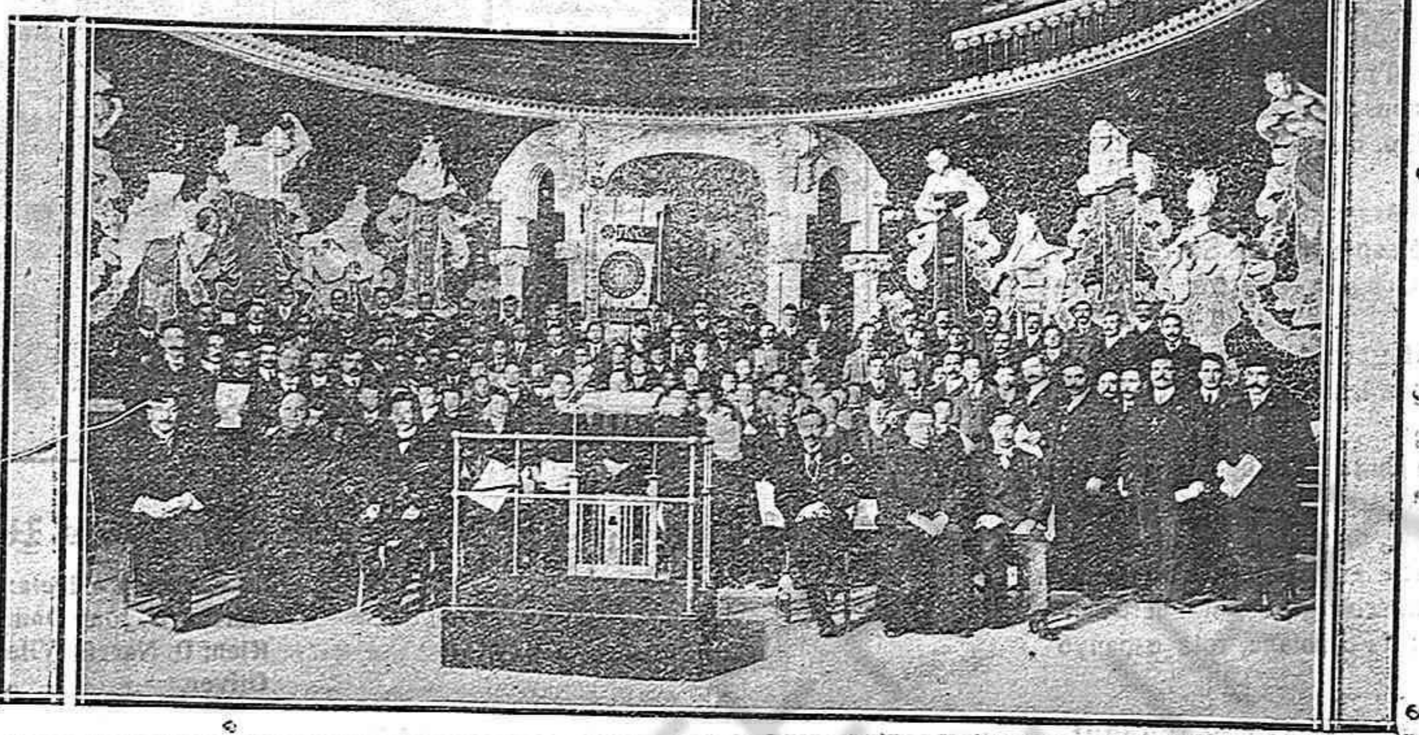
El conjunt de l' Orfeó

Ens es molt grat encapsalar la PAGINA amb la traducció de les paraules següents del nostre Ilm. Pr'eat.