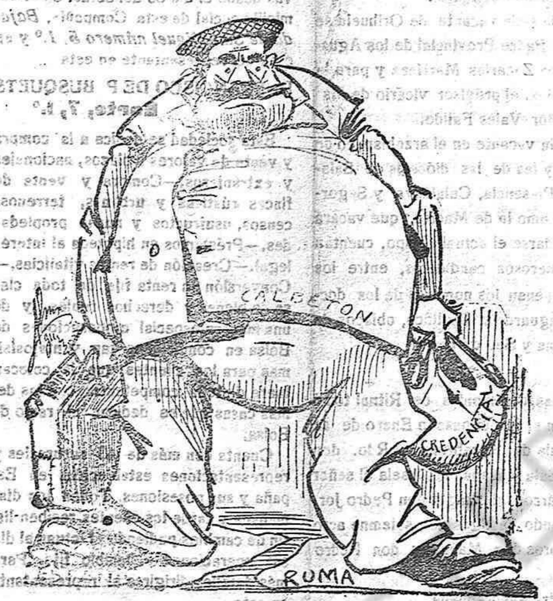
Ahí, con un pie aquí y otro allí; luego con uno allá y el otro acá; y .. vamos viviendo.